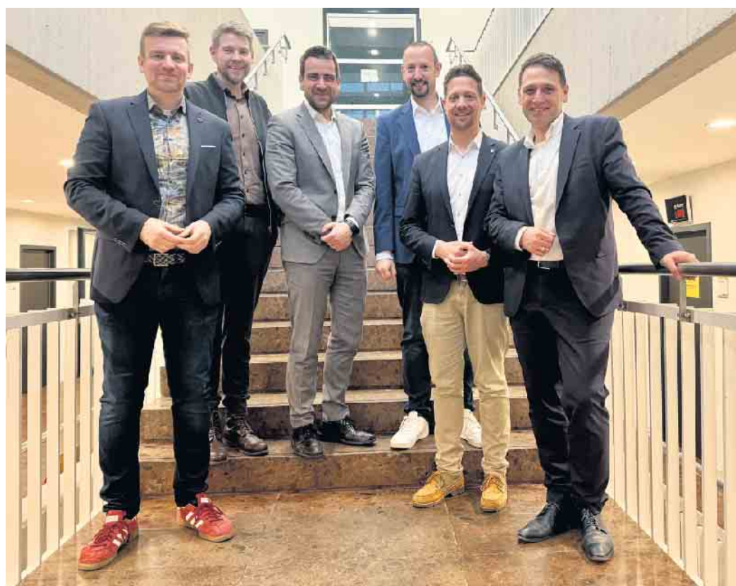
Die linksrheinischen Bürgermeister

„Der Schulbau ist für viele Kommunen über die Schmerzgrenze