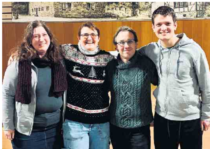
Neuer Vorstand von Aikibudo Odendorf e. V.

Ein wichtiger Punkt war die Weiterentwicklung der Vorstandsstrukturen, um Arbeitsprozesse im Verein künftig klarer und effizienter zu gestalten.