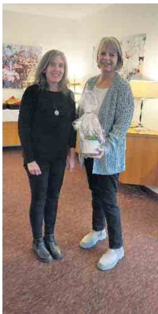
Danke an alle Ehrenamtlichen des Kinderschutzbundes

Danke an unsere Ehrenamtlichen der Stöberstübchen