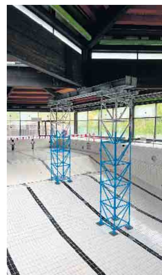
Mit Hilfe der Gerüstkonstruktion wird das Dach gestützt und die Öffnung des eifelbades ermöglicht.

In den letzten Jahren wurde kontinuierlich ins eifelbad investiert: Die Betriebs- und Belüftungstechnik sind auf aktuellem Stand, und mehrere Fließenspiegel wurden großflächig erneuert.