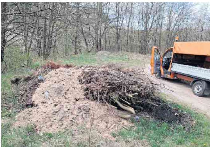
Illegale Bauschuttablagerung Mühlenberg

In den vergangenen Wochen wurde mehrmals an dem an der L 497 zwischen Houverath und Kirchsahr gelegenen Wanderparkplatz „Mühlenberg“ illegal Ast- und Wurzelwerk, vermischt mit Bau-