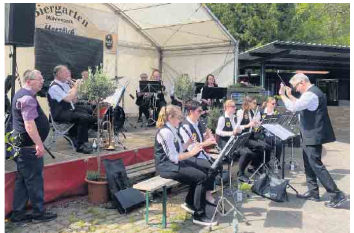
Für musikalische Unterhaltung bei Kaffee, Kuchen und kühlen Getränken im Mühlenpark-Biergarten sorgte die Bergkapelle Mechernich. Ihr Auftritt rundete einen rundum gelungenen Tag bestens ab.

Inhaltlich bot der Raderlebnistag eine gelungene Mischung aus Bewegung, Geschichte und Verkehrssicherheit. An der Burg Satzvey erwartete die Radler mittelalterliches Flair, während in Iversheim mit der römischen Kalkbrennerei ein echtes Highlight aus der