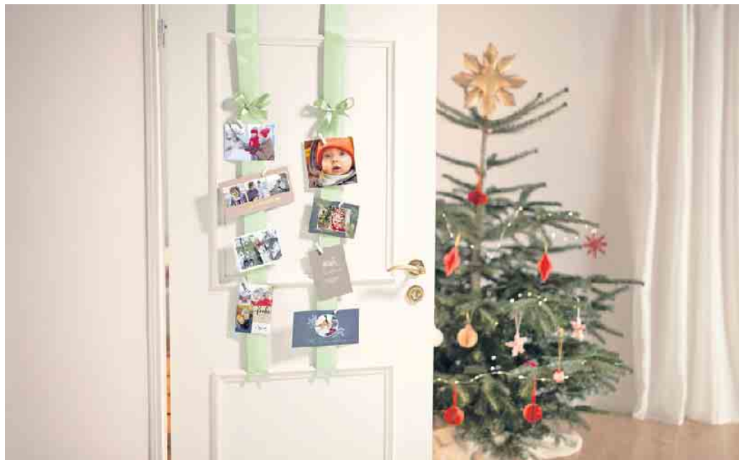
Die passende Dekoration weckt Vorfreude auf Weihnachten. Mit dekorativen Schleifenbändern lassen sich zum Beispiel Foto-Grußkarten stilvoll in Szene setzen.

einfach die Grußkarten mit Bändern und Klammern an dem Bügel befestigen und mit Tannenzweigen oder Schleifen verzieren. (DJD)