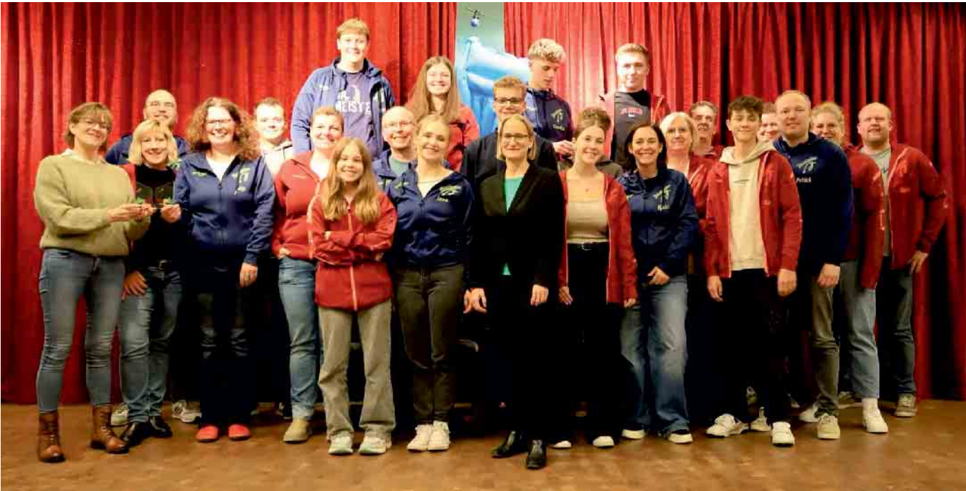
Vom Stück bis zur Beleuchtung, Theater handgemacht und selbstverfasst: Die Theatergruppe der Spielschar Lichtenau e.V.

Theatergruppe der Spielschar Lichtenau spielt Anja Ebners Komödie