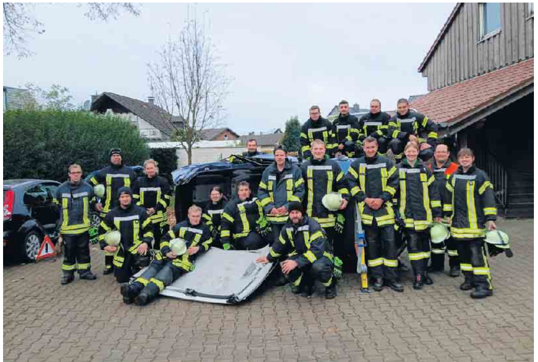
Nach Absolvierung des Ausbildungsmoduls „Technische Hilfe“ sind die Frauen und Männer der Löschzüge in gelöster Stimmung.

Die Ausbildung fand komplett beim Löschzug Haaren statt. Bei der praktischen Ausbildung konnte dabei auf die Unterstützung der Sintfeld Auto GmbH gezählt werden, von dort wurden die Übungsfahrzeuge zur Verfügung gestellt. Ein herzliches Dankeschön!