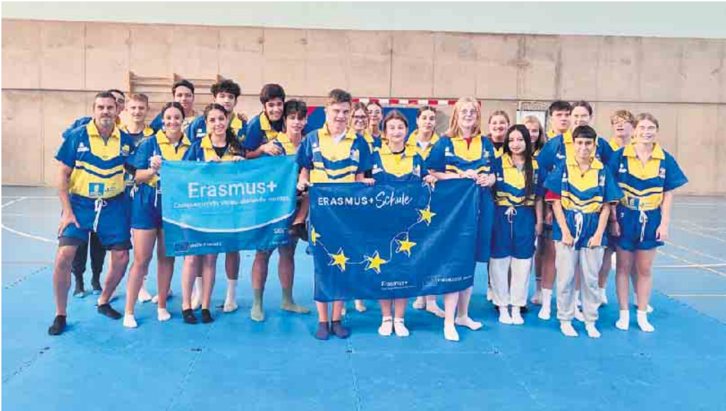
Schülerinnen und Schüler der Profilschule Fürstenberg mit den spanischen Gastgeberinnen und Gastgebern