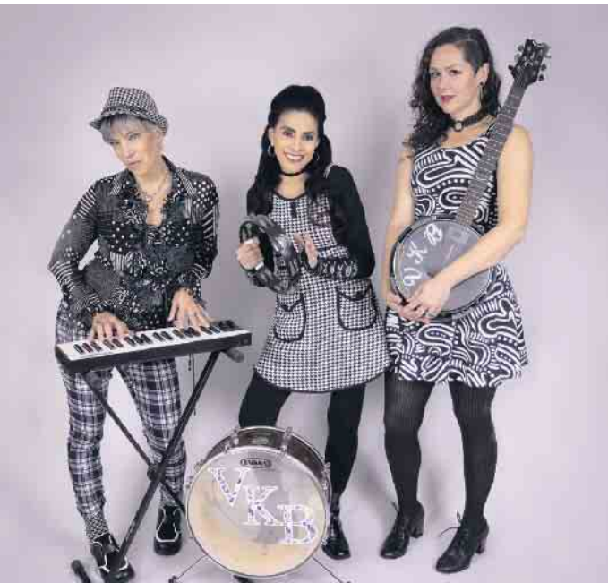
Die international gefragte VKB-Band ist am 17. Januar zu Gast in der Wöhler-Strandbar.