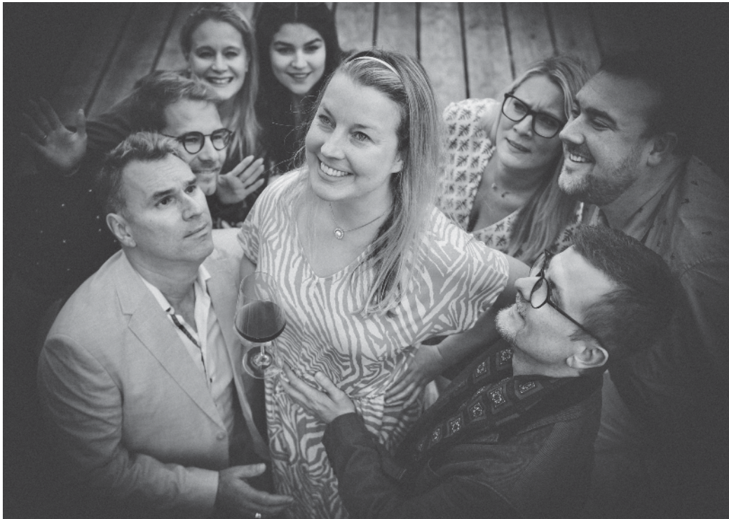
Es wird turbulent in Barabaras Liebesnest.

Bad Wünnenberg - Die Theatergruppe Bad Wünnenberg hat sich eine Komödie für die Saison 2025 ausgesucht, in der eine Frau in den „besten Jahren“ namens Barbara im Mittelpunkt steht. Eigentlich ist sie ganz friedlich, aber im toskanischen Ferienhaus gönnt sie sich hier und da eine Prise Randal und Liebe. Inmitten der sonnigen Toskana trifft sie sich schon seit Jahren mit ihrem italienischen Liebhaber Eduardo, um zu zelebrieren, was bei Ehemann Harald längst vergessen zu sein scheint. Und so wird Barbara immer erfinderischer, wenn es darum geht, ihr sonniges Liebesnest von Zeit zu Zeit mehr oder weniger beherrscht zu demolieren, um dann persönlich mit Eduardo „die Reparaturarbeiten zu beaufsichtigen“. Besser und sicherer sind Schäferstündchen kaum zu tarnen. Bis zu dem denkwürdigen Tag, den das Theater Publikum mitverfolgen darf. Ein Drahtseilakt für Barbara beginnt.