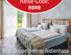
Bsp. Doppelzimmer Nebenhaus