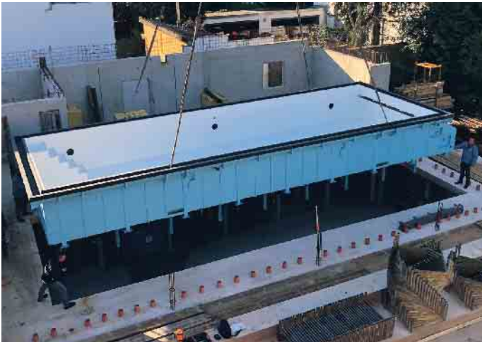
Poolbau mit Präzision.

Trotz konjunktureller Schwächen der Gesamtwirtschaft, schaut die Poolbranche optimistisch in die Zukunft. Denn gesellschaftliche Entwicklungen stärken den Wirtschaftszweig. Dazu gehören das zunehmende Gesundheitsbewusstsein sowie die Alterung der Bevölkerung, die den Wunsch