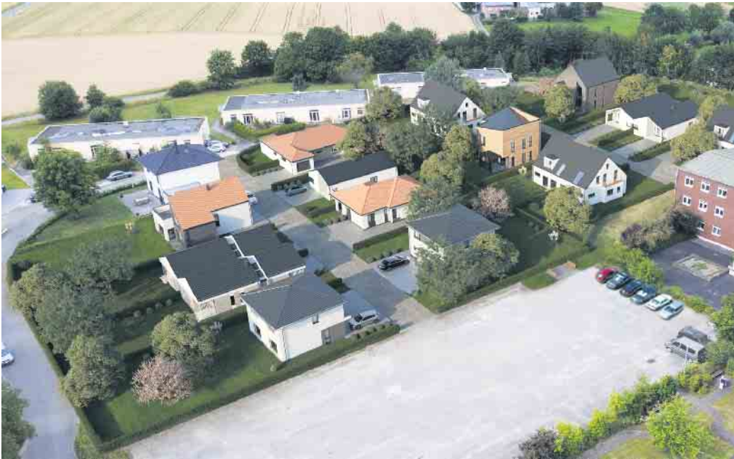
Grundstücksaufteilung Baugebiet Brakel Lütkerlinde

Rufen Sie uns an, damit wir Sie bei der Auswahl Ihres Traumgrundstücks beraten können! Weitere Informationen finden Sie auf der Projektseite unter www.lütkerlinde.de .