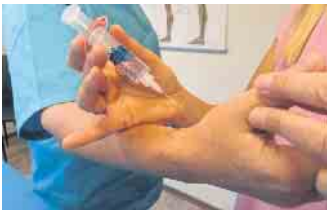
Auch die Eigenbluttherapie gehört zum erweiterten Portfolio.

Weitere Informationen über das Leistungsspektrum der Privat-