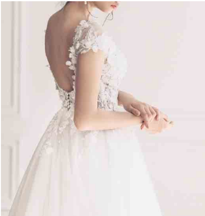
Traumhafte Brautmode wird während der Modenschau präsentiert