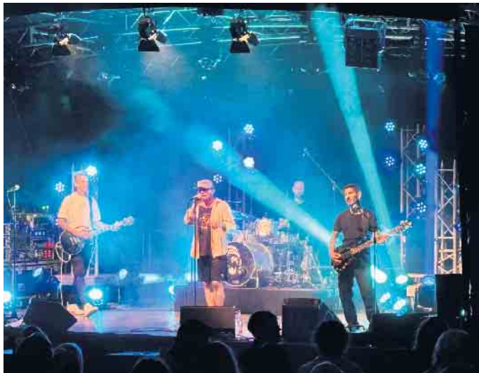
Die „Gogorillas“, Band aus Hannover, beim ScheunenSommer 2024 in Fürstenberg.

Sound der 90er, ein Jahrzehnt, in dem Rock, Brit-Pop, Crossover, HipHop, Grunge, New Metal verschmelzen. Ihr Motto: Rocking in the name of Green Day, The Offspring, Nirvana, Red Hot Chili Peppers, Limp Bizkit, Rage against the Machine und vielen mehr. Gleich der Einstieg ist eine Ansage. Der Frontmann und Sänger kommuniziert sofort mit dem Publikum. Der „Dancefloor“ vor der Bühne füllt sich direkt mit dem zweiten Song. Die Wahl der Band hatte eine jüngere Zielgruppe im Blick als in den beiden Vorjahren. Dieser Plan des Organisations- und Programmteams geht auf. Die Bereitschaft, direkt vor der Bühne zu tanzen, läßt also nicht lange