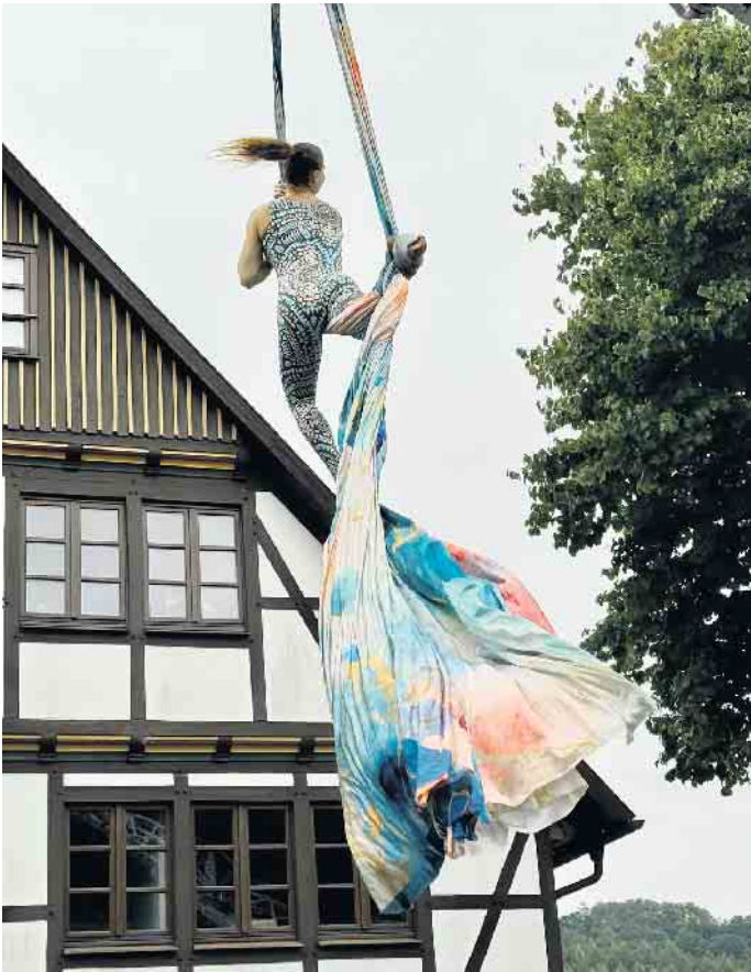
Grandiose Aufführung vor der Aatal-Apotheke - Artistin schwebt über dem nassen Asphalt.