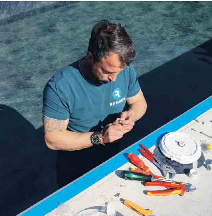
Ein Poolbau bei Sonnenschein.

und es hierzulande rund 16 Millionen Einfamilienhäuser, aber nur 2 Millionen private Pools gibt, ist Marktpotential vorhanden. Jobangebote findet man auf der Website des Bundesverbandes Schwimmbad & Wellness e.V. (bsw) unter www.bsw-web.de . (akz-o)