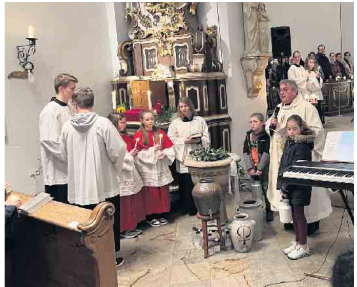
Die Fürstenberger Kommunionkinder waren auch an der Gestaltung des Gottesdienstes beteiligt.