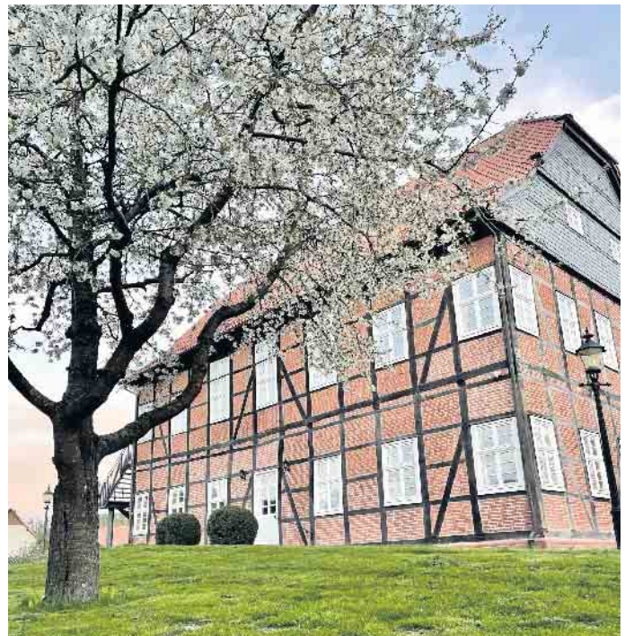
Der Spanckenhof wird eingerüstet, denn die Fassade muss saniert werden.

nischen Bauamtes der Stadt Bad Wünnenberg. Gemeinsam mit Fachwerkspezialisten wurde der Ist-Stand geprüft und notwendige Sanierungsmaßnahmen besprochen. Die gesamte Sanierung dauert je nach Wetterbedingungen bis Herbst 2023. Der Spanckenhof wird nach den Osterfeiertagen eingerüstet. Die Räume im Gebäude können weiterhin genutzt werden.