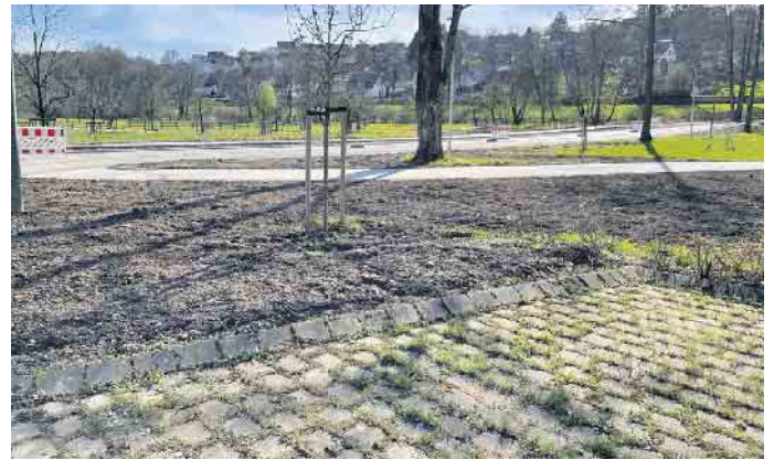
Mit dem neuen Gehweg geht es noch besser fußläufig ins Naturerlebnis Aatal.

Zusätzlich wurde ein Gehweg entlang der Obstbaumwiese bis hoch zur Straße „Im Aatal“ angelegt. Durch eine neue Querungshilfe zum Hoppenberg sind das Waldschwimmbad und der Barfußpfad zukünftig noch besser fußläufig erreichbar. Entlang des Gehwegs werden in einem nächsten Schritt solarbetriebene Straßenlaternen installiert.