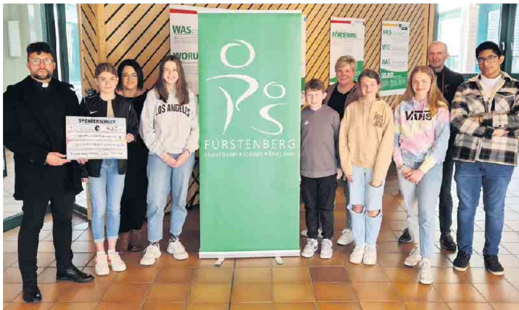
Übergabe der Spenden für die Erdbebenopfer in der Türkei und Syrien

Unter dem Motto „Jeck für einen guten Zweck“ wurde der Mitt-