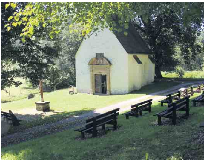
Die Husener Annenkapelle ist ein Kleinod und Ausrichtungsort der 12. Maiandacht in Husen.