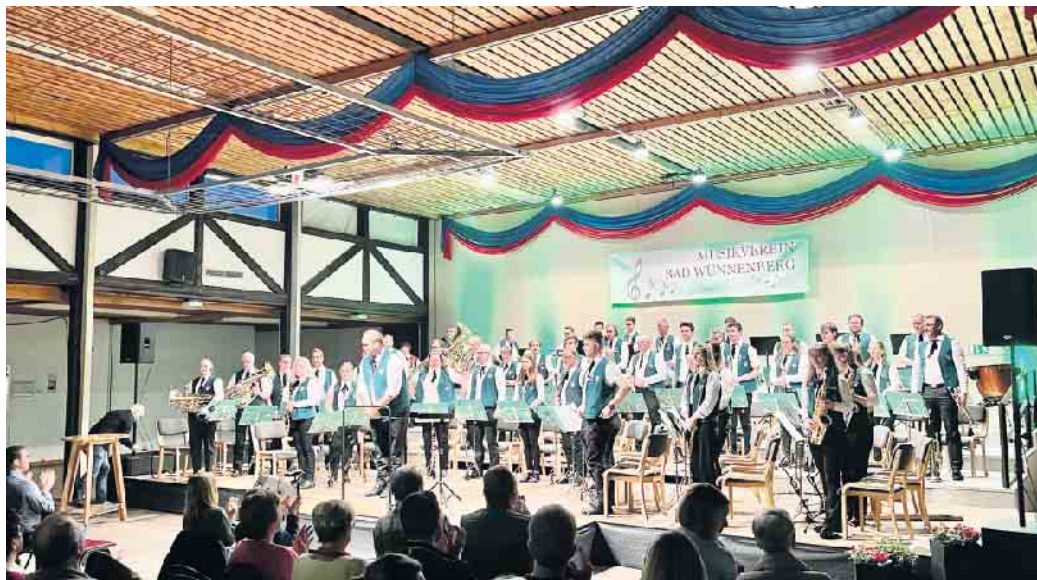
Der Musikverein Bad Wünnenberg begeisterte mit einer gelungenen Musikauswahl.

Eine Kostprobe für die Auftritte zu Festen, insbesondere zu den Schützenfesten der 2023er Saison.