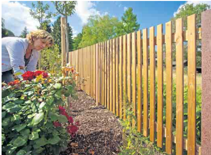
Vom Sichtschutz bis zum Terrassenbelag: Der nachwachsende Rohstoff Holz bietet für den Garten unzählige Gestaltungsmöglichkeiten.