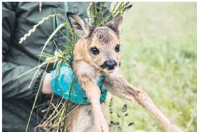
Gerettetes Rehkitz. Gleich wird es freigelassen.