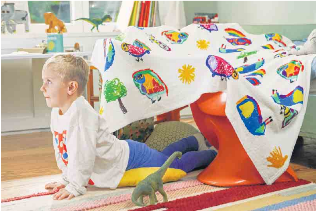
Diese Kuscheldecke gibt es nur einmal: Kinderzeichnungen sorgen für einen unverwechselbaren Look und machen aus dem Osterpräsent ein Unikat.

Doch nicht nur die Kids, sondern auch Erwachsene freuen sich über gelungene Überraschungen im Osternest. Ein Foto-Schlüsselhänger mit einem Schnappschuss der Familie begleitet die beschenkte Person über lange Zeit. Auch sogenannte Little Prints auf Premium-Fotopapier lassen sich kreativ gestalten. Bis zu vier Herzensmomente finden Platz auf einem Foto-Magnetstreifen. Das Präsent haftet auf allen magnetischen Oberflächen und kann so-