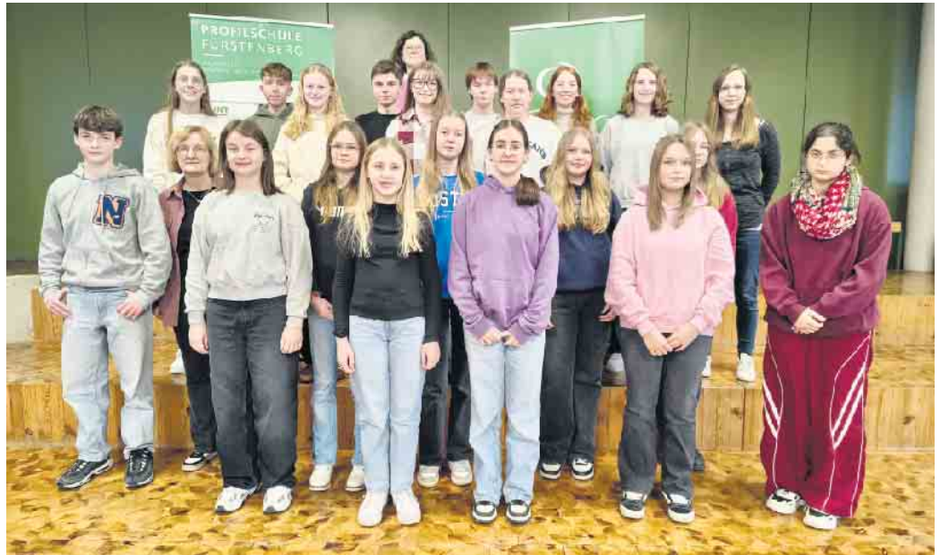
Gute Aussichten für die Absolventen im Fach Französisch an der Profilschule in Fürstenberg.