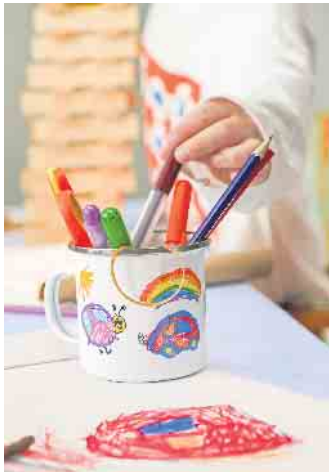
Eine Zeichnung der Kids schmückt den neuen Lieblingsbecher aus Emaille.

mit von der Kühlschranktür bis zum Schlüsselboard überall im Haushalt dekoriert werden. Noch ein Tipp: Ein guter Tropfen ist als Mitbringsel zum Osterbrunch immer eine gute Idee. Wer vorher zum Beispiel unter www.celewe.de ein Foto-Etikett mit persönlichen Motiven entwirft, macht aus jeder Flasche ein Einzelstück und schafft somit besondere Genussmomente. (DJD)