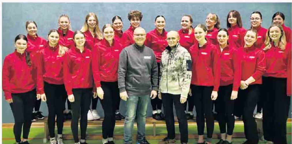
Rote Funken und ihre Sponsoren.