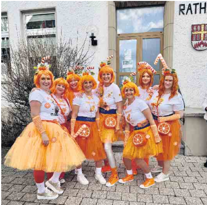
Aperol Spritz — Eine Hommage an Cocktails im Sommer.