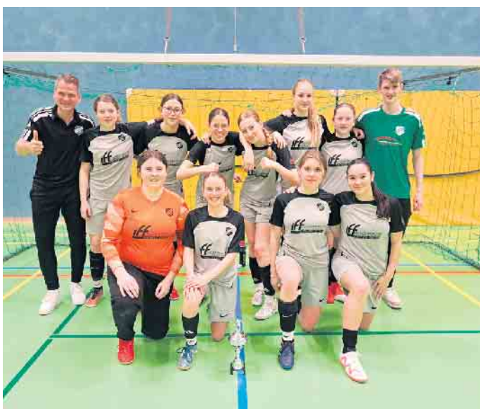
Erfolgreiche jugendliche Fußballerinnen

bis hin zu einem zwölfköpfigen Starterfeld in der E-Jugend am Sonntag alles, was man im Jugendfußball gerne sieht: viele Tore, glückliche Kinder und zufriedene Trainer. Am Samstagnachmittag fand das Turnier der B-Juniorinnen statt, wo sich in dem starken Teilnehmerfeld am Ende die JSG Büren-Fürstenberg als Heim-Mannschaft durchsetzen konnte und ausgiebig feierte. Natürlich durfte auch ein Turnier für die Damenmannschaften des BSV Fürstenberg nicht fehlen, und schließlich hieß es am späten Sonntagnachmittag Platz 3 für die Damen des BSV, was am Ende des Turniers ausgiebig gefeiert wurde.