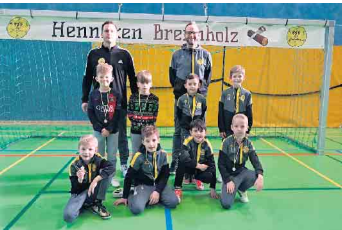
Erfolgreiche jugendliche Fußballer