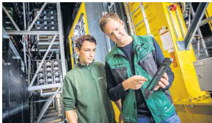
Die Ausbildung zur Fachkraft für Lagerlogistik in der Brauerei dauert drei Jahre, Voraussetzung ist ein Hauptschulabschluss.