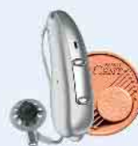
ViO E, diskret und leistungsstark

Testen Sie 14 Tage kostenfrei Hörgeräte der neusten Generation.