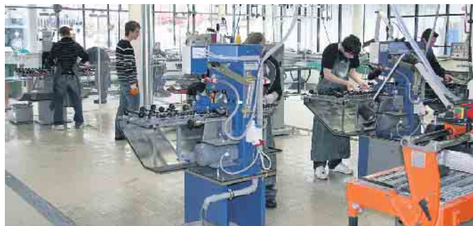
Ausbildung in der Flachglasindustrie.

Der Flachglastechnologe stellt Glasplatten für die unterschiedlichsten Einsatzzwecke her. Diese werden zum Beispiel für Möbel benötigt, aber auch für Türen, für Spiegel oder ganz klassisch für den Fenster- und Türenbau sowie für die Fahrzeugindustrie. „Zu den Aufgaben des Flachglastechnologen zählt der Zuschnitt inklusive des Schleifens und Polierens der Glaskanten sowie die Herstellung des fertigen Produkts mittels der Steuerung moderner Produktionsmaschinen“, erklärt der Hauptgeschäftsführer des Bundesver-