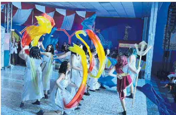
Die Leiburger Blauen Funken regeln das „Chaos im Olymp“.

Junioren-Tanzgarde des FCC ließen keinen Zweifel an der hochklassigen Ausbildung durch die Trainerinnen aufkommen - tosender Applaus. Der Auftritt des Herrenballetts zeigte, dass auch Männer tanzen können. Wie schön. Auch hier jubelte das Publikum. Schließlich kam es erst nach Mitternacht zum großen Finale!