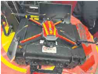
Feuerwehr-Drohne in neuester Ausführung.