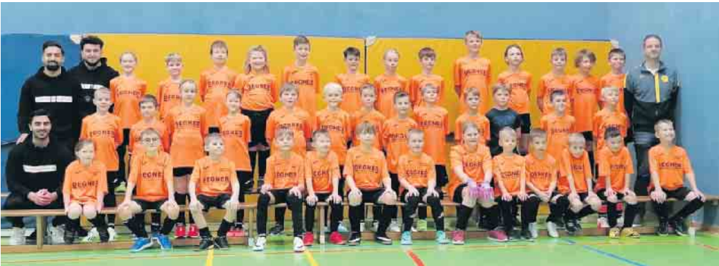
Nach diesem Camp können alle besser kicken.

zer fanden. Eine gelungene Aktion und ein toller Start ins neue Jahr.