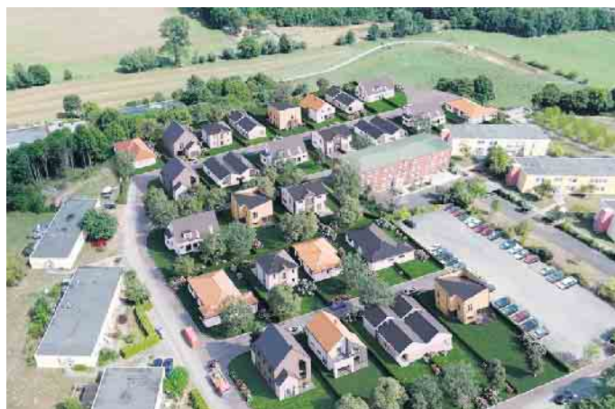
Bebauungsbeispiel für das Neubaugebiet Lütkerlinde

der kaufvertraglichen Abwicklung. Weitere Informationen und einen Teilungsvorschlag der Grundstücke finden Sie auf der Projektseite unter www.lütkerlinde.de .