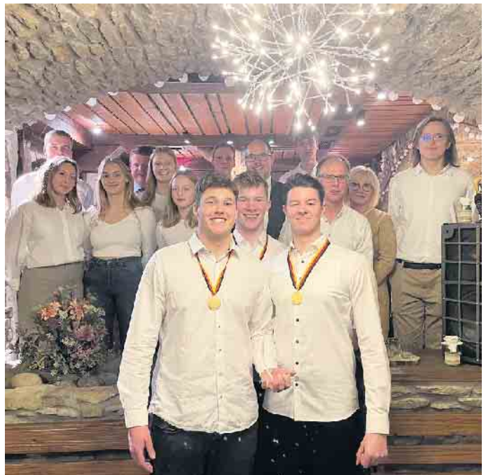
Erfolgreiche Schwimmerinnen und Schwimmer des DLRG Bad Wünnenberg feiern mit Sponsoren und Trainern.

Zudem dankte er den Rettungsschwimmerinnen und Rettungsschwimmern, die in den Sommermonaten immer wieder im Waldschwimmbad unterstützen.