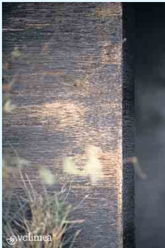
Zeitlos elegante Wandbeschichtung von Volimea

tik-Bronze Veredelung sowie Rost-Spachtel mit Antik-Messing. In Verbindung mit Lichteinfall treten wechselnde Eindrücke und Effekte durch die kreativ strukturierten und gemusterten Oberflächen auf, die den Räumen ein außergewöhnliches Ambiente verleihen. Wandbeschichtungen von grandezza verfügen im Gegensatz zu Tapeten über eine große Robustheit, starke Haftkraft und Langlebigkeit. Renovierungsintervalle werden somit verlängert. Der Grundspachtel von grandezza dient der Modellierung und ist in unterschiedlichen Strukturen und Farben erhältlich. Alle Oberflächen lassen sich anschließend durch die metallischen Spachtel und Patinas veredeln. Ihr Malerbetrieb Schnorbus berät Sie gerne zu Ihrer individuellen, fugenlosen Wand- und Bodengestaltung. [BL]