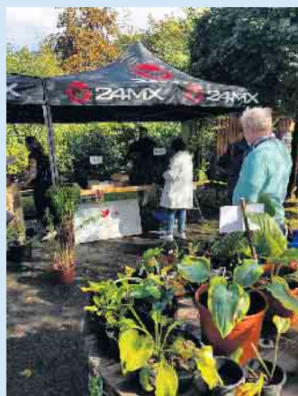
Die erste Aktion dieser Art fand viel Zustimmung.

Weitere Eindrücke gibt es unter www.niedersfeld.info und wer