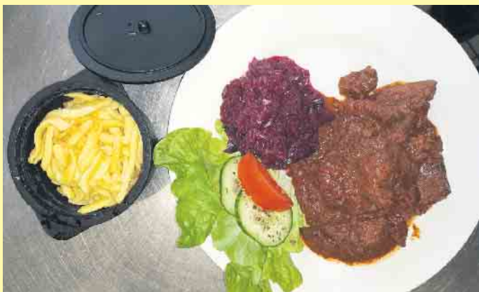
Deftiges Weihnachtsgericht in der Clemensberghütte