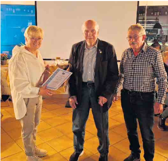
Ehrung langjähriger Mitglieder

Einmal im Monat treffen sich die Mitglieder des Arbeitskreises „SK-Zukunft“ und erarbeiten Vorschläge und Lösungen, die den Verein in eine erfolgreiche Zukunft lenken sollen. Gedacht ist hierbei den klassischen Vorstand durch eine Team-Struktur zu ersetzen und so die Aufgaben in kleinere Päckchen auf mehrere Schultern zu verteilen. Weitere Informationen darüber gibt es auf der Internetseite des Skiklubs unter www.sk-winterberg.de