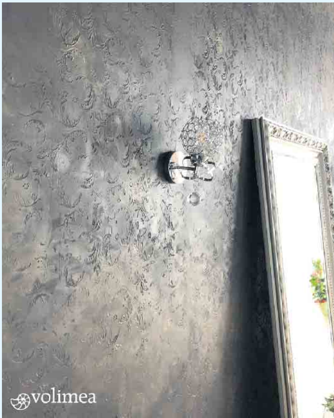
Blickfang in Silber mit Struktur von Volimea

grandezza “. Die brandzertifizierte Effektbeschichtung von grandezza eröffnet unzählige Gestaltungsmöglichkeiten. Zu den Gestaltungsmöglichkeiten von grandezza zählen veredelte Blattgoldimitationen, Lederoptiken mit Patina oder mit einer An-