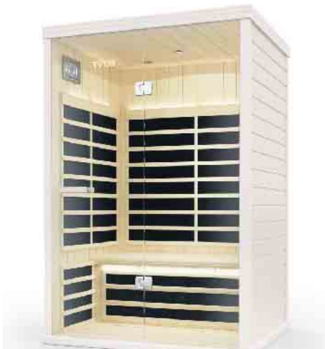
Infrarotkabinen in Funktion!