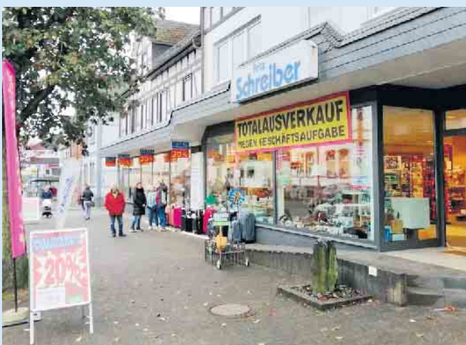
Schnäppchenjäger kommen jetzt bei Fa. Schreiber voll auf ihre Kosten