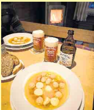
Speisen in der Clemensberghütte