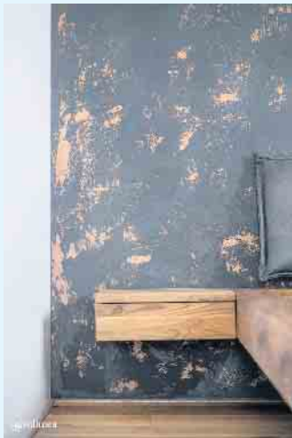
Edle Wandoberfläche mit Kupferfarben von Volimea