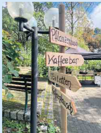
Liebevoll hergerichtet: Der „Josefs- garten“ in Niedersfeld