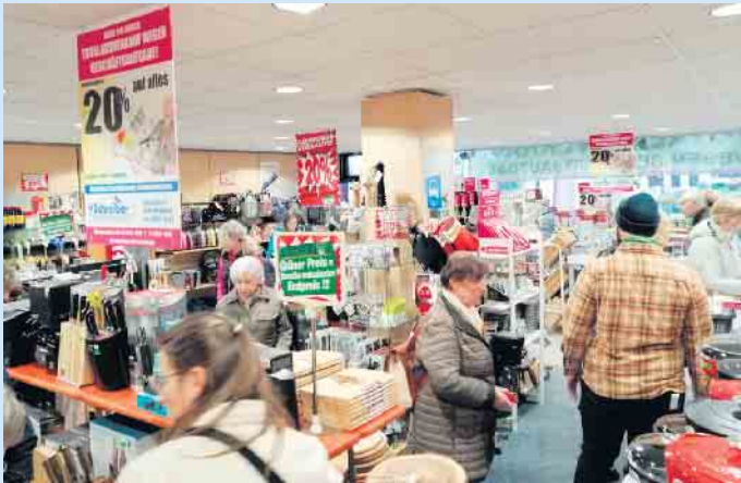
Die Firma Fritz Schreiber in Medebach mitten im Räumungsverkauf