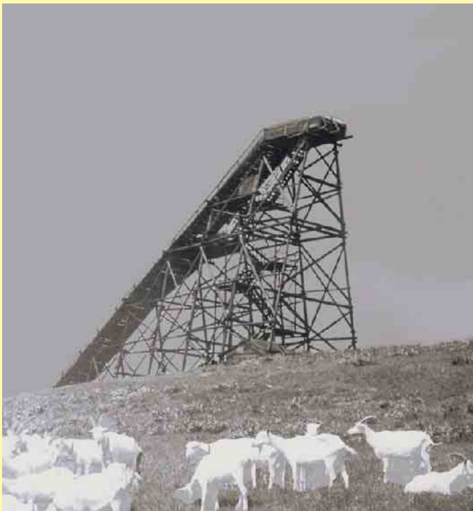
Die alte St. Georg Sprungschanze in Winterberg