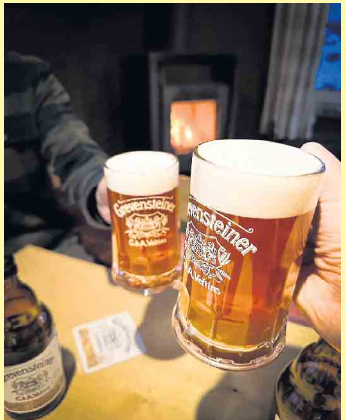
Wohl bekomm's in der Clemensberghütte

Die Küche ist ab 12.30 Uhr durchgängig geöffnet und wie lange, richtet sich nach der jeweiligen Anzahl der Besucher. Nach Absprache auch länger. Die Speisekarte enthält schmackhafte, selbstgemachte Gerichte. Das Team um Barbara Straeck freut sich auf alle Einkehrer. [BL]