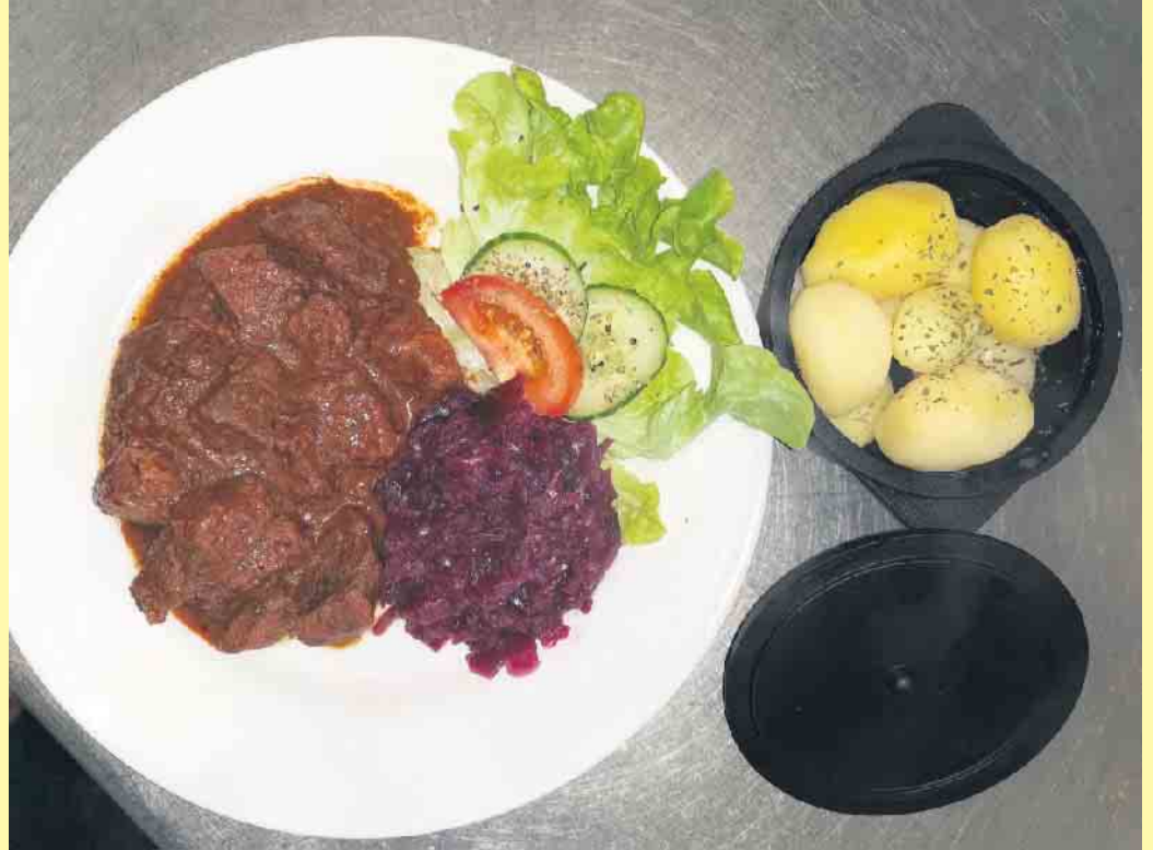
Schmackhaftes Gulaschgericht in der Clemensberghütte

Alle Gerichte können auch bestellt und abgeholt werden. Die Bezahlung kann wahlweise