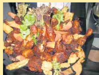
Haxengericht aus der Schloßberg-Alm