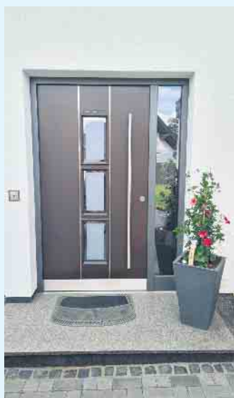
Moderne Haustür von der Tischlerei Holztec

Wohnungstüren sowie Trennwänden und Trennwandsystemen mit Gleittüren, auch die Nachrüstung von Fenstern und Türen mit Sicherheitssystemen und Beschlägen, den Einbau hochwertiger Isoliergläser, Reparaturarbeiten an Fenstern, Rollläden, Möbeln und die Planung und Montage von Sonnenschutz, Insektenschutz und Markisen. Zum Aufgabengebiet von Andreas Koch gehört auch die Fertigung von Balkonen, Zäunen und Sichtschutzelementen aus Kunststoff, Holz und Glas, auch in Kombination mit Edelstahl. [BL]