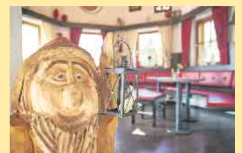
Urige Räumlichkeiten in der Schneewittchenhütte