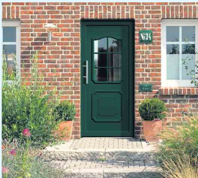
Haustür von der Tischlerei Holztec im Landhausstil