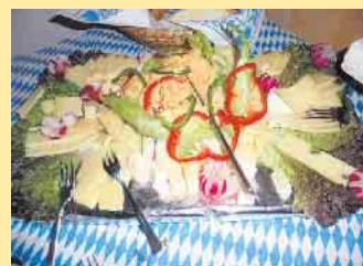
Bayrische Schmanckerl, in der Schloßberg-Alm

zusätzlich angeboten. Unser Es- cape-Spiel Outdoor geht los ab 4 Personen und Bogenschießen für Gruppen ab 10 Personen. Mehr Info unter www.aktiv-im-sauerland.de