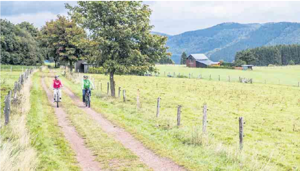
Fantastische Radwege locken in die Ferienwelt Winterberg mit Hallenberg bei der Radwoche mit attraktiven Angeboten für alle Generationen vom 7. bis 15. September.

Rauf aufs Fahrrad und ab in die Natur! Ob Mountainbike, E-Bike, Renn- oder Gravelrad - die beliebte Radwoche in der Ferienwelt Winterberg mit Hallenberg vom 7. bis 15. September bietet sowohl für sportlich ambitionierte Radbegeisterte als auch für gemütliche Touren-Radler ein attraktives Programm. Angeboten werden für alle Generationen unter anderem geführte Touren auf dem Mountainbike, dem Gravelbike und dem Rennrad. Zudem gehört auch ein Fahrtraining für Kinder und Erwachsene zum Angebot der Radwoche. Und wer mag, kann sich am 7./8. September die Mountainbike-Bundesliga im Trailpark Winterberg anschauen sowie am 15. September bei der spannenden Zielankunft der Sauerlandrundfahrt am Kahlen Asten mitfeiern.