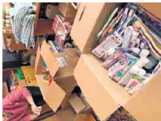
Hygieneartikel und Medikamente Pflege und Altenheimen mit viele Flüchtlinge