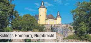
Schloss Homburg, Nümbrecht

Einzelzimmerzuschlag: 20 €/Nacht Kurtaxe: ca. 1 € pro Person/Nacht