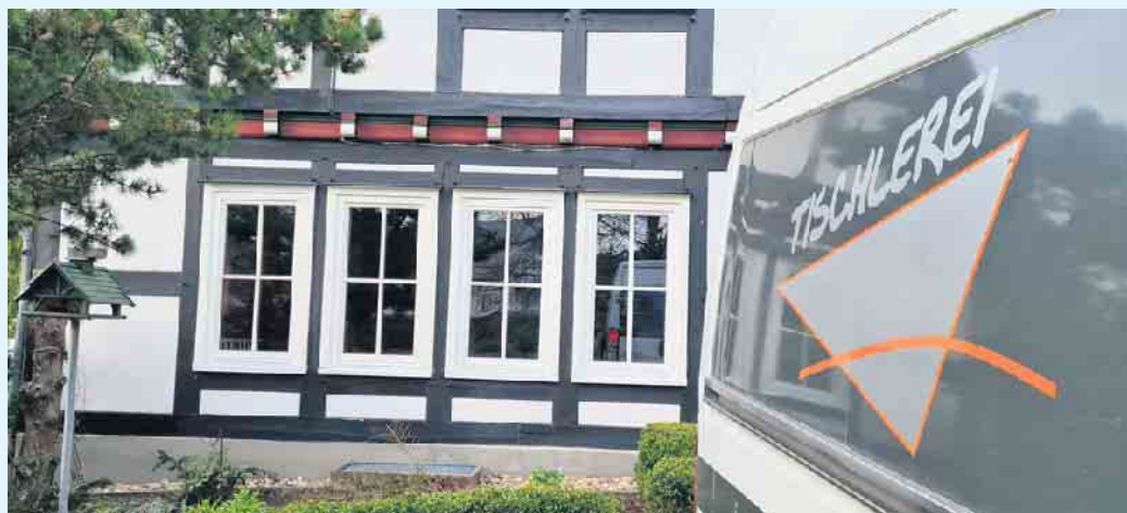
Fenstermontage von der Tischlerei Holztec