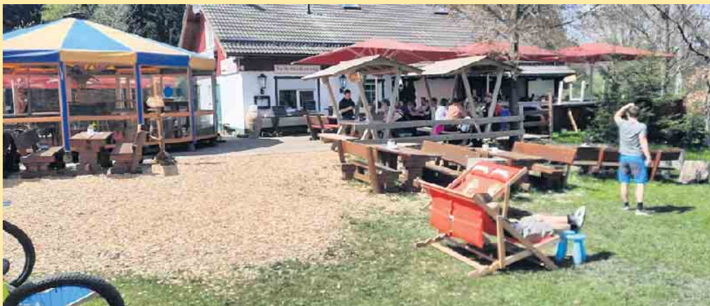
Die Schloßberg-Alm mit Schirmbar am Fuße des Schloßbergs

Mit leckeren bayrischen Schman- kerl, guter Stimmung und Musik erwarten wir Euch zum diesjähri- gen Oktoberfest in der Schloss- berg Alm. Los geht's am Donners- tag, 03.10.24 (Feiertag) bis Sonntag, 06.10.24. Wir starten um 11.00 Uhr. Die Küche bleibt am Oktoberfest bis 20.00 Uhr geöffnet.