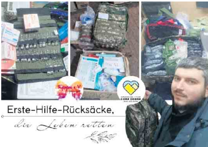
Einige Beispiele von Projekten, die mit Spenden aus dem Hochsauerland unterstützt wurden: Medizinale Rucksäcke für Ärzte an der Front

In der Ukraine arbeiten wir intensiv zusammen mit Mitgliedern von Gora Dobra (Berg des Guten, 2023 von fünf jungen Ukrainern/Innen gegründet). Sie fahren in Alten- und Pflegeheime, Einrichtungen für behinderte Menschen und Kinderheime, wo die eigentlichen Verlierer des Krieges leben, die keine Chance zur Flucht haben. Außerdem kooperieren sie mit anderen Hilfsinitiativen z.B. der Aktion „Medizinische Rucksäcke“, die an Ärzte und Rettungssanitätern an die Frontlinien geschickt werden, um direkt verwundete Soldaten zu versorgen und zu retten. Unterstützen Projekte wie Feldküche zur Nutzung in zerstörten Gebieten nah an der Frontlinien. Gora Dobra hat daneben Post Genehmigungen in der Ukraine, um Paketen ganz gezielt nach Orten zu schi-