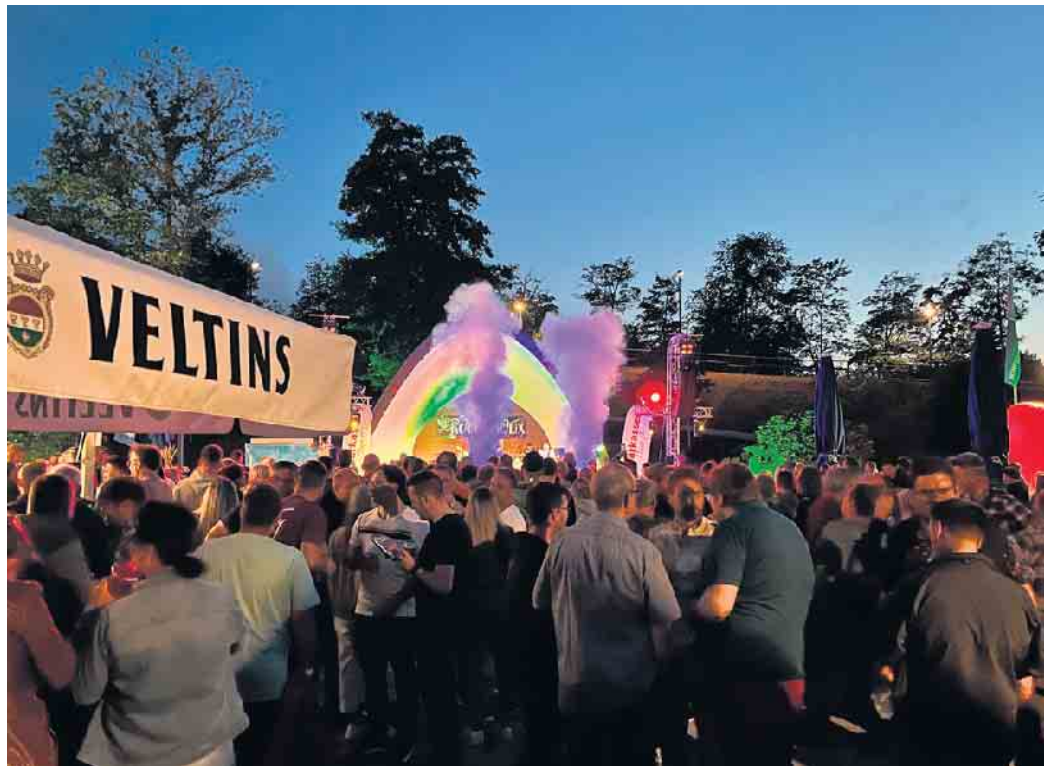
Das Sparkassen Open Air 2024 war ein großer Erfolg.

Erst schwappte die Neue Deutsche Welle über, dann wurde es rockig und schließlich lockten die besten Pop- und Rocksongs sowie Party-Hits der letzten Jahrzehnte an die Musikmuschel im Aktiv- und Vitalpark Winterberg. Kurzum: Das Sparkassen Open Air 2024 war ein großer Erfolg. Dies dokumentieren auch über 1700 begeisterte Gäste, die es sich nicht entgehen ließen, bei bestem Wetter drei schöne Mittwoch Abende bei kühlen Getränken in bester Gesellschaft zu genießen, zu tanzen und auch lautstark mitzusingen. Möglich machten dies „Die Goldenen Reiter“, „RockaholiX“ und „kraftstoff“ - drei fantastische Bands, denen es fast spielerisch gelang, mit hochklassigen Auftritten für eine außergewöhnliche Festival-Stimmung zu sorgen. Die Organisatoren des Stadtmarketingvereins Winterberg mit seinen Dörfern sowie die Partner und Unterstützer zeigten sich nach dem Finale am Mittwoch sehr zufrieden mit der Resonanz der Konzert-Trilogie. Dank an die Unterstützer des Festivals „Rund 1700 Konzertgäste, eine super Stimmung und eine fantastische Resonanz bei allen Gästen. Das Sparkassen Open Air ist und bleibt ein echtes Highlight im Veranstaltungskalender und war auch 2024