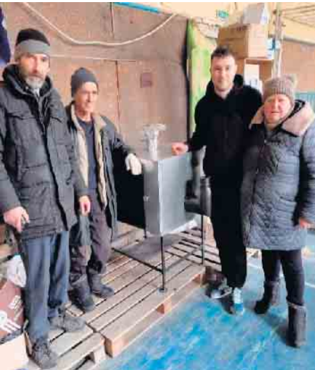
Brotbackmaschine abgelegenes Ort