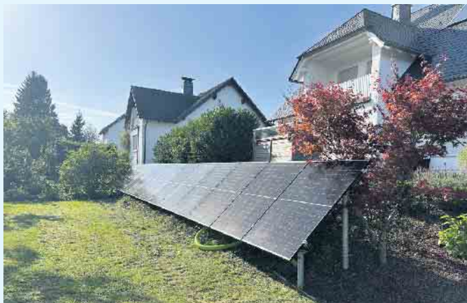
Eine PV-Anlage muss nicht zwingend auf einem Dach angebracht werden

Modernste Technik vom Meisterbetrieb Menke