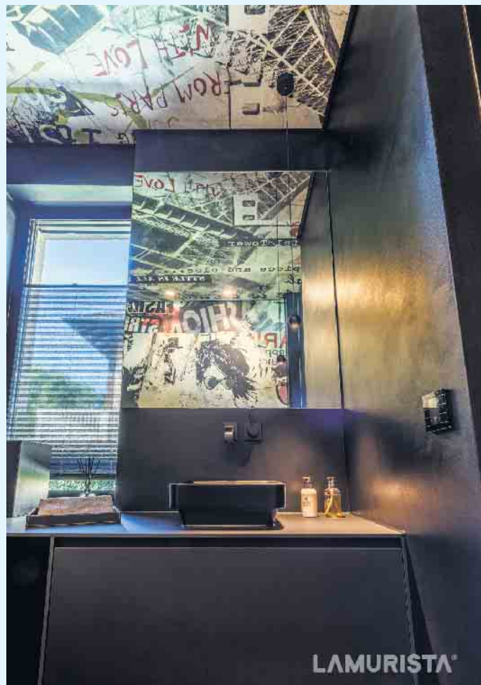
Ausgefallene Gestaltungsmöglichkeiten von LAMURISTA