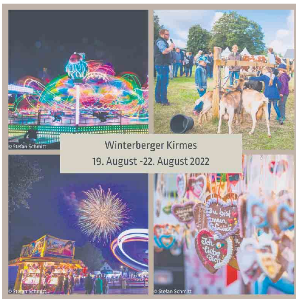
Winterberger Kirmes 19. August - 22. August 2022

Traditionell am dritten Wochenende im August findet die Winterberger Kirmes statt. An vier Tagen lebt die jahrhundertealte Kirmestradition in Winterberg wieder auf. Geselligkeit, buntes Kirmestreiben, Tierschau, ein einladender Krammarkt und ein Höhenfeuerwerk zum Abschluss. >>> weitere Informationen ab Seite 2