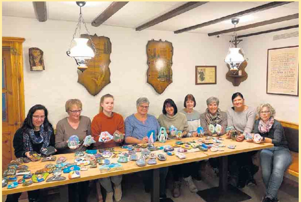
Die Bürgerinitiative „Sauerlandstones“

Fast jeder kennt sie: Glatte Natursteine, bunt bemalt. Die „Sauerland-Stones“ haben die Herzen der Wanderer erobert und eine Sammelleidenschaft ausgelöst. Findet man einen solchen Stein, kann man ihn mitnehmen und an anderer Stelle wieder „auswildern“ oder ihn behalten. Inzwischen gibt es sogar eine Bürgerinitiative, die „Sauerlandstones“, eine Community, die sich ganz den bunten Steinen widmet. Die Mitglieder der mittlerweile größten Bürgerinitiative hat sich ganz dem Malen und Gestalten von Steinen verschrieben, die allesamt kleine Kunstwerke und Unikate darstellen. Daraus entstanden auch Spendenaktionen. Im letzten September wurden erstmals 800 bemalte Steine gegen eine Spende für die Flutopfer bei einer Wanderhütte in Olpe/Elspe weitergegeben. Über 1000,- € brachte die Spendenaktion ein und sofort war klar, dass es nicht die letzte sein sollte! Kurzerhand wurde dort zwei Monate später die nächste Spendenaktion ge-