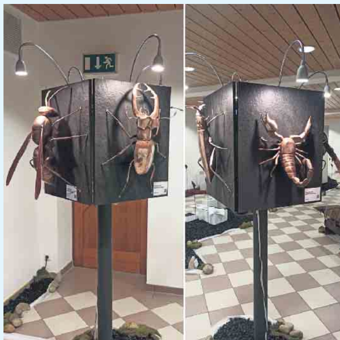
Ausstellungsobjekte von Metallkünstler M. Tuss in Schönau