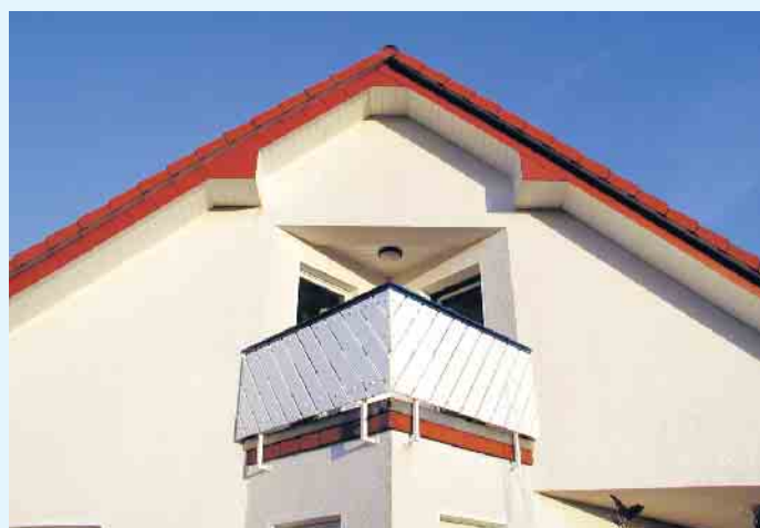
Balkongestaltung im Giebel

as Koch gehört auch die Fertigung von Balkonen, Zäunen und Sichtschutzelementen aus