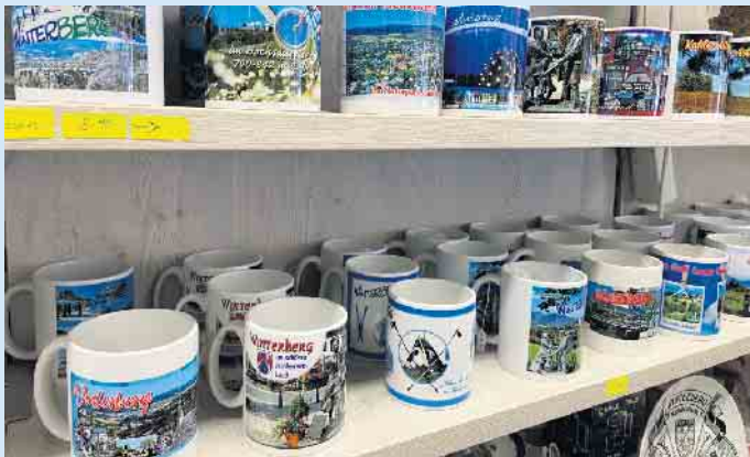
Beliebte Objekte: Die Tassen mit Motiven aus der Region von M & M Geschenkeideen