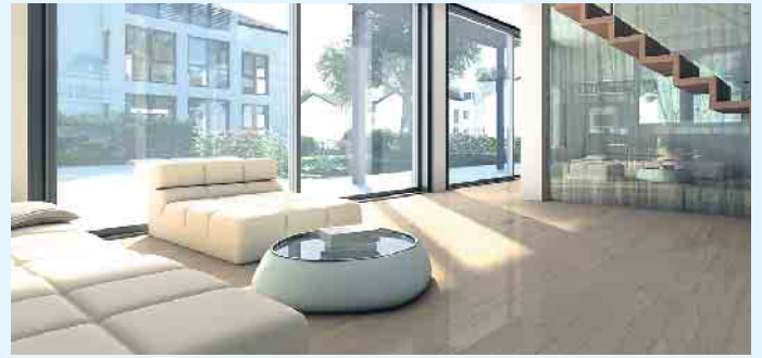
Gerade bei frei zugänglichen Terrassentüren bietet sich Sicherheitsglas besonders an.

Gehwege von Schnee oder die Beleuchtung und Sicherung von Treppen. „Bei einem Unfall hat der Hauseigentümer nachzuweisen, dass er seiner Verkehrssicherungspflicht nachgekommen ist“, erklärt BF-Hauptgeschäftsführer Jochen Grönegräs. Während der Einsatz von Glas in öffentlichen und gewerblichen Gebäuden in Deutschland klar geregelt ist, gibt es für die Kriterien zur Verkehrssicherheit im Privatbereich nur sehr allgemeine Formulierungen. „Da auch hier immer häufiger großflächige, bodengebundene Verglasungen zum Einsatz kommen, empfehlen wir Bauherren, unbedingt auf Nummer sicher gehen“, betont Grönegräs. „Gerade bei frei zugänglichen Terrassentüren oder raumhohen Schiebetüren aus Glas soll-