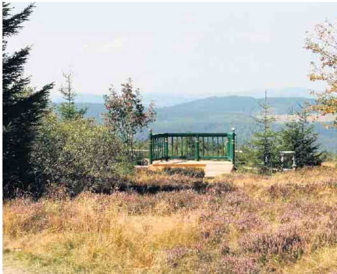
Der Landschaftsbalkon lädt auf der Hochheide zu einer kleinen Auszeit ein.

„Wir möchten mit dem Hochheidetag natürlich insbesondere die Natur, ihre Historie und Funktion sowie den Schutz- und Nutzwert in Szene und in Wert setzen. Ziel ist es, auf spannende sowie vielfältige Art und Weise Wissen zu vermitteln sowie Spiritualität, Gesundheitsprävention, Naturerleben, Entschleunigung und Regionalität in den Mittelpunkt des Geschehens zu rücken“, sagt