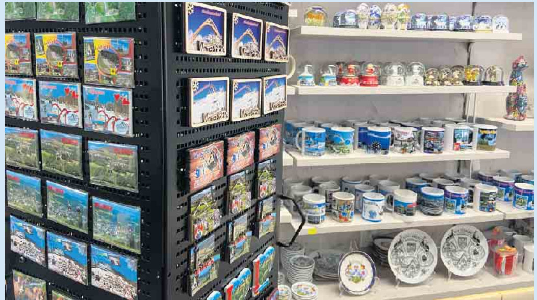
Große Auswahl an Souvenirs bei M & M Geschenkeideen

Im gemütlichen Geschenke- und Souvenirgeschäft M & M Geschenkeideen am unteren Waltenberg in Winterberg sind diverse Souvenirartikel aus der Region in großer Auswahl zu bekommen. Nicht nur für Urlauber, sondern auch für Heimatverbundene und Liebhaber unserer schönen Region, dem Sauerland. Das Sortiment der Winterberg-, Kahler Asten- Willingen-, Medebach- und Rothaarteig-Souvenirs sowie Wanderartikel wächst und ist sehr beliebt: In Form von Glas-, Porzellan- und Keramiksouvenirs wie Krügen, Tassen und Tellern, aber auch Magneten, Fingerhüten, Aschenbechern, Schneekugeln, Taschenmessern, Flaschenöffnern, Schlüsselanhängern, Kugelschreibern und vielem mehr. Noch diesen Sommer kann man sich hier 30% auf alle Caps und Sommerhüte