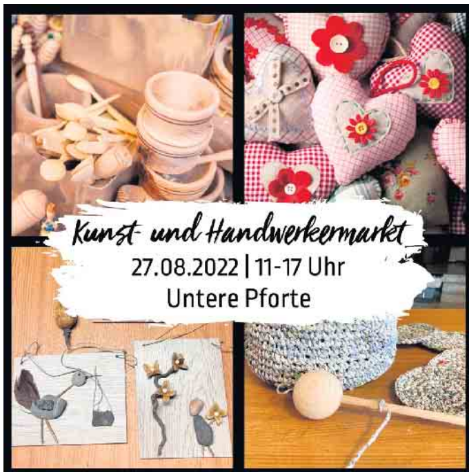
Der erste Kunst- und Handwerkermarkt auf dem Marktplatz Winterberg findet am 27. August von 11 bis 17 Uhr statt.

Erfahrungsgemäß werden insbesondere Kunst- & Handwerker-