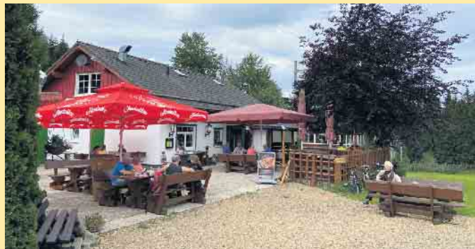
Die Schlossberg Alm bei Medebach-Küstelberg