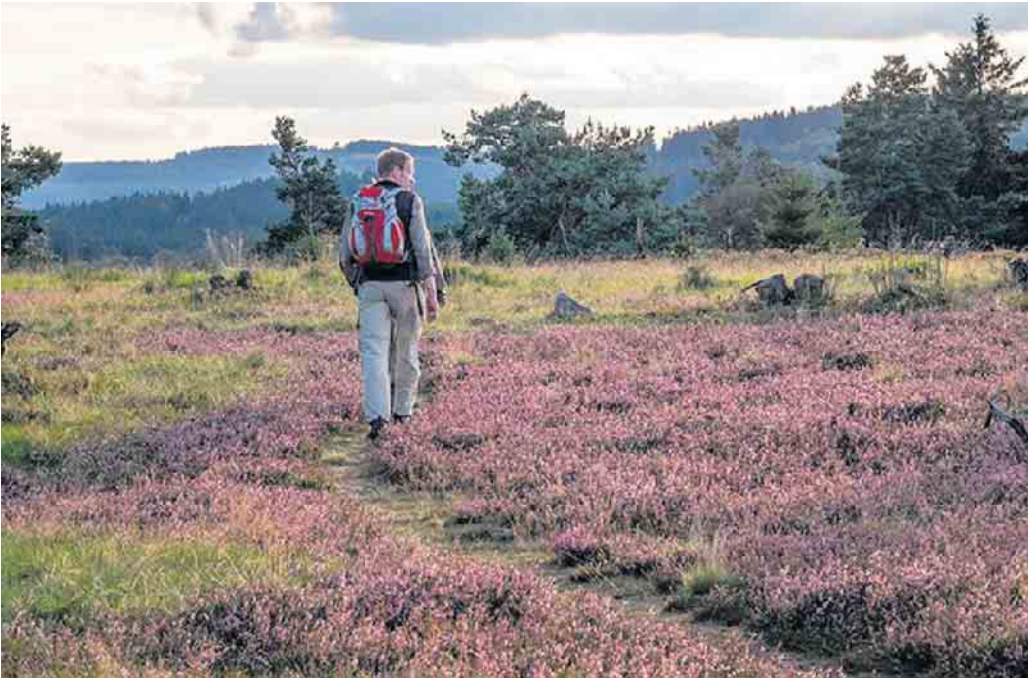
Die Niedersfelder Hochheide fasziniert mit ihrer besonderen Schönheit.

Am 14. August findet der 5. Hochheidetag auf der Niedersfelder Hochheide mit einem bunten Rahmenprogramm statt / Sternwanderungen zum Start