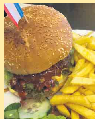
Die schmackhaften Hamburger von der Schlossberg-Alm

Spannendes Abenteuerspiel für Familien, Freunde, Kollegen. Action mitten im Wald. Los geht es ab 4 Personen und 12 Jahren, Terminreservierung auf unserer Webseite outdoorescape-winterberg.de . Beim Outdoorescape werdet Ihr in das Jahr 1858 bei einem „Raubüberfall am Schlossberg“ entführt.“ Als Handelsleute unterwegs auf der Heidenstraße werdet Ihr von Räubern überfallen. „Escape“ bedeutet Flucht - genau das ist Euer Ziel. Eure Aufgabe ist es, Rätsel zu lösen, Geheimnisse zu lüften und Hinweise zu befolgen, bevor der Henker zuschlägt. Ein Team - eine Mission - 60 Minuten Zeit. Weitere Aktivitäten können Sie