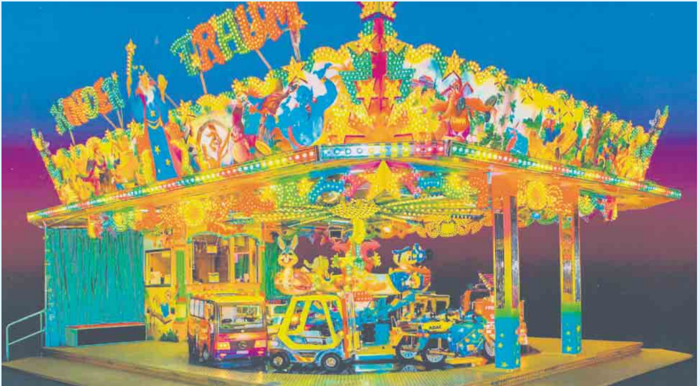
Kinderkarussell Kindertraum - bringt Kinderaugen zum Strahlen

Der „Kindertraum“ ist ein echtes Vergnügen für Kinder. Der kinderfreundliche Aufbau ermöglicht es auch den kleinen Gästen, eine schöne Fahrt zu erleben. Das Karussell bietet dabei verschiedenste Fahrzeuge zur Mitfahrt an - darunter befinden sich zum Beispiel Motorräder, ein Feuerwehrauto und interaktive Flieger.