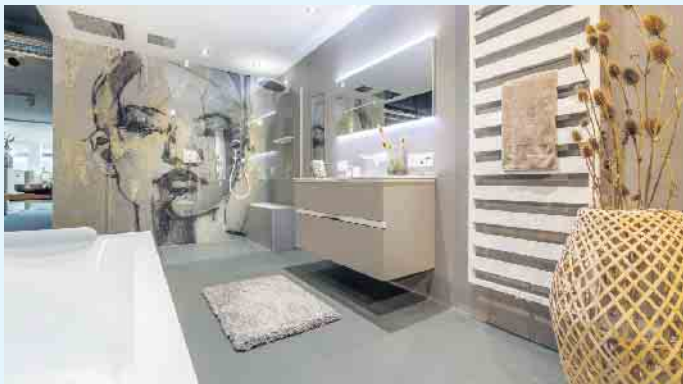
Moderne, fugenlose Badgestaltung von LAMURISTA

LAMURISTA hat diesbezüglich einiges zu bieten. Verleihen Sie Ihrem Bad Exklusivität und Frische. Ihr Malerbetrieb Schnorbus berät Sie gerne zu Ihrer individuellen, fugenlosen Wand- und Bodengestaltung. [BL]