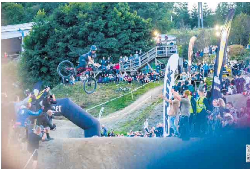
Weit über 30.000 Fans kommen jedes Jahr an die Kappe, um das „iXS Dirt Masters“ zu feiern.