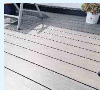
Von Tischlerei Holztec verlegter Terrassenboden