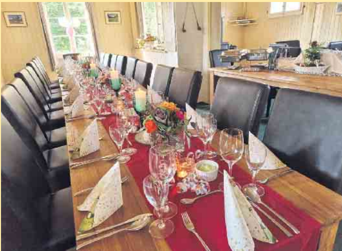
Gedeckter Tisch im LANDHAUS im Clubhaus