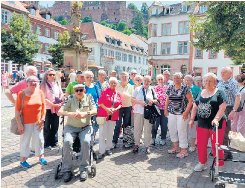
Heidelberg mit Schlossruine oben am Berg

Städte Miltenberg und Heidelberg boten beeindruckende Aussichtspunkte zum Verweilen. Zünftiges Essen mit erfrischendes Klosterbier im Franziskanerkloster Engelberg und eine Schifffahrt auf dem Neckar rundeten das Programm ab. Es war schön.