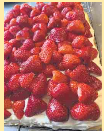
Hausgemachte Kuchenspezialitäten vom Schlossberg

Wanderstrecke 9,8 km -Dauer ca. 3 Std. - mittel