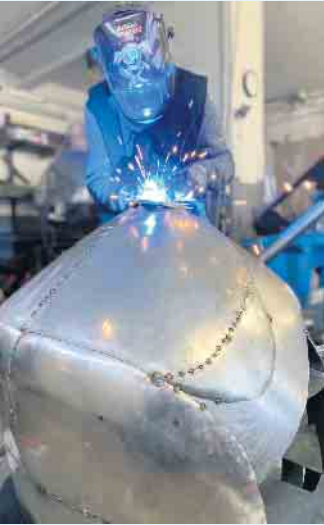
Schweißarbeiten am Kopf der Wildbiene

Überdimensionale Biene für Ausstellung in Frankfurt von Michael Tuss