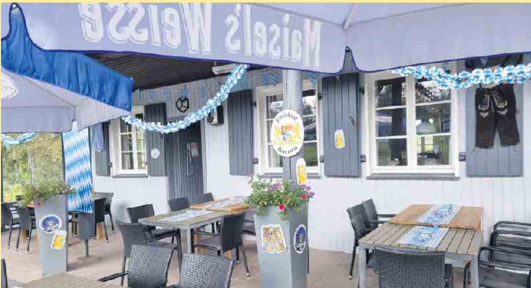
Geschmückte Terrasse im LANDHAUS auf der grünen Wiese

Die gemütliche Gastronomie „LANDHAUS auf der grünen Wiese“, im Clubhaus des Golf-