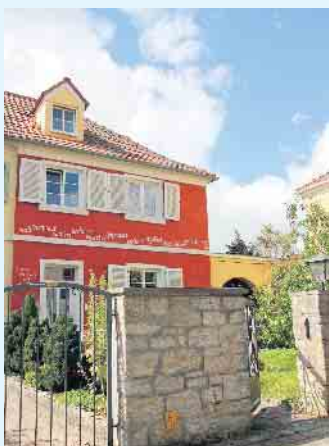
Farbenfrohe Gestaltung einer Fassade

neu ins Spiel und eröffnen neue optische Möglichkeiten. Lassen Sie sich vom Malerbetrieb Schnorbus auch für außergewöhnliche Looks inspirieren und beraten. [BL]