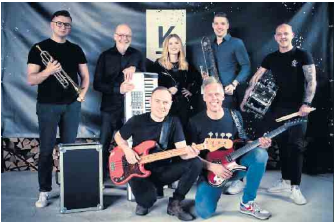
Zum Finale des „Sparkassen Open Air“-Festivals spielt „kraftstoff“ am 14. August groß auf.