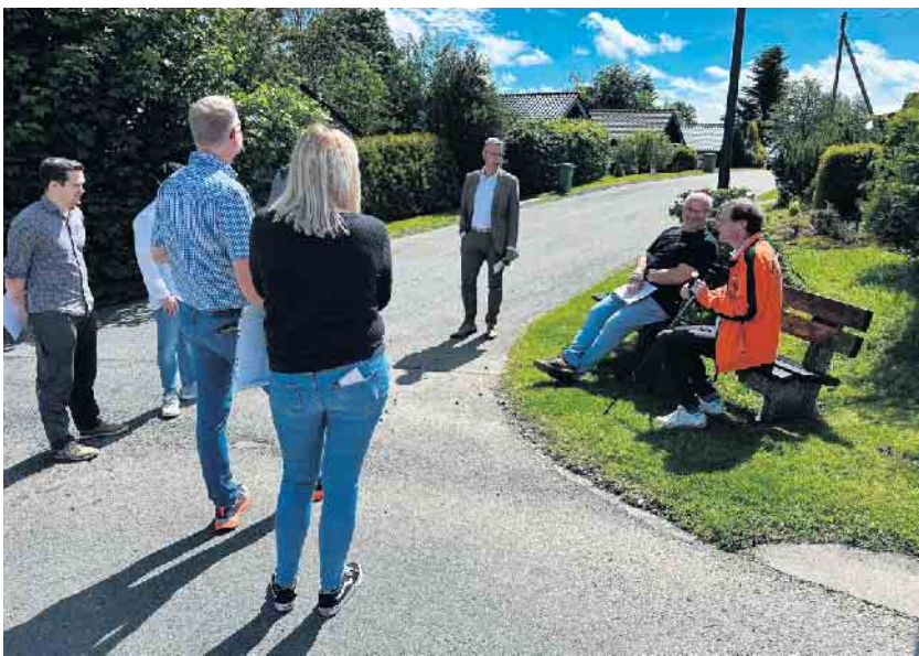
Eine Jury hat die vier teilnehmenden Ortsteile bereist.

Die Stadt Winterberg darf aufgrund der Regeln nur einen Teilnehmer für den Wettbewerb auf Kreisebene nennen. Nach intensiver Beratung und Beurteilung aller Bewertungsbereiche der Jury wie z.B. Baugestaltung und Entwicklung oder Grüngestaltung und Dorf in der Landschaft ist die Entscheidung für Züschchen gefallen. „Der Ort Züschchen steht für Geschichten, Tradition, Kultur und Brauchtum und besticht mit seinen schmucken Fachwerk- und Schieferhäusern. Züschchen hat sich zudem in den vergangenen zwei Jahren, seit dem letzten Wettbewerb, mit der Ausweisung von neuen Baugrundstücken, dem neuen Pump-Track, neuen Spielgeräten auf den vorhandenen Spielplätzen oder den neuen Themenwanderwegen, wie dem Narzissenrundweg oder dem Muffeltrail, weiterentwickelt. Besonders beeindruckt hat uns die lebendige Dorfgemeinschaft“, so Sven Lucas Deimel, der Vorsitzende des Bau- und Planungsausschusses. Sonderpreise für Langewiese, Silbach und Siedlinghausen Aber auch die drei anderen Orte