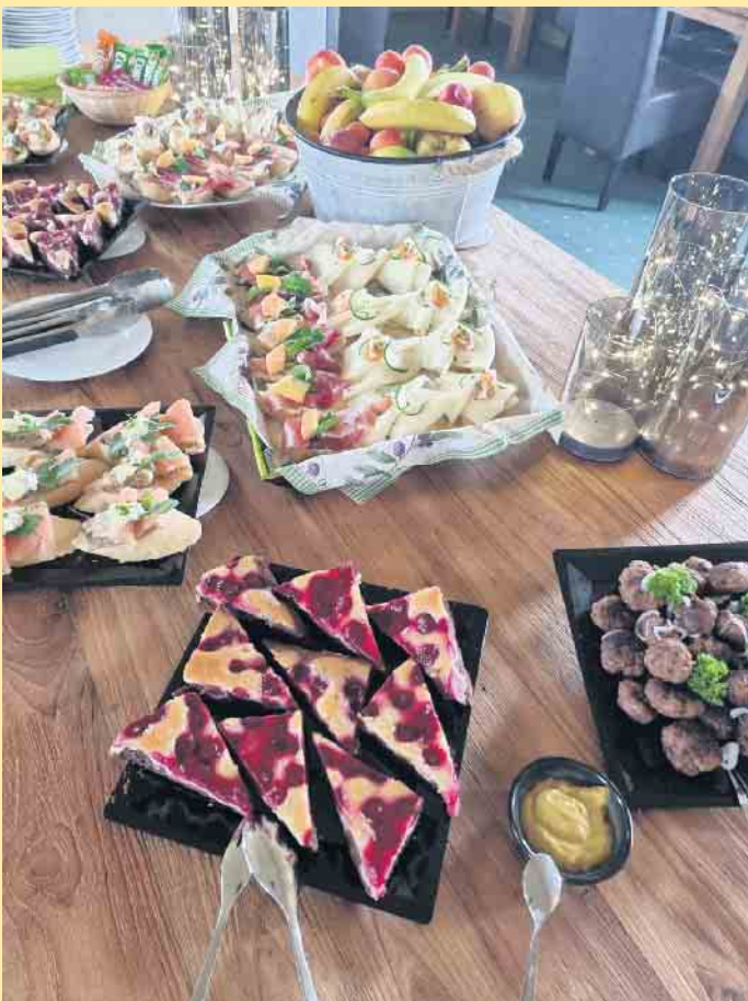
Reich gedeckter Tisch im LANDHAUS im Clubhaus