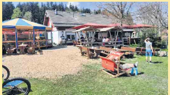
Die Schlossberg-Alm mit Schirmbar am Fuße des Schlossbergs

Apfel-, Käse- oder Schmandkuchen mit Erdbeeren oder Kirschen. Und der geht weg, wie nix. Leckere Eisbecher mit Eierlikör oder Nuss- und Schokobecher warten auf Ihre Abnehmer. Noch mehr Süßes - Wie wäre es mit Waffeln, Apfelstrudel