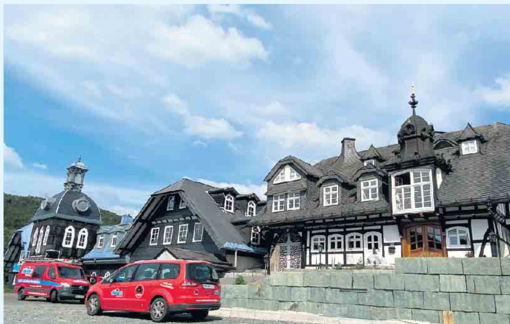
Der Meisterbetrieb Menke in Winterberg-Siedlinghausen

besitzer wären berechtigt, attraktive staatliche Wärmepumpen-Förderung auch für Neubauten in Anspruch zu nehmen.- Aber ganz unabhängig davon, ob die Wärmepumpe in einem Neubau oder einem Altbau zum Einsatz kommt-