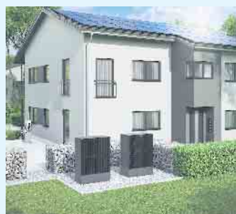
Modernes Mehrfamilienhaus mit PV-Anlage, Wärmepumpe und Wallbox

für die Gewährleistung eines dauerhaft sicheren und wirtschaftlichen Betriebes oder Haushaltes muss das Heizsystem möglichst exakt zum Heizbedarf passen. Das Team vom Meisterbetrieb Menke berät Sie gern. [BL]