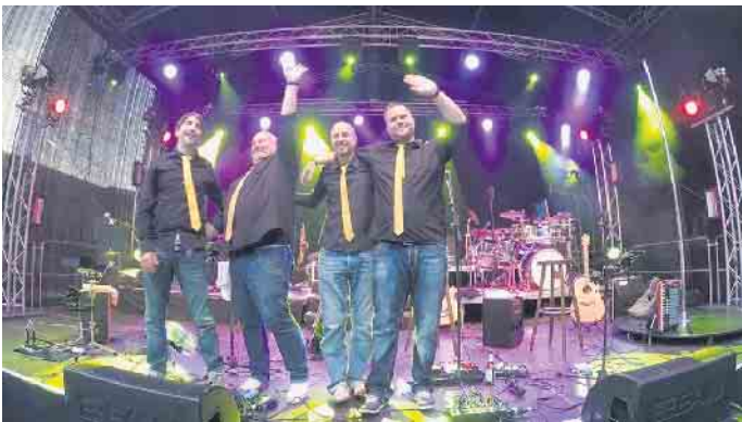
»Die Goldenen Reiter« bringen zum Festival-Auftakt die Neue Deutsche Welle ins Sauerland.

Zum großen Finale spielt am 14. August die Band „kraftstoff“ auf. Und zwar frech, kraftvoll und alles andere als brav. Das Programm ist aktuell und die Klamotten mitunter auch schrill - was aber feststeht: Die Party wird fett! Von der klassischen Tanzmusik über zeitlose Rock- und Popsongs bis hin zu den aktuellen Top 40-Songs - „kraftstoff“ macht vor keinen großen Namen halt! Die Vollblutmusiker legen sich ordentlich ins Zeug. Geniale Soli, virtuose Beherrschung der Instrumente, erstaunliches Klangvolumen und druckvoller Sound bringen den Aktiv- und Vitalpark garantiert