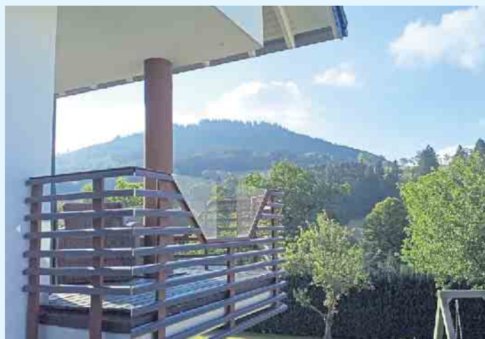
Moderne Balkongestaltung von Tischlerei Holztec

ten und dem Balkon die Möglichkeit, die Privatsphäre auf attraktive Art zu schützen. Die Elemente können auf Wunsch als geschlossenes Element, teildurchsichtig mit „Rankschutzgitter“ oder auch in der Kombination mit satiniertem Glas, individuell auf Maß gefertigt werden und dienen natürlich auch als Windschutz. Ein großer Vorteil ist die auf Jahre bestehende Witterungsbeständigkeit bei einem Minimum an Pflege. Alle Kunststoff-Elemente bestehen aus hochwertigstem PVC-Material in verschiedensten Farben und Dekoren. Made im Sauerland.