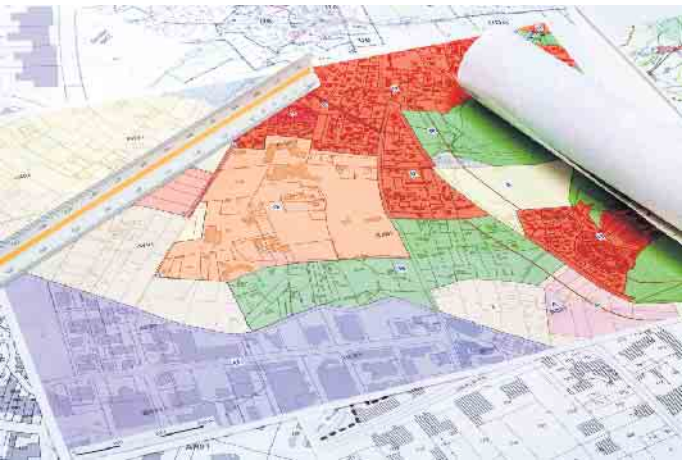
Die kommunale Wärmeplanung soll künftig die Grundlage für die Planung und Steuerung der Wärmewende auf kommunaler Ebene bilden.

Klimafreundliches Heizen ist in Zukunft einer der Eckpfeiler, um die Auswirkungen des Klimawandels zu begrenzen. Hierfür muss die Anzahl der Gebäude, die mit regenerativen Energien beheizt werden, in den nächsten Jahren kontinuierlich weiter steigen. Eine Grundlage hierfür ist die sogenannte kommunale Wärmeplanung. „Die kommunale Wärmeplanung soll künftig die Grundlage für die Planung und Steuerung der Wärmewende auf kommunaler Ebene bilden. Ziel ist es, einen konkreten Plan zu entwickeln, um die Herausforderungen einer flächendeckenden klimaneutralen