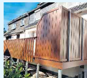
Sichtschutzgestaltung von Tischlerei Holztec