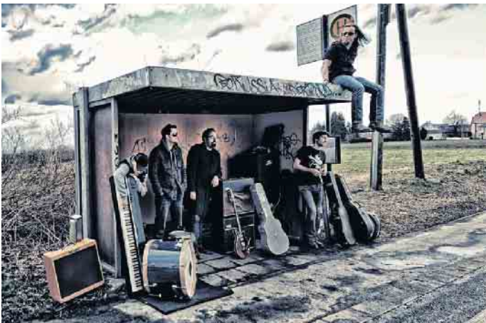
Der Name ist Programm: Am 7. August wird es rockig im Aktiv- und Vitalpark Winterberg mit der Band »RockaholiX«.