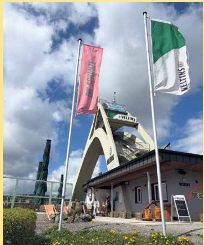
Terrasse für Sonnenanbeter am Schneewittchen-Haus

kontakt@die-schanze.de Schneewittchen-Haus Am Waltenberg 119 59955 Winterberg Tel.: +49 (0) 2981 425 9020 kontakt@schneewittchenhaus.de