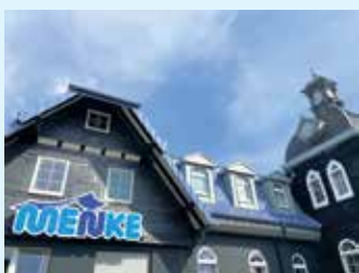
Der Meisterbetrieb Menke in Winterberg-Siedlinghausen

Für Kostenersparnis beim Heizungstausch mit einer der neuen Wärmepumpen sorgt auch deren patentierte Hydraulik Hydro Auto-Control. Sie passt sich an nahezu alle vorhandenen Heizungssysteme bei der Modernisierung an und reduziert gegenüber herkömmlichen Wärmepumpen die Installationszeit erheblich. Außerdem ist durch die Hydraulik der Platzbedarf der Anlage um fast zwei Drittel geringer.