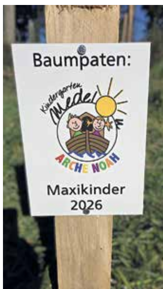
Hinweisschild der Baumpaten in der Medeloner „NaturWerkStatt“