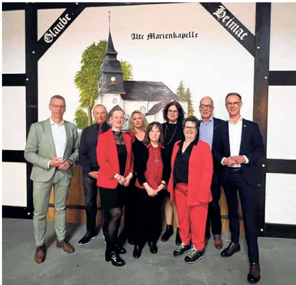
(c) Chor 1946 Hildfeld „Haste Töne“