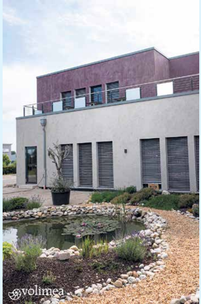
Wandbeschichtung Fassade Firmengebäude mit Fassadenfarbe von Volimea

Lassen Sie sich vom Malerbetrieb Schnorbus auch für außergewöhnliche Looks inspirieren und beraten. [BL]