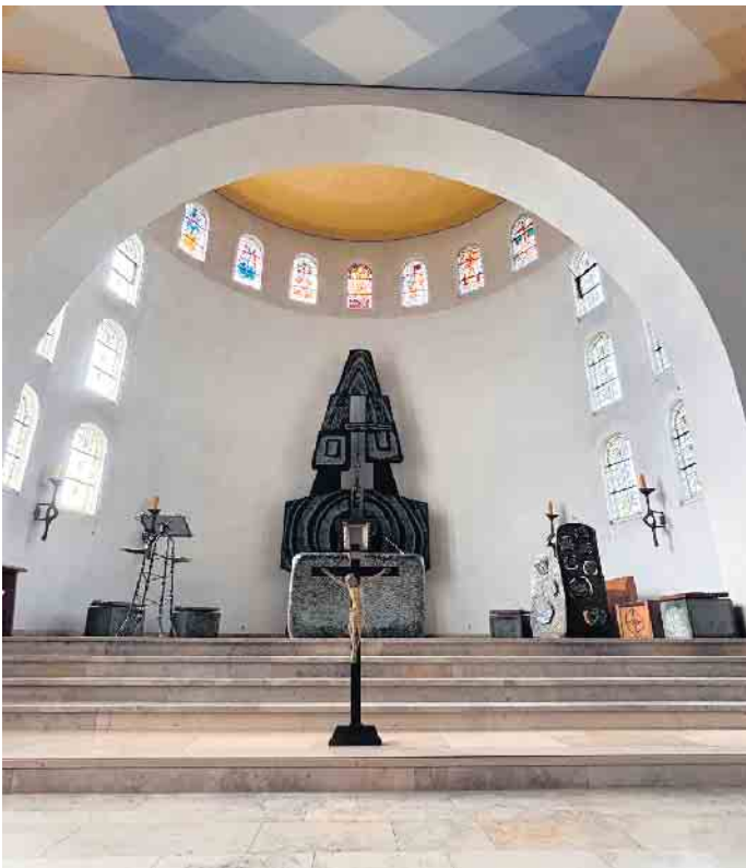
Die Leere am Karfreitag in der Niedersfelder Pfarrkirche

Fotos sind unter www.niedersfeld.info zu sehen.