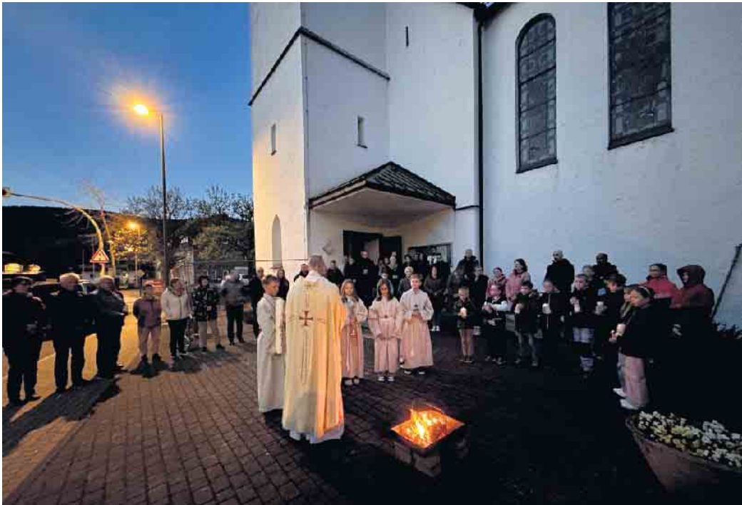
Vor der Kirche beginnt die Feier der Osternacht.

Am Vorabend des Ostersonntag versammelte sich die Festgemein-