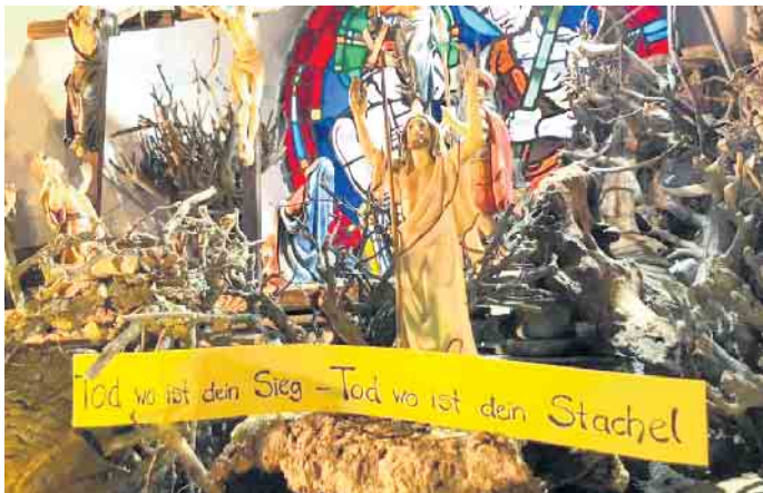
Die Dorfkrappe zeigt unter anderem den Leidensweg.