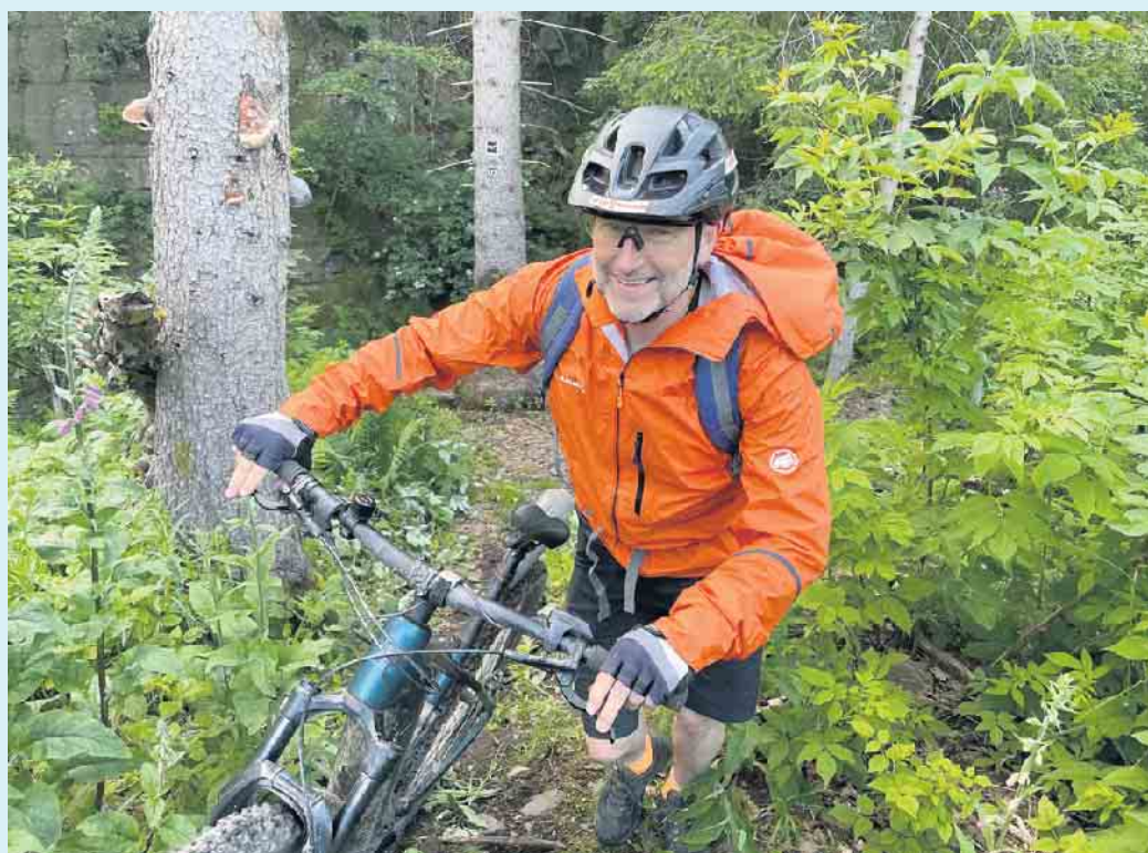
Spaß auf schönen Pfaden mit exklusiven Touren von Uppu

leih und Werkstatt läuft alles zusammen- von der Tourenplanung über Ausrüstungscheck, der MTB-Tour selbst über das ordentliche Menü nach der Tour.- Rundum der perfekte Platz für alles was zwei Räder hat. [BL]