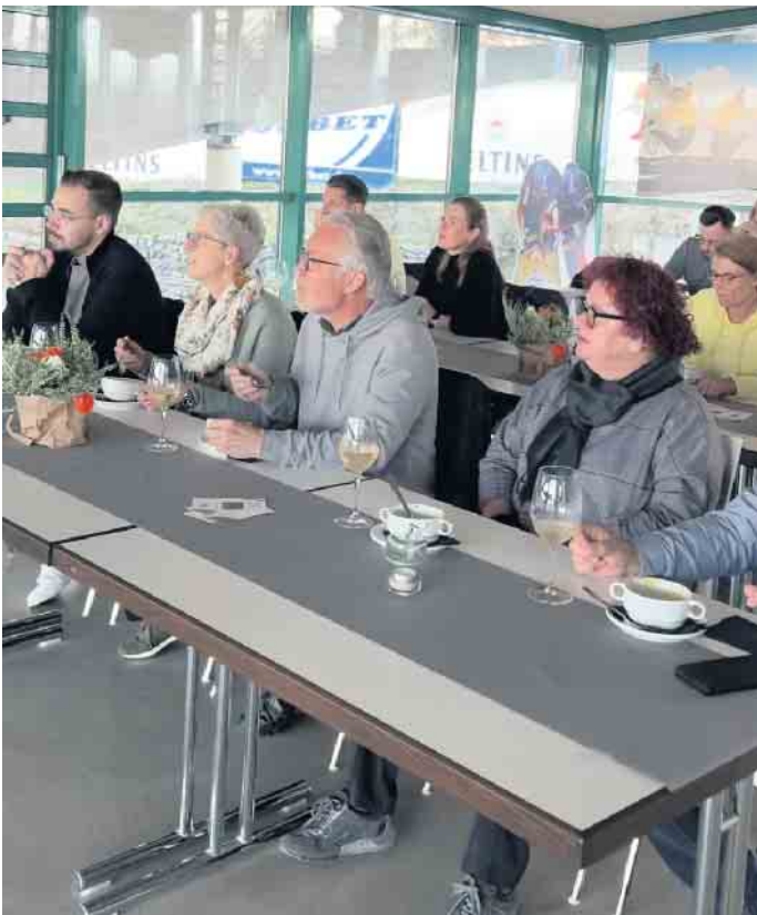
Der erste Gang serviert im Starthaus

Touren und Anmeldung: Die Gourmet-Tour findet am 11. Mai in zwei verschiedenen Touren statt. Die erste Tour beginnt um 17:00 Uhr, die zweite Tour um 17:45 Uhr. Eine Anmeldung ist erforderlich und die Tickets können bequem über die Website der Winterberger Touristiker gebucht werden. Weitere Informationen