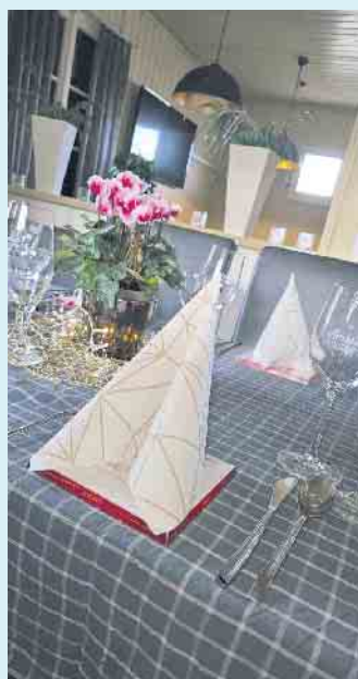
Feierlich gedeckter Tisch im LANDHAUS auf der grünen Wiese

GOLFCLUB WINTERBERG – Landhaus auf der grünen Wiese