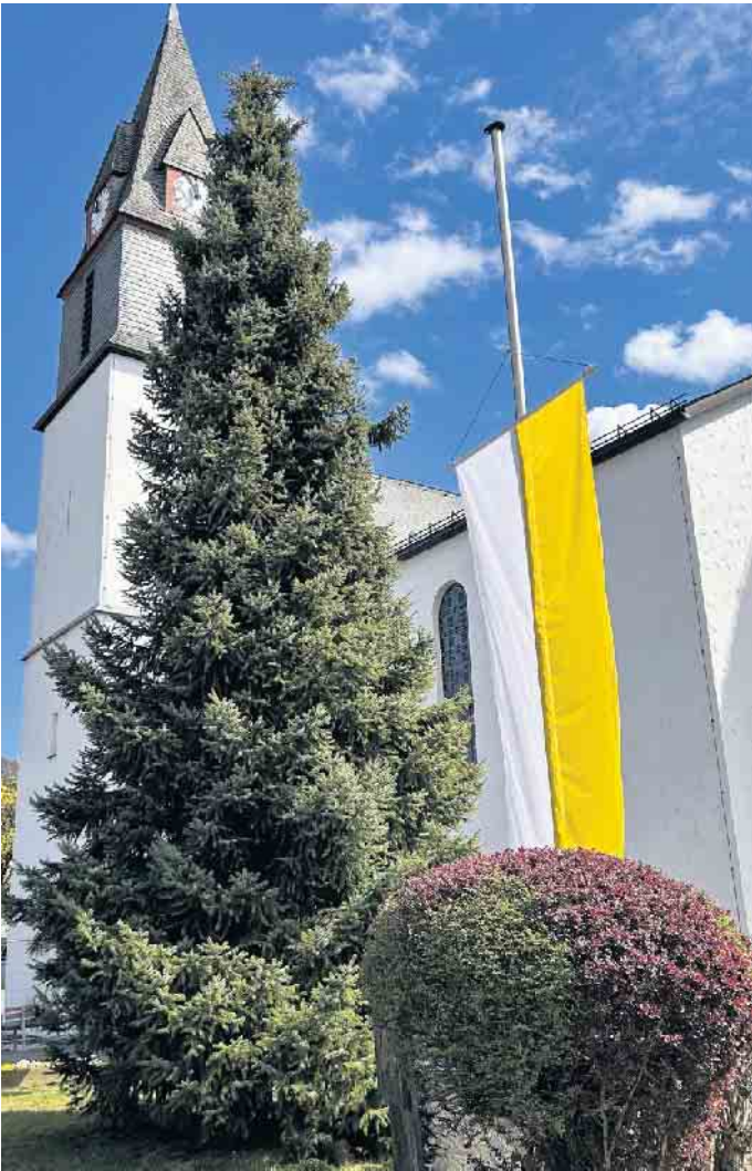
Die Fahne auf Halbmast an der Niedersfelder Kirche

Zum Tode von Papst Franziskus gab es am Ostermontag auch im Pastoralverbund Winterberg viele Reaktionen. Schon in den Festgottesdiensten wurde für den verstorbenen Pontifex gebetet. So wie hier in Niedersfeld weht die