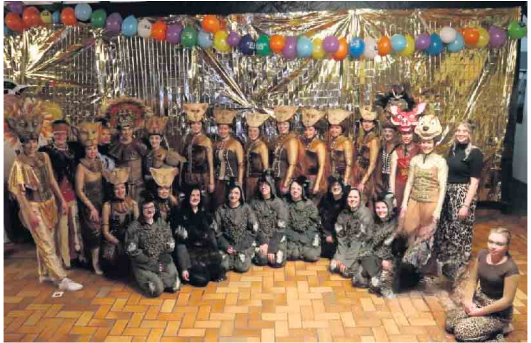
Show-Tanz-Gruppe „König der Löwen“ des TUS Züschen

Im August letzten Jahres hat sich für diese Eröffnungsveranstaltung auch die Kolpingsfamilie Züschen mit der Großen Garde und der Show-Tanz-Gruppe des TUS Züschen beworben. Aus den bundes-