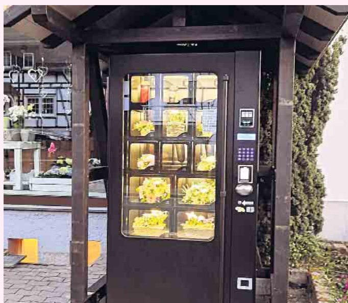
Der Blumenautomat bei Blumen Klauke in Züschen

Auch wenn die Kinder längst aus dem Haus sind, können sie ihren Mamas am Muttertag trotzdem eine große Freude machen. Nun gilt es, sich selbst Zeit für die Mutter zu nehmen. Hinfahren, überraschen und bspw. zu einem tollen Ausflug einladen. Auch hier sollten die Vorlieben der Mama auf jeden Fall ins Kalkül gezogen werden. Also nichts planen, was der eigenen Mutter eigentlich gar nicht liegt. Nach einem gelungenen Abstecher ins Theater, Kino oder Museum kann auch hier eine Einladung zum Essen die Überraschung abrunden. Gemeinsam in dem Restaurant der Wahl mit dem Lieblingsmenschen Zeit verbringen und genießen. An solche Momente werden sich Mütter wie Kinder immer wieder gerne zurückerinnern. (ak-o)