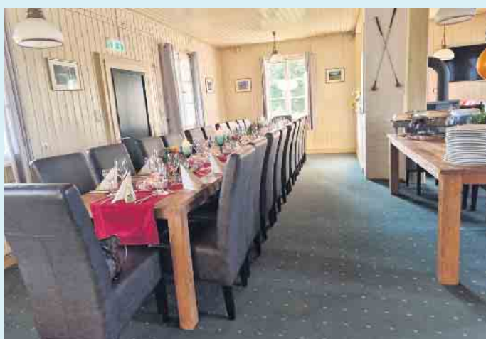
Gemütliche Räumlichkeiten mit 50 Sitzplätzen

Ausreichende Parkmöglichkeiten sind vor dem Haus vorhanden. Bei Gruppen und Abendessen ist eine Reservierung erforderlich. Montag ist Ruhetag, ansonsten ist von Dienstag bis Sonntag immer ab 12.00 Uhr geöffnet. In den Abendstunden abhängig von den Reservierungen. [BL]