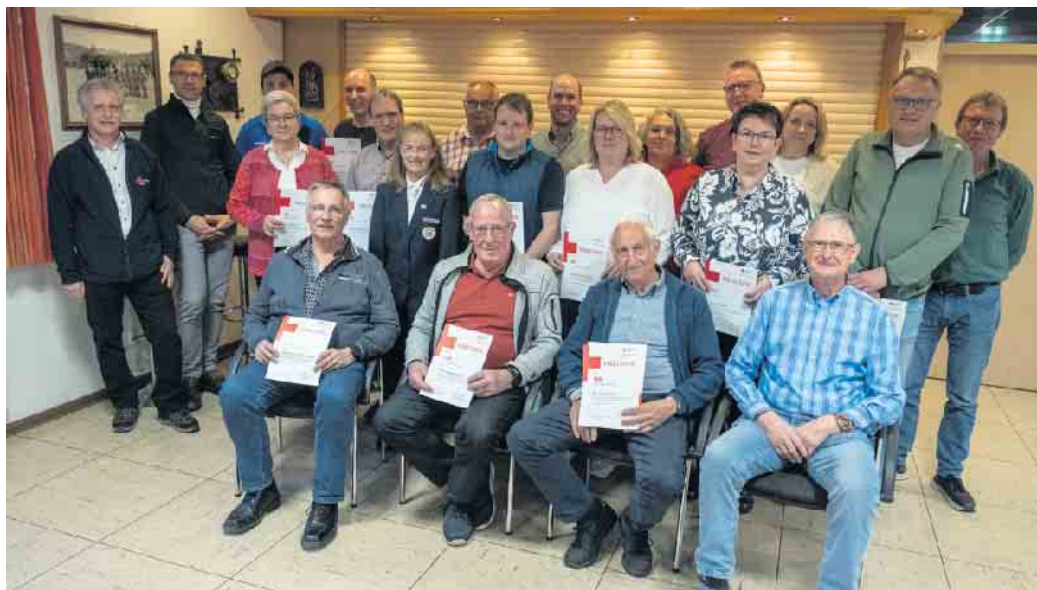
Die Blutspenderinnen und Blutspender, die am 4. April für ihre Blutspenden geehrt wurden.

In ihrer kurzen Rede bedankte sich Astrid Just-Herzig bei allen Blutspendenden für ihren Einsatz und würdigte diesen mit der Aussage, dass jede und jeder Anwesende mit der Blut-