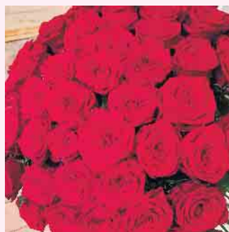
Ein Klassiker: Rote Rosen zum Muttertag

www.cafe-engemann.de Am Waltenberg 14 59955 Winterberg T 02981 7374