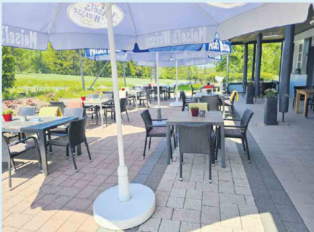
Die überdachte Außenterrasse mit 70 Sitzplätzen

Hier können Feierlichkeiten aller Art ausgerichtet werden. Der