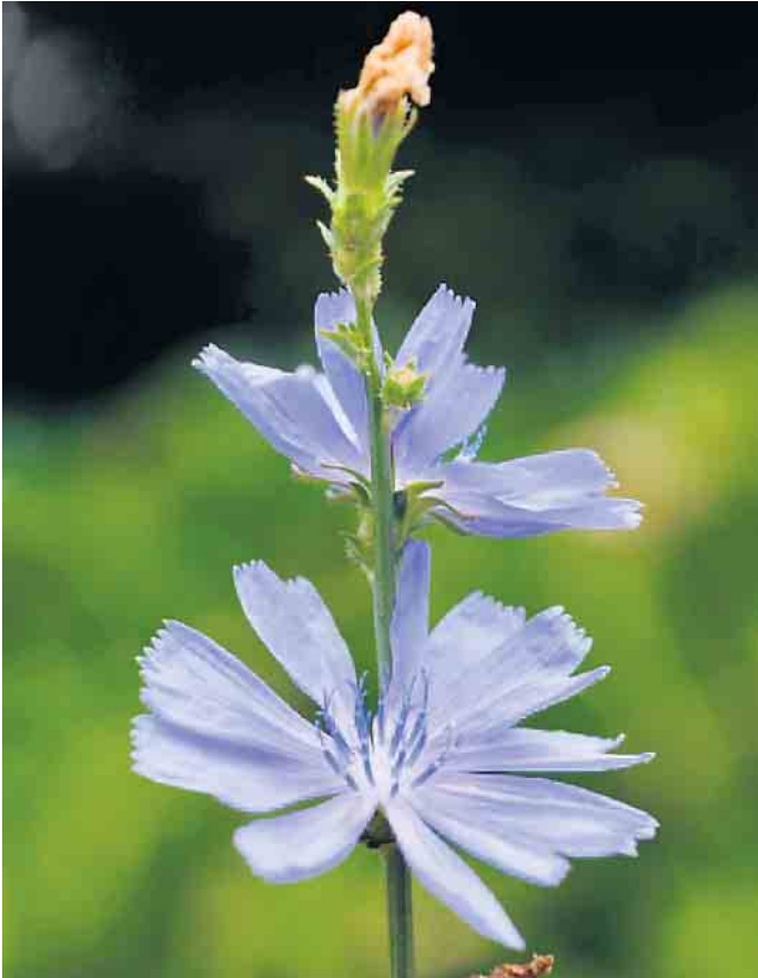
Leserfoto von Joachim Padberg aus Grönebach