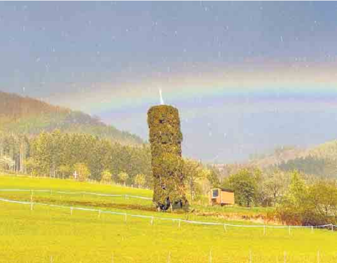
Gewitterschauern am Nachmittag über dem Osterfeuer.

Feuer & Feuerwehreinsätze - Regen & Regenbogen