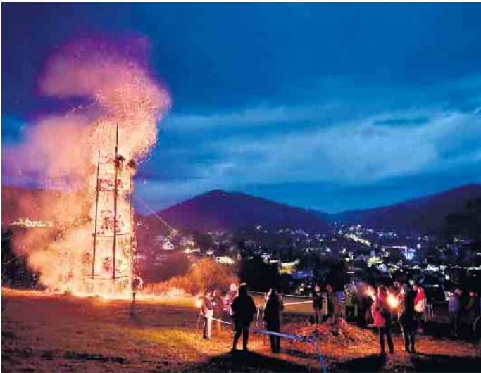
Das Niedersfelder Osterfeuer brannte hervorragend.

Um 20 Uhr wurde im Feuerwehrhaus eine Osterandacht gefeiert. Diakon Rudolf Kretzer hatte besonders die Feuerwehrleute im Blick und so ging es in den Gebeten und Fürbitten auch um den