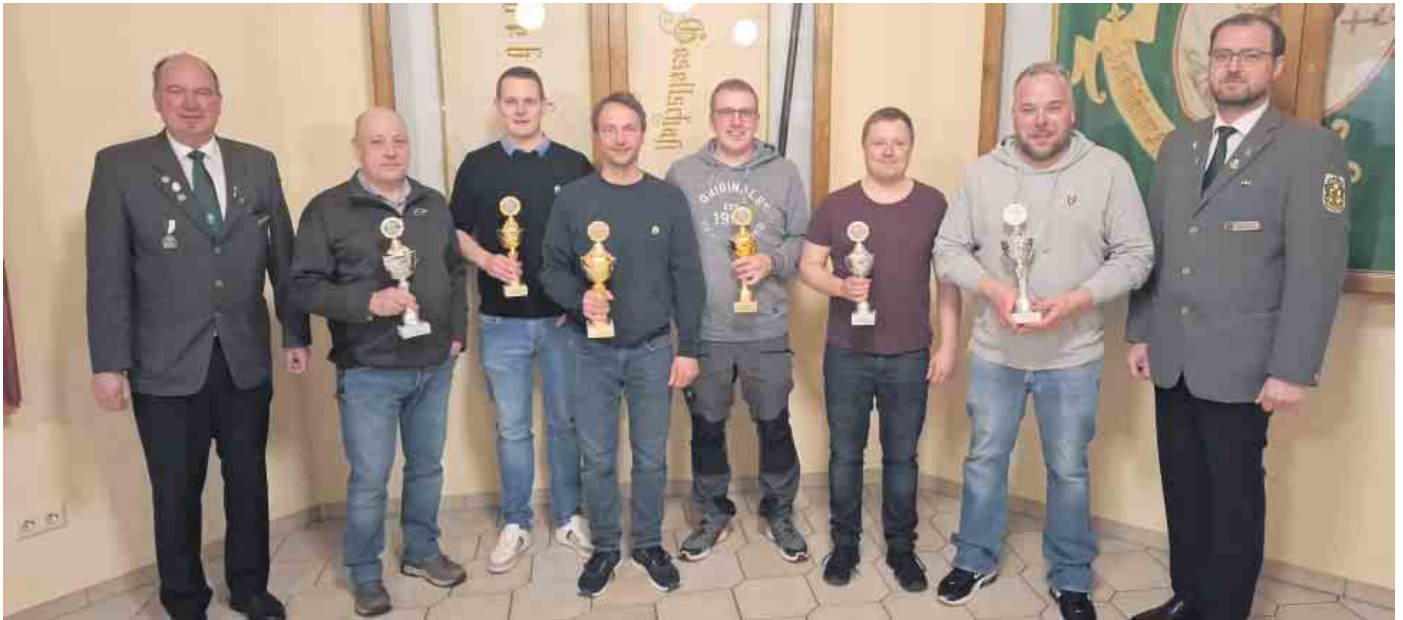
Siegerehrung Vereinsmeisterschaft 2026.

Schützenbruderschaft Medebach ermittelt neuen Vereinsmeister