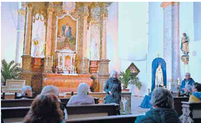
Barockkapelle auf Gut Holthausen in Büren mit der Fátima-Madonna