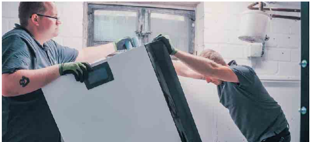
Montage des Pelletkessels.

Bundesweit machen sich derzeit viele Städte und Gemeinden dazu Gedanken, wie die zukünftige Wärmeversorgung vor Ort klimafreundlich gestaltet werden kann. Ziel der kommunalen Wärmeplanung ist es, fossile Energieträger schrittweise zu ersetzen und abzuschätzen, wo dazu Fernwärme- und/oder Wasserstoffnetze entstehen sollten. Dieser Prozess kann sehr langwierig sein: Bis konkrete Projekte umgesetzt sind, können Jahre bis Jahrzehnte vergehen. Viele Eigentümerinnen und Eigentümer stellen sich die Frage, ob sie mit dem Heizungstausch lieber warten sollen. Aus Expertensicht ist das nicht nötig - im Gegenteil. Denn auch wenn ein Wärmenetz geplant ist, besteht keine Verpflichtung, mit dem Heizungstausch zu warten. Und: Wer sein Haus bereits mit einer klimafreundlichen Heizungsanlage ausgestattet hat, erfüllt die gesetzlichen Anforderungen und profitiert von Planungssicherheit. Das gilt u.a. für moderne Pelletheizungen: Sie sind gesetzlich als klimafreundlich anerkannt, werden gefördert und lassen sich