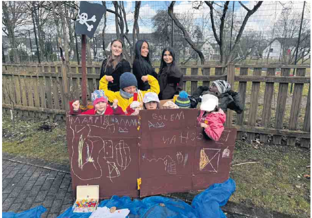
Die Studierenden des Berufskollegs Olsberg und die Kita-Kinder aus Winterberg freuen sich über das gelungene Projekt.

Auch für die Studierenden war das Projekt wertvoll: Sie erfuhren haut-