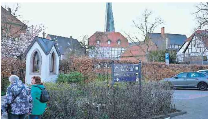
Stadtzentrum in Delbrück mit der Kirche St. Johannes baptisch im Zentrum