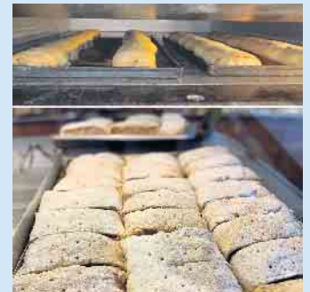
Die Vollendung des leckeren Apfelstrudel von Christian Lütke

Dieser Blätterteig wird in 400 Schichten angelegt und anschließend dünn ausgerollt. Die Füllung stellt Christian aus einer Mischung aus kleingeschnittenen Äpfeln, Rosinen, gerösteten Nüssen und Zimt her