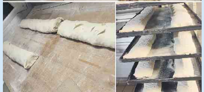
Der leckere Apfelstrudel in der Herstellungsphase beim Café Engemann