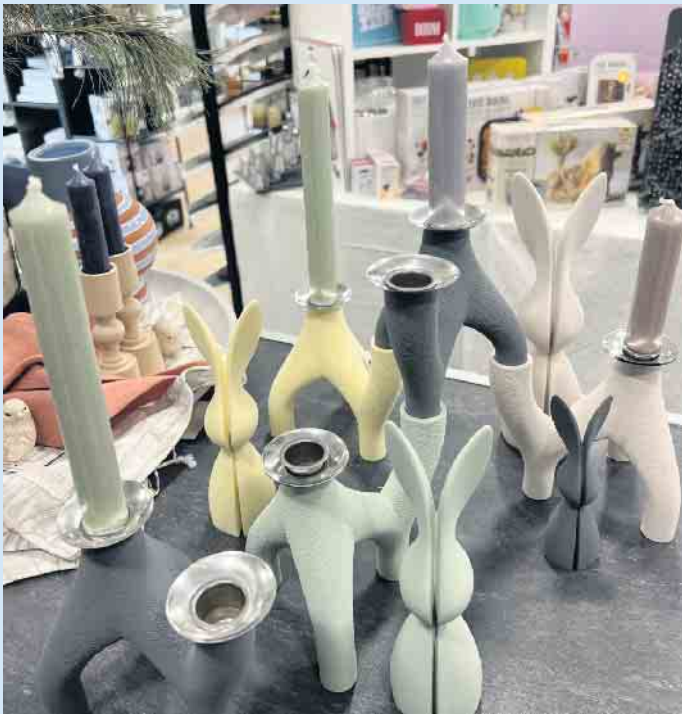
Kerzenständer und Osterhasen von nevalu aus recycelten Materialien bei „Tischlein deck dich“

Als nachhaltiges Start-Up-Unternehmen aus dem schönen Müns-terland entwickelt nevalu stilvolle Designobjekte für eine angenehme Wohnatmosphäre aus recyclingfähigen Materialien.