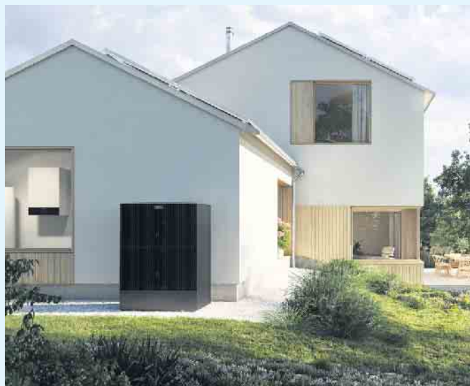
Moderner Hausbau mit PV-Anlage, Wärmepumpe und Wallbox

mit erlangt man mehr Unabhängigkeit von Energieversorgern und erreicht geringere Stromkosten. Eine Ausrichtung auf Ost- oder Westdächern passt am besten zum typischen Verbrauchsverhalten eines Privathaushalts, da die Module in den Morgen und Abend-