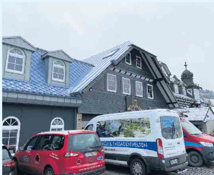
Der Meisterbetrieb Menke in Winterberg-Siedlinghausen

Komplettlösungen vom Meisterbetrieb Menke aus Winterberg-Siedlinghausen