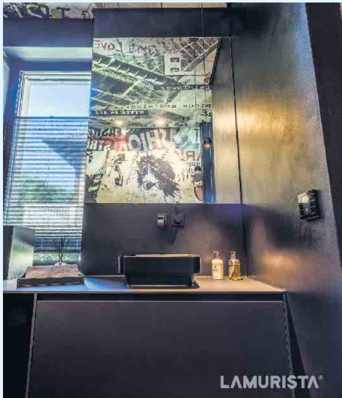
Grenzenlos abstrakt in der Dusche