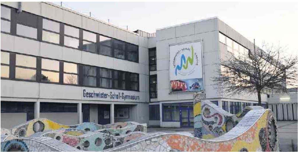
Bis zu 100 Schülerinnen und Schüler mehr müssen aufgrund der Rückkehr zu einem Gymnasium mit 9 Jahrgängen ab dem Schuljahr 2026/2027 am Geschwister-Scholl-Gymnasium beschult werden.

Auch beim Schulstandort der Sekundarschule in Winterberg war und ist die Nachfrage von Eltern und Schülern so groß, dass die räumlichen Kapazitäten nicht mehr ausreichen. Die Arbeitsgruppe Schulentwicklung der Stadt Winterberg, in der auch politische Vertreter