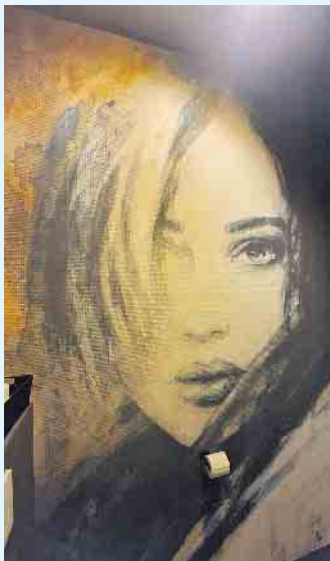
Schönes Motiv für die Dusche

Der Malerbetrieb Schnorbus aus Züschen verleiht dank der fugenlosen Oberflächen mit Fotodruck Ihren alten Bädern neuen Glanz im Duschbereich. Nicht nur eine Augenweide, sondern auch unglaublich vielseitig und strapazierfähig sind diese Wandbeschichtungen. Die hochwertigen Oberflächen mit beliebig wählbaren Motiven sorgen für eine individuelle Atmosphäre im Duschbereich des Badezimmers. Überzeugend durch ihre Beständigkeit gegen Schmutz, Ablagerungen wie Kalk sowie Schimmel und sind diese Oberflächen waserbeständig. Auf jeden Quadratmeter kann in der Nasszelle auf Wunsch ein beliebiges,