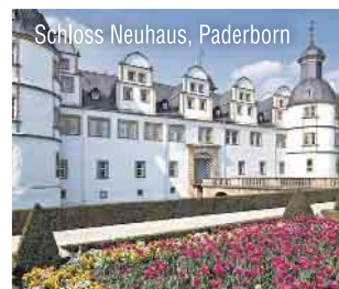
Schloss Neuhaus, Paderborn

Einzelzimmerzuschlag: 30–50 €/Nacht (saisonal)