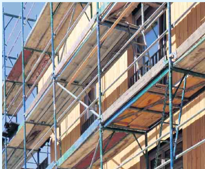
Holzfassaden in moderner Technik erfüllen alle heutigen Anforderungen an die Wärmedämmung und das Energiesparen.

gehängt werden. Eine individuelle Beratung zu den Möglichkeiten des Bauens mit Holz gibt es im örtlichen Holzfachhandel. Unter www.holzvomfach.de lassen sich Ansprechpartner aus der Nähe finden. Wer neu baut oder modernisiert, sollte möglichst auf Holzprodukte aus nachhaltiger Forstwirtschaft Wert legen. Lokale Produkte können zudem kurze Transportwege ermöglichen und die Klimabilanz so weiter verbessern. (djd)