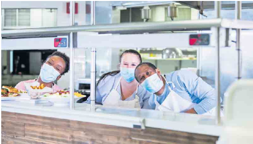
In der Systemgastronomie in Deutschland arbeiten Menschen aus rund 120 Nationen.

Die Systemgastronomie setzt in der Ausbildung auf interkulturelle Kompetenz