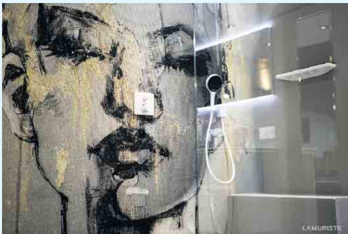
Tolle Wandgestaltung für den Nassraum

alte Fliesenbeläge überarbeitet werden können. Staub und Schmutz durch das Entfernen der alten Fliesen entfällt durch eine solche Maßnahme komplett. Ihr Malerbetrieb Schnorbus berät Sie gerne zu Ihrer individuellen, motivreichen und gleichzeitig fugenlosen Wandgestaltung in Ihrem Bad. [BL]