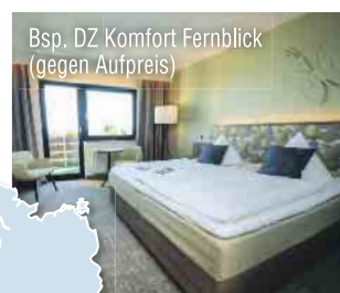
Bsp. DZ Komfort Fernblick (gegen Aufpreis)