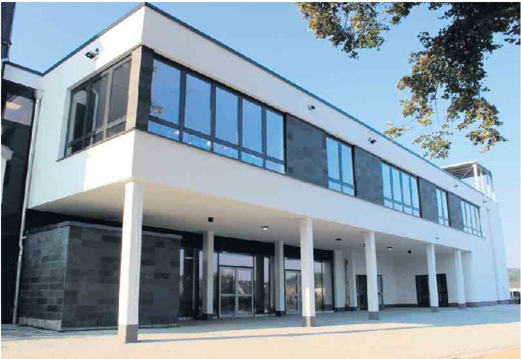
Riegelbau am Sekundarschulgebäude in Winterberg wird aufgestockt