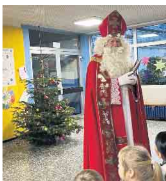
Der Heilige Nikolaus mit seinem Buch

Am Mittwoch, 6. Dezember, stattete der Nikolaus den Kindern der Grundschule einen Besuch ab, schließlich soll das sein Geburtstag sein. Diese empfingen ihn mit erstaunten Augen und teilweise mit etwas Ehrfurcht. Die Schüler hatten Lieder und Gedichte vorbereitet, um den Nikolaus gütig zu stimmen. Dieser war davon sehr angetan und beschenkte die Kinder mit einem Schokonikolaus aus seinem großen Jutesack.