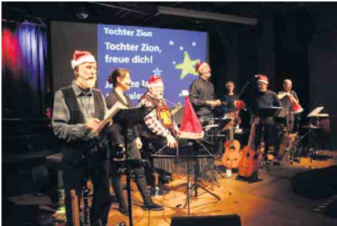
Die Zaiten-Pfeiffer beim letztjährigen weihnachtlichen Mitsingkonzert.

Weihnachtliches Mitsingkonzert mit den Zaiten-Pfeiffern