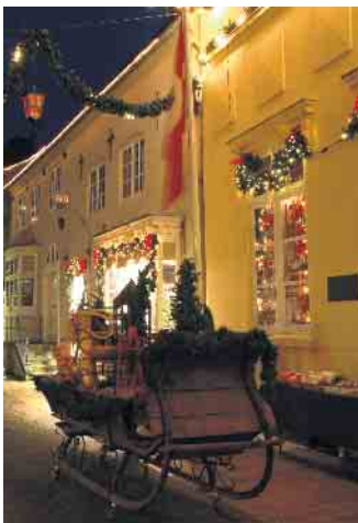
Weihnachtsbeleuchtung verbraucht unnötig Energie, sagen die einen. Lichtermeer sorgt für Freude und Hoffnung, so die Gegenposition.

78 Prozent der Festtagsbeleuchtungen bestehen inzwischen aus sparsamen LED-Leuchten. Damit sinkt der Stromverbrauch auf 614