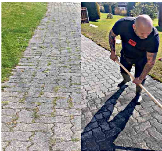
Reinigung von Fugen vorher und nachher.

ten über Immobilien, Möbel, Schmuck oder Uhren angeboten, die bei Zustandekommen eines Auftrags verrechnet werden. Auch bei Todesfällen und Haushaltsauflösung in der Erbengemeinschaft können die Kunden zeitnah den Dienstleister in Anspruch nehmen. Eine kostenlose Preiskalkulation geht jedem Auftrag voraus, um einvernehmlich die Kosten abzusprechen. Die KC Handel und Dienstleistungs GmbH ist zertifiziertes Mitglied im Bundesverband der Entrümpler und Haushaltsauflöser.