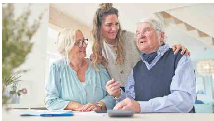
Eine Eigentumswohnung für die Kinder kaufen: Dieses Finanzierungsmodell ist bei Immobilienbesitzern und Banken gleichermaßen beliebt.

Auslastung ist schwer kalkulierbar und bei Eigennutzung gelten steuerliche Sonderregeln. Wer über ein Investment in eine Ferienwohnung nachdenkt, sollte sich einen Überblick über Finanzierungslösungen verschaffen oder sie von einem ungebundenen Vermittler vergleichen lassen. Zum Beispiel unter www.drklein.de gibt es weitere nützliche Tipps rund um die Finanzierung von Zweitimmobilien und eine Kontaktmöglichkeit. (djd)