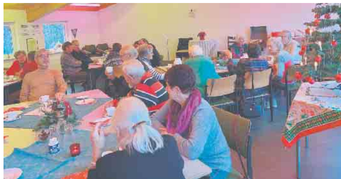
Senioren- und Alternachmittag SV Höhe

Der SVH hat vor vier Jahren eine Tradition wieder aufleben lassen, die früher vom nicht mehr existenten Sparkästchen- und Geselligkeitsverein in Altenherfen gepflegt wurde: die Einladung an alle Senioren von der Windecker Höhe („op de Hüh“) zum Adventskaffee. Aufgrund der Corona-Epidemie konnte der gemütliche Nachmittag in den Räumen des Vereinsheims in den beiden letzten Jahren nicht stattfinden. Am 3. Adventsonntag trafen Damen und Her-