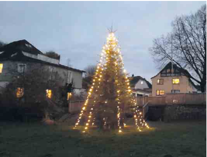
Der Weihnachtsbaum am Dreiseler Dorfbrunnen

Und wenn die vielen großen und kleinen Dreiseler*innen bei kalten und warmen Getränken und leckeren Würstchen so schön singen, dann kommt sicher auch wieder der Nikolaus. Die Dorfgemeinschaft Dreisel lädt ein und freut sich auf einen besinnlich-gemütlichen Abend am Dorfbrunnen.