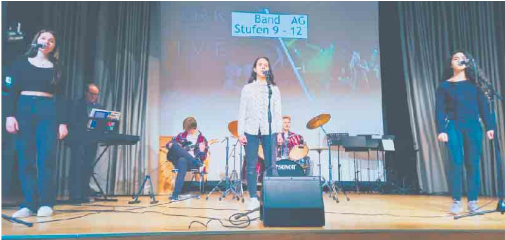
Band der Mittel- und Oberstufe