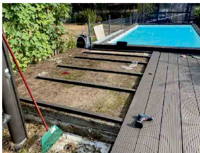
Eine von vielen Dienstleistungen: Gewerbliche und private Montage von Terrassen.