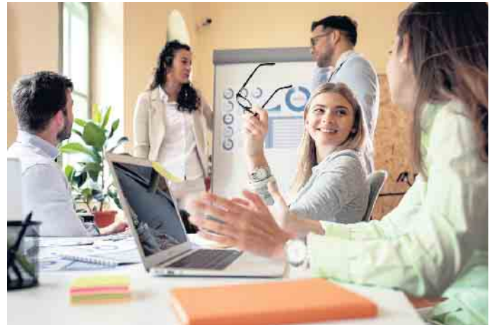
Kommunikative Fähigkeiten sind bei angehenden Bankkauffleuten besonders gefragt.

neue Optionen und Chancen. Die interne Kommunikation und die Zusammenarbeit untereinander etwa ändern sich permanent. Heute sind flexible und mobile Arbeitsmethoden möglich, Berufs- und Privatleben lassen sich so besser in Einklang bringen. Doch wie können junge Menschen ins Bankwesen einsteigen? Die drei wichtigsten Optionen: