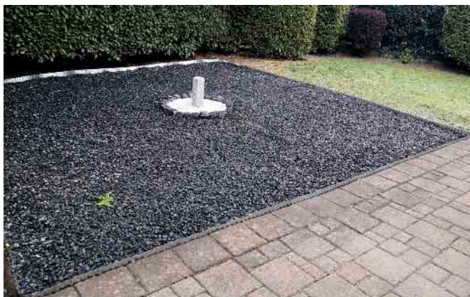
Gartengestaltung aus einer Hand.

Die KC Handel und Dienstleistungs GmbH ist zertifiziertes Mitglied im Bundesverband der Entrümpler und Haushaltsauflöser.