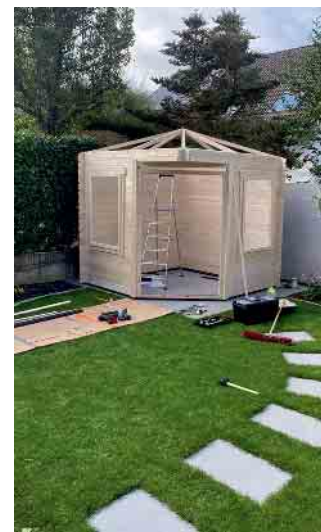
Montage von Garten-Häuser inklusive Beratung und Ausmessung.