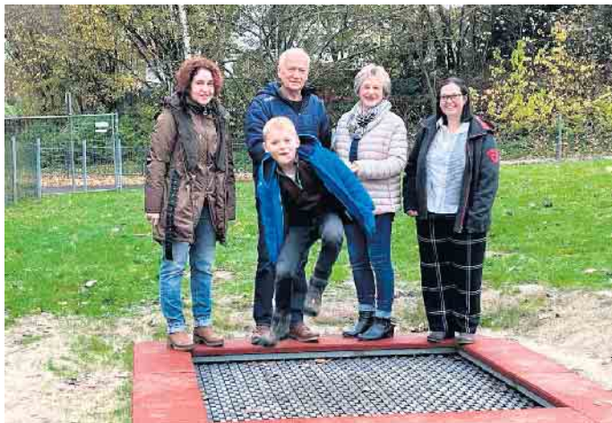
Spendenübergabe an den BVV Obernau