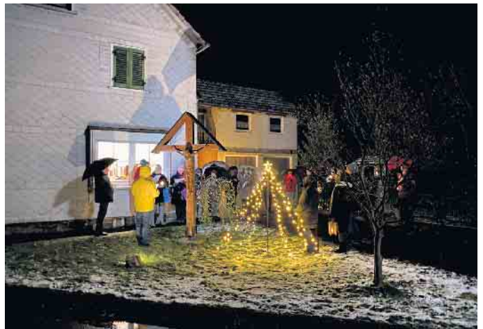
Einen Moment Advent am Wegekreuz in Übersetzig

Aus diesem Grunde möchten wir auch in den kommenden Tagen zu folgenden Stationen jeweils um 19 Uhr für 15-20 min. einladen: Fr., 8. Dezember,