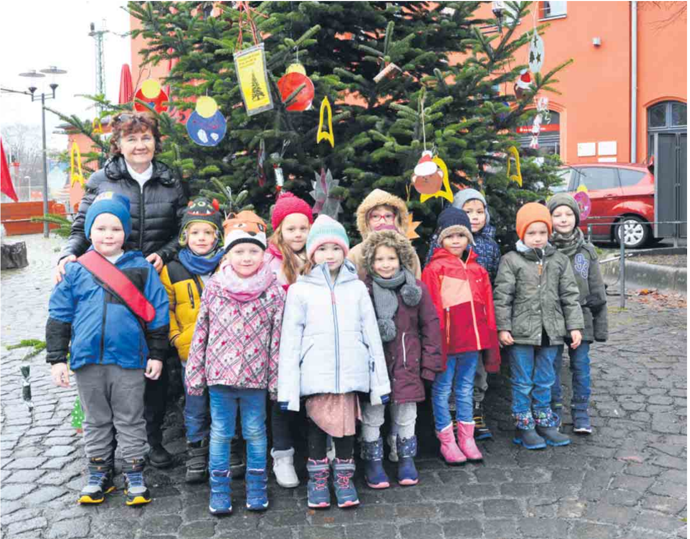
Kinder der KiTa Sausewind vor dem geschmückten Baum.