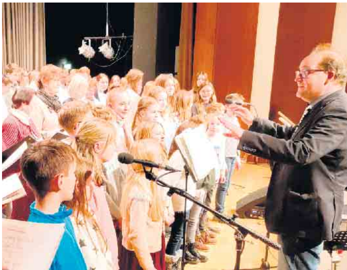
Schulchor und Chorkurs der Stufe 5

extra zu diesem Anlass gegründete BGH-Projektchor, Solistinnen und Solisten sowie die beiden neuen Orchester-AGs: Das Streichorchester und das Kammerorchester. Last but not least nimmt natürlich auch das BGH-Weihnachtsorchester teil. Wir freuen uns auf Ihr Kommen und grüßen herzlich.