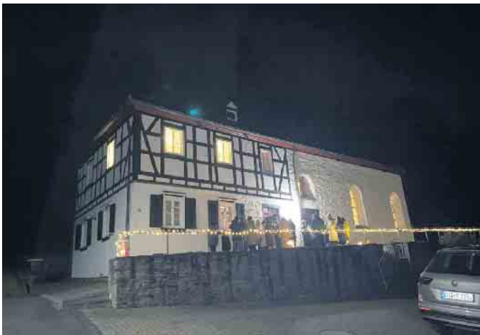
Einen Moment Advent an der Alten Kapelle in Rosbach

Unterschiedliche Besucherzahlen mit tollen Kulissen an den jeweiligen Stationen