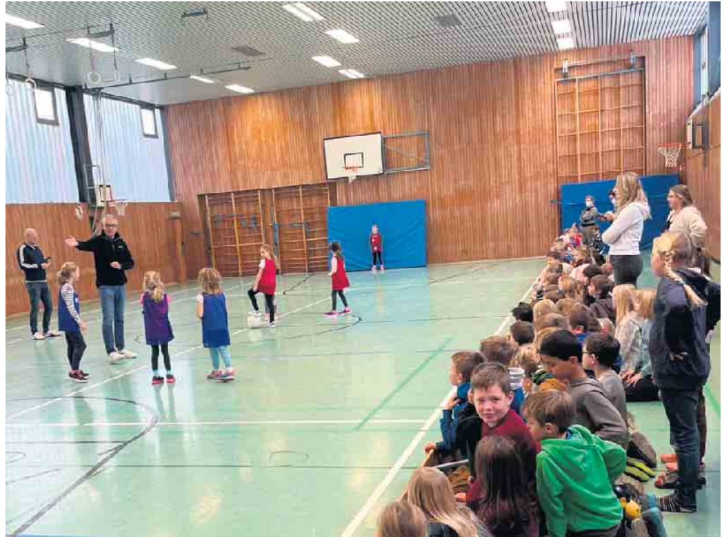
Jungen und Mädchen spielten in spannenden Finalspielen ihre „Weltmeister“ aus

nach spannenden Partien schließlich die Mannschaften aus Holland, Russland, Spanien und Frankreich und freuten sich mit den zweitplatzierten Mannschaften aus England, (zweimal) Hol-