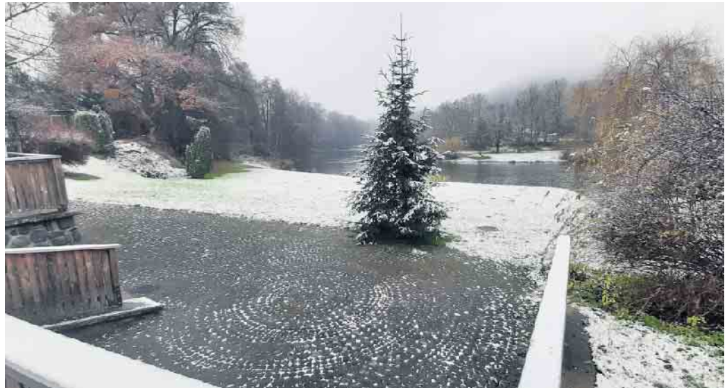
Der Weihnachtsbaum am Dreiseler Dorfbrunnen

Die Dorfgemeinschaft Dreisel lädt ein und freut sich auf einen besinnlich-gemütlichen Abend am Dorfbrunnen.