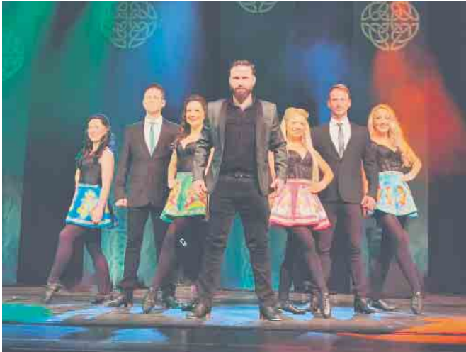
Celtic Rhythms direct from ireland.