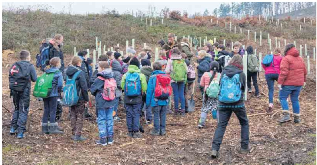
Leuscheider Grundschüler*innen pflanzen Bäume