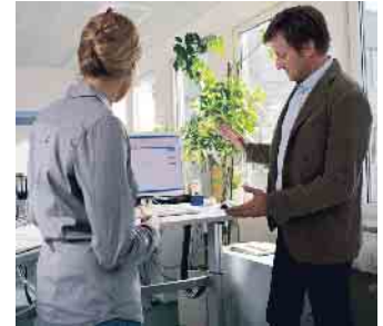
In Teams werden ergonomische Probleme am Arbeitsplatz besprochen.

Lasten, Zwangshaltungen, sich ständig schnell wiederholende Tätigkeiten und Vibrationen. Für den Einstieg in die Gefährdungsbeurteilung von Muskel-Skelett-Belastungen haben BAuA und die Deutsche Gesetzliche Unfallversicherung Checklisten herausgebracht. Im Idealfall können hieraus bereits wirksame Maßnahmen abgeleitet werden. Ist die Beurteilung komplexer,