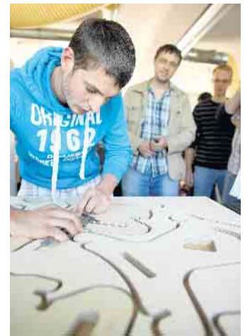
Die Arbeit mit dem Naturmaterial Holz fasziniert die Menschen seit Langem.

die Hand nimmt, findet etwa mit einer Ausbildung als Holzbearbeitungsmechaniker oder -mechanikerin das passende Angebot. Doch nicht nur kaufmännische und technische Berufe bildet der Holzfachhandel vor Ort aus. Für effiziente Prozesse und eine zuverlässige, termingerechte Lieferung der Produkte an die Kunden sind Fachkräfte für Lagerlogistik verantwortlich. Sie begleiten das Holz quasi über den gesamten Weg von der Eingangskontrolle über die Einlagerung bis zur Bereitstellung. Berufskraftfahrer sind dann für den Transport direkt auf die Baustelle verantwortlich. Auch diesen Ausbildungsberuf bieten zahlreiche örtliche Fachhandelsunternehmen an. Unter www.holzvomfach.de/ausbildung etwa gibt es weitere Informationen, Einblicke in die Erfahrungen anderer Auszubildender und Ansprechpartner in den Unternehmen.