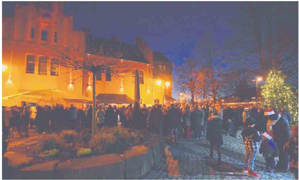
Heiligabend am Bahnhofsvorplatz in Schladern