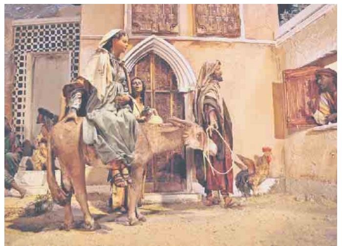
Herbergssuche bildhaft dargestellt