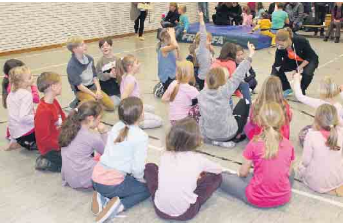
Wer Lust auf Spaß und Bewegung hat, kann jetzt Sportangebote für Kinder beim TuS Schladern ausprobieren.

Vom 27. November bis 2. Dezember heißt es beim TuS Schladern: Wir bringen Kids und Teens in Bewegung! Ob Volleyball, Fußball oder Tanzen - im Rahmen einer bunten Schnupperwoche können Kinder und Jugendliche die verschiedenen Sportangebote des Windecker Vereins testen. Täglich gibt es Neues zu entdecken.