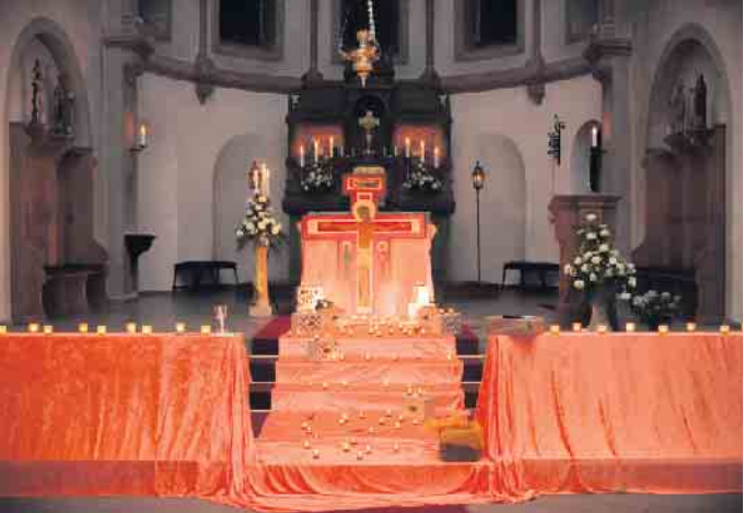
Besondere Taizé-Atmosphäre in Windeck