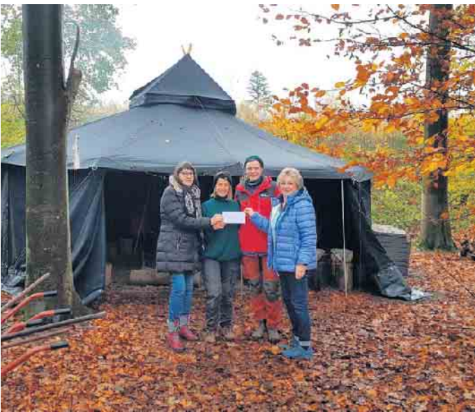
Spendenübergabe an den Waldkindergarten