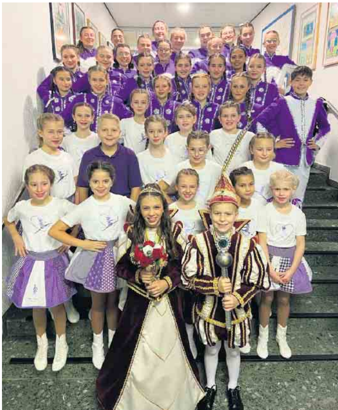
Tanzgruppen mit Kinderprinzenpaar