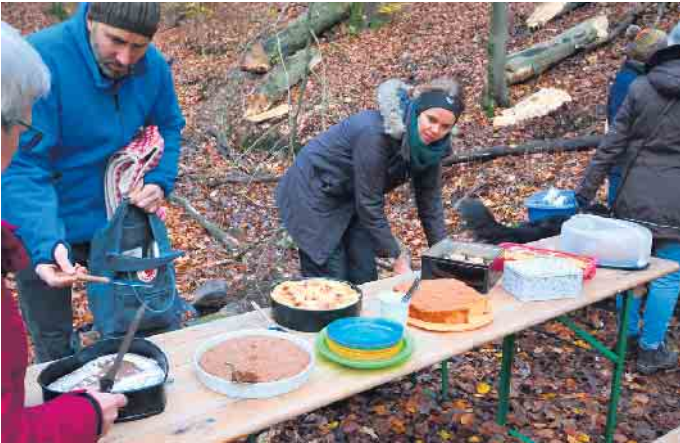
Kuchenbuffet im ‚schwarzen Siefen‘