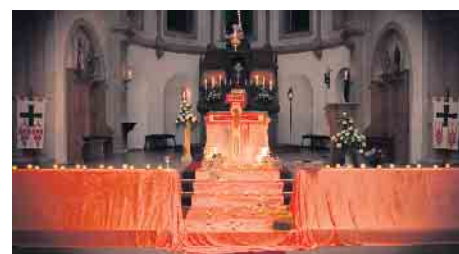
Taizé in Leuscheid