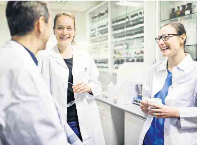
Teamarbeit und abwechslungsreiche Aufgaben machen den Beruf des pharmazeutisch-technischen Assistenten so interessant.

Job so reizvoll.“ Dabei genießt der Beruf ein hohes Ansehen und ist zukunftsicher. „PTAs haben keine Probleme, eine Stelle zu finden - sie werden sogar händelnd gesucht“, weiß der Apotheker aus eigener Erfahrung. Wer sich zum pharmazeutisch-technischen Assistenten ausbilden lassen will, sollte mindestens einen Realschulabschluss mitbringen sowie Inter-