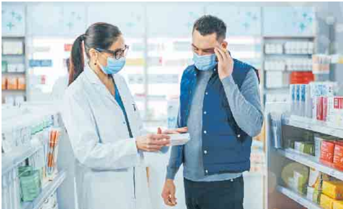
Besonders reizvoll sind die Beratung und der persönliche Kontakt in der Apotheke.