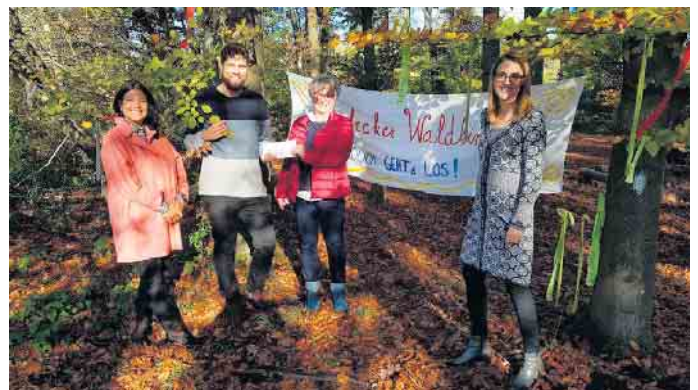
Spendenübergabe an die Waldlinge