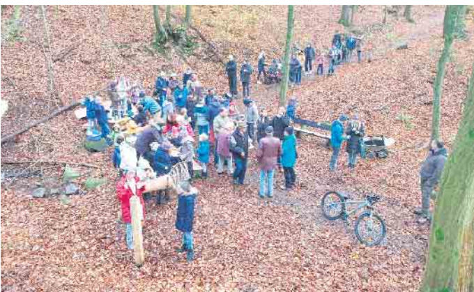
Picknick im Wald