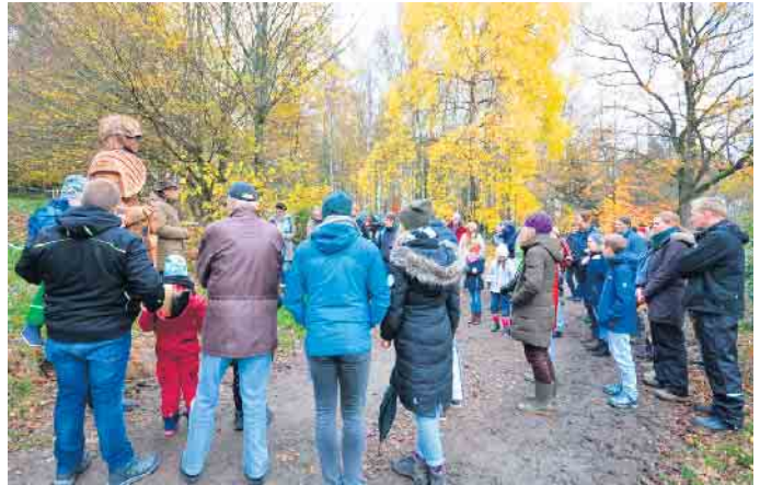
Eröffnungsrede am Ritter