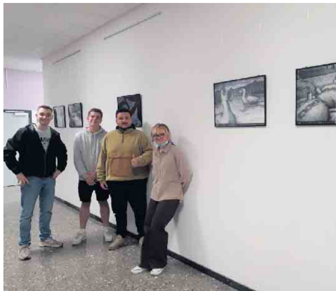
Die Schüler/innen der Q2 präsentieren stolz einen Teil der Kunstwand Biologie