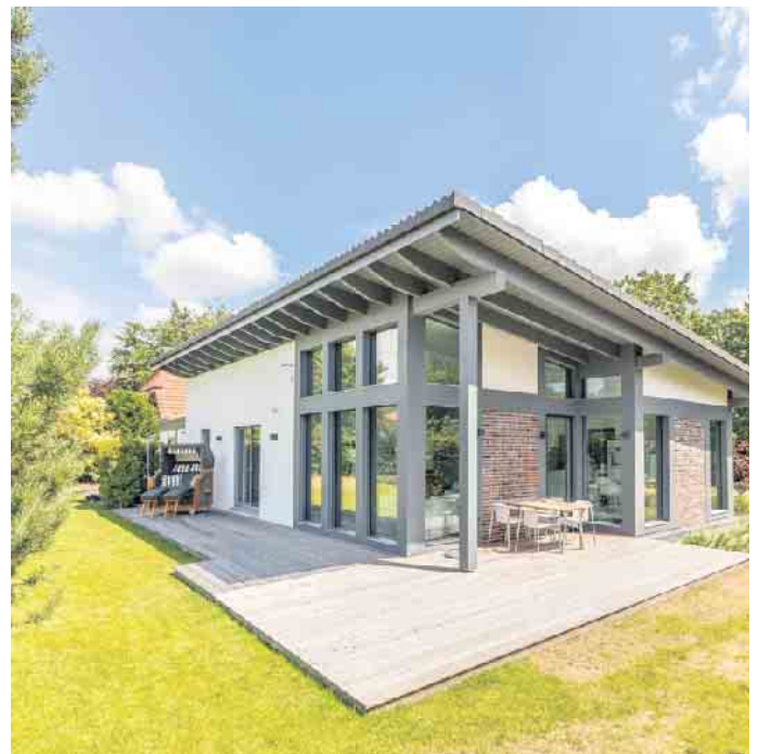
Fertighäuser werden nach den individuellen Wünschen und Bedürfnissen des Bauherrn geplant - vom kompakten Bungalow bis hin zur großen Stadtvilla.