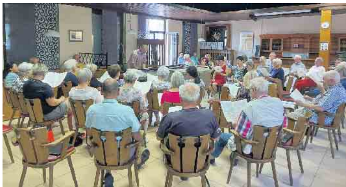
Unser erster Mitsingabend nach der Sommerpause