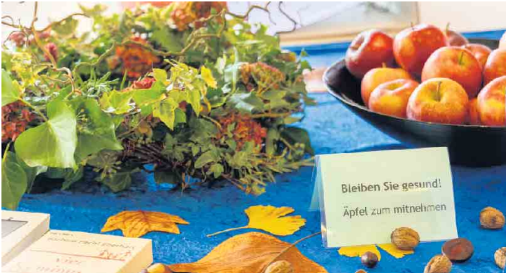
Gesunde Lebensweise.

Viele Faktoren können zur Entwicklung einer Herzschwäche führen. Einige davon können wir nicht beeinflussen. Dazu gehören das Alter und Erbfaktoren. Zum Glück gibt es aber eine ganze Menge, was wir zur Erhaltung unserer Gesundheit beitragen können. Erneut zitieren wir die Deutsche Herzstiftung: „Ein gesunder Lebensstil ist die beste Prävention. Dazu zählen regelmäßige Bewegung, eine gesunde Ernährung mit viel Gemüse und Obst und wenig Fleisch und Salz, Vermeidung von Übergewicht, Alkohol in Maßen, Nikotinverzicht, Stressreduktion, Entspannung und Gesundheits-Check-ups.“ Mit diesen Worten werden die wichtigsten Maßnahmen zusammengefasst, die jeder von uns, gleich welchen Alters, in eigener Verantwortung durchführen kann. Es liegt an jedem Einzelnen, dies