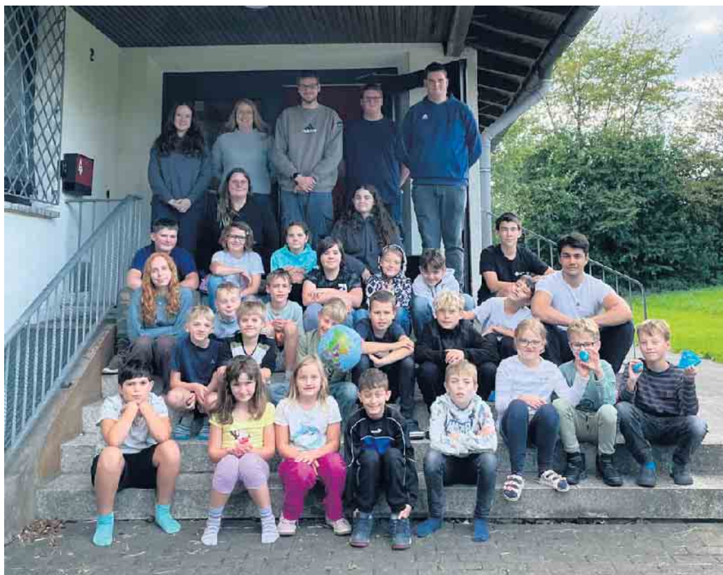
Die Kinder, Betreuer*innen, Teamer*innen und das Logistikteam aus Eitorf

Als dann das Kochteam erschöpft und das Essen verputzt war, ging es für die Kinder in