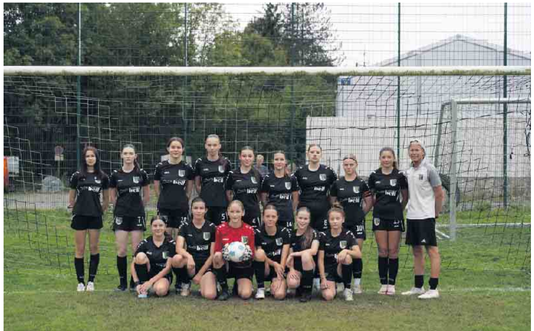
TuS Herchen U17 Juniorinnen

Nachdem unsere U17 Juniorinnen die Qualifikationsrunde mit einem guten vierten Platz abgeschlossen haben, starten unsere Mädels nun am 9. November in eine weitere Saison in der Bezirksliga Mittelrhein. Erster Gegner im Sportpark Haus Tannenhof ist der TuS Chlodwig Zülpich. Als weitere überregional bekannte Gegner warten im Anschluss Spoho 98 Köln, der Bedburger BV, der MSV Bonn, DJK Südwest Köln, Viktoria Bielstein und der SC Rheinbach. Als weiteres Highlight empfängt unsere U17 im Kreispokal am 30. Oktober den FC Hertha Rheidt, Anstoss in Herchen ist um 19 Uhr. Ebenfalls im Kreispokal spielen unsere U15 Juniorinnen, auswärts treten diese am 31. Oktober beim TuS Birk an.