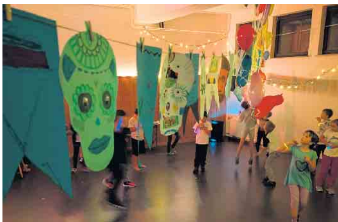
Am Samstagabend gab es eine Kinderdisco inklusive eines Tanzwettbewerbes

Eine Herbstfreizeit wird auch im nächsten Jahr wieder angeboten. Dazu und auch über andere Veranstaltungen informieren wir unter eitorf.dlrg.de/mitmachen/jugend .