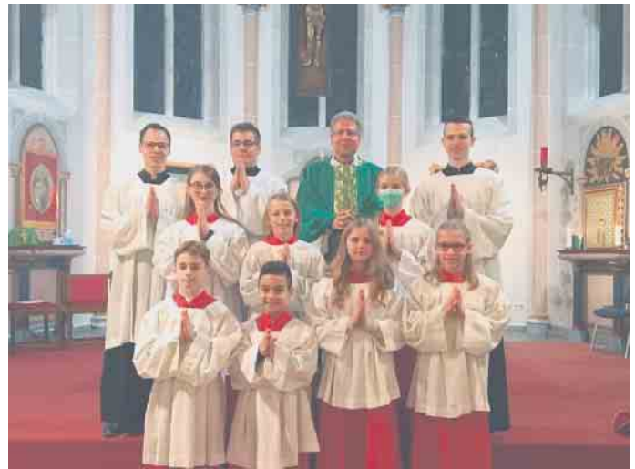
Gruppenbild am Ende der Messe mit vielen strahlenden Gesichtern