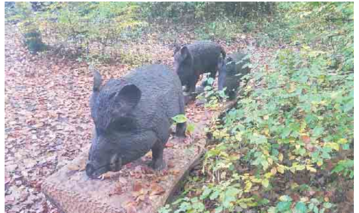
Wildschweine im Hähner Wald, Foto: Bernd Hundenborn

Lange Zeit war es ruhig im Wald oberhalb von Schladern - aber nun sind die Wildschweine wieder aktiv. Sie wühlen erneut in den Wiesen, auf den Wegen und im Wald. Interessant zu erfahren wäre es, ob sich die wilden Tiere über die kleine Wildschweinrotte aus Holz, die vom Bürgerverein Schladern im Hähner Wald aufgestellt wurde, erschrocken haben. Verwundern würde es mich nicht, denn als ich mir die mit der Kettensäge gesägten Tiere das erste mal angeschaut habe, traf ich auf eine Reiterin die versuchte, mit ihrem Pferd an den Holzschweinen vorbei zu reiten. Das Pferd scheute jedoch ein ums andere mal und wollte nicht an den Holztieren vorbei.