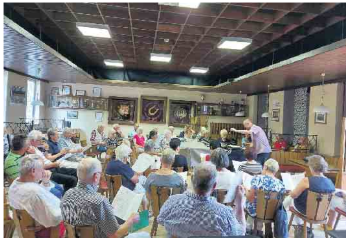
Der EGV bei einer seiner Proben zum Konzert.

Am 29./30. Oktober singen 17 Chöre in der Kulturfabrik Kabelmetal unter dem Motto „Classic meets pop“. Sinngemäß: „Klassik trifft Pop-Musik“. Und so soll es eine bunte Wahl an unterschiedlichsten Liedbeiträgen im Rahmen des Beethovenjahres geben.