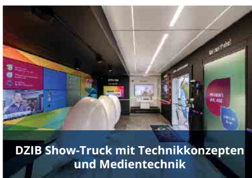
DZIB Show-Truck mit Technikkonzepten und Medientechnik