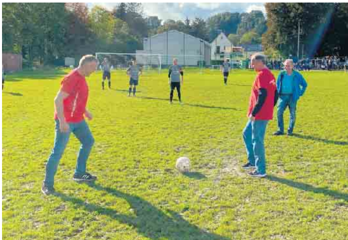
Anstoß der Partie durch Windecker Dreigestirn