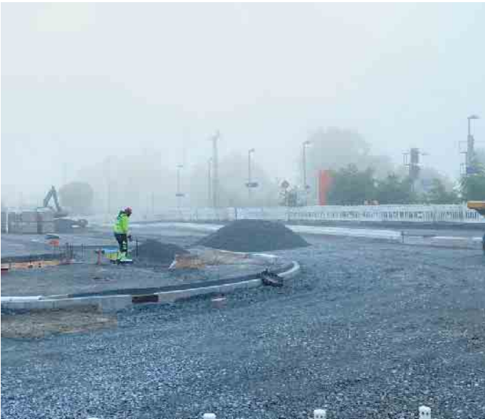
Bauarbeiten am Bahnhof Schladern

Investitionen in Zukunft und moderne Mobilität