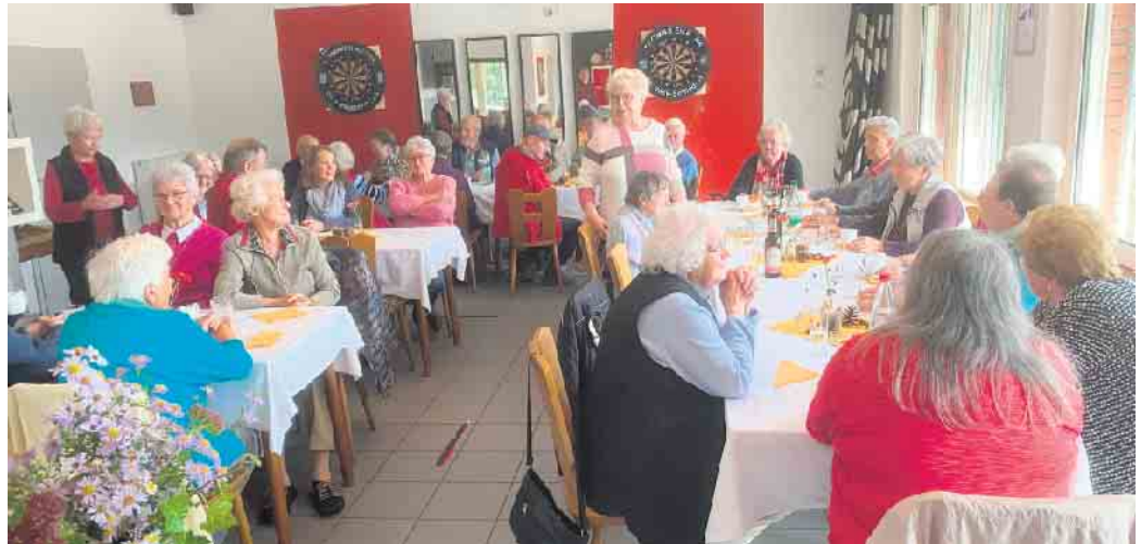
Seniorenbrunch in Schladern

Gäste ausgiebig mit Gleichaltrigen austauschen und an den vielen positiven Rückmeldungen war ersichtlich, dass es wieder eine gelungene Veranstaltung war.