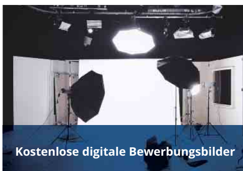
Kostenlose digitale Bewerbungsbilder