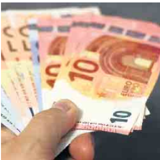
Bargeld aus dem Automaten, in Windeck wird das immer mehr zu einem begrenzten Gut.

zende der FDP Windeck, bekräftigt: „Der Wirkungsrahmen einer Sparkasse im öffentlichen Besitz, ist gegenüber privater Unternehmen eingeschränkt, denn sie hat eine Gemeinwohl- und Versorgungsverpflichtung und erhält dafür die Sicherheit eines kommunalen Unternehmens. Wenn aber ganze Landstreifen vom Bargeld abgehängt werden, dann muss man die Sinn-Frage einer solchen Konstruktion stellen und gleichzeitig feststellen, dass die Privatwirtschaft das besser kann.“ Die FDP Windeck hat deshalb einen Antrag im Rat gestellt, die Kreissparkasse Köln an ihren Versorgungsauftrag zu erinnern und