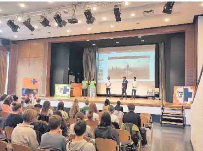
Besuch der Kindernothilfe.