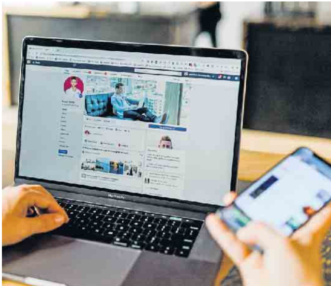
In der virtuellen Welt überzeugen: Stellensuchende sollten ihre Onlineprofile regelmäßig überprüfen und stets aktuell halten.

Neben Karriere- und Businessplattformen tummeln sich viele heute ebenfalls in den eher privat ausgerichteten sozialen Medien. Doch auch hier sollten Bewerber seriös auftreten. Bilder, Beiträge, Kommentare und alles, was dem eigenen Ruf scha-