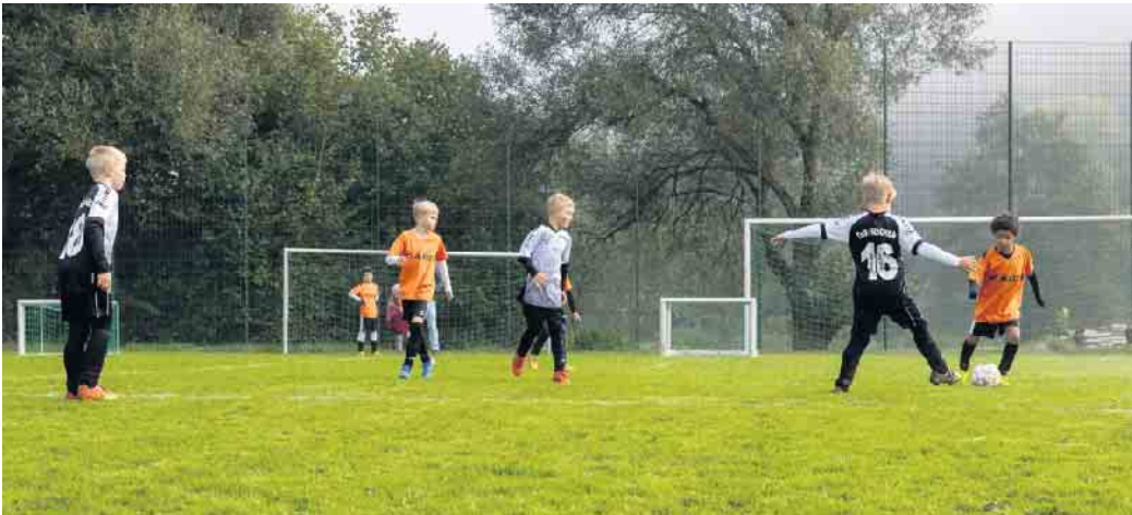
Die E-Jugend des TuS Herchen in Aktion.

In zahlreichen kurzen Spielen konnte sich jeder mit jedem messen. Am Ende gingen alle Kinder als Gewinner vom Platz. Die weiteren Jugendspiele: Unsere C-Juniorinnen unterlagen unglücklich dem SF Troisdorf