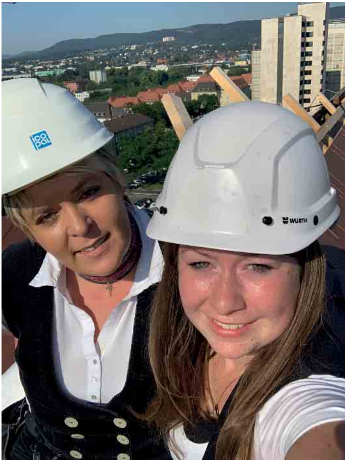
Klimaschutz, keine reine Männersache; es gibt auch Frauen im Dachdeckerhandwerk.

arbeiten und dabei auch Klimaschützer sein wollen, liegen mit einer Ausbildung im Dachdeckerhandwerk genau richtig“, rät ZVDH-Präsident Dirk Bollwerk und ergänzt, dass das Dachdeckerhandwerk bislang auch gut durch die Coronakrise gekommen sei: kaum Kurzarbeit und wenige Entlassungen. Auch dies ein Pluspunkt, der für eine Dachdecker-Ausbildung spricht: Dachdecker sind immer gefragt. Mehr Infos unter www.dachdeckerdeinberuf.de (akz-o)