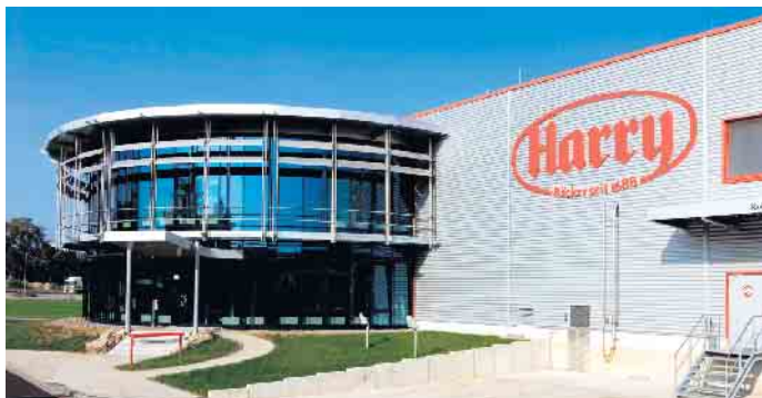
Werk in Troisdorf.

Die 3. Nacht der Technik in Bonn und dem Rhein-Sieg-Kreis