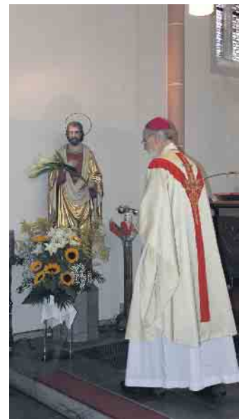
Segnung der neuen Josephp-Kerze