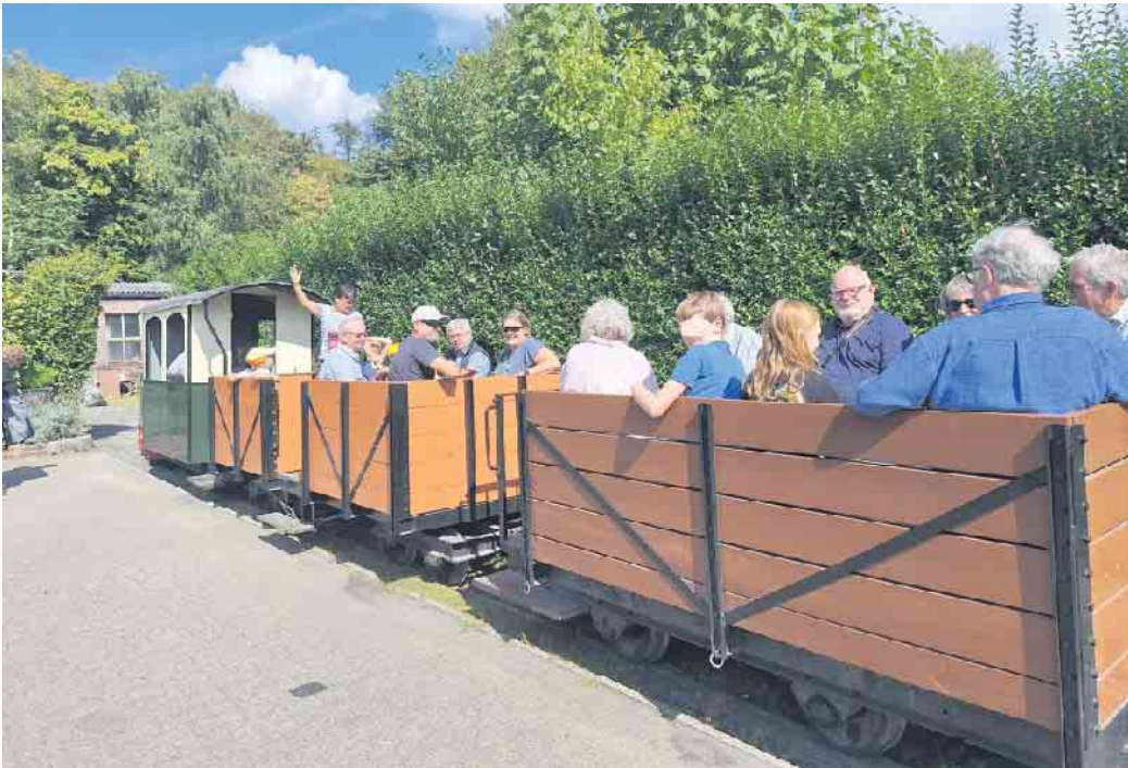
Die Fahrt mit der Feldbahn bereitete den Teilnehmern viel Spaß.

einheitlich begeistert über den Ausflug. „Es war ein rundum gelungener Tag, der noch lange in Erinnerung bleiben wird“, lautete das Fazit vieler Teilnehmer.