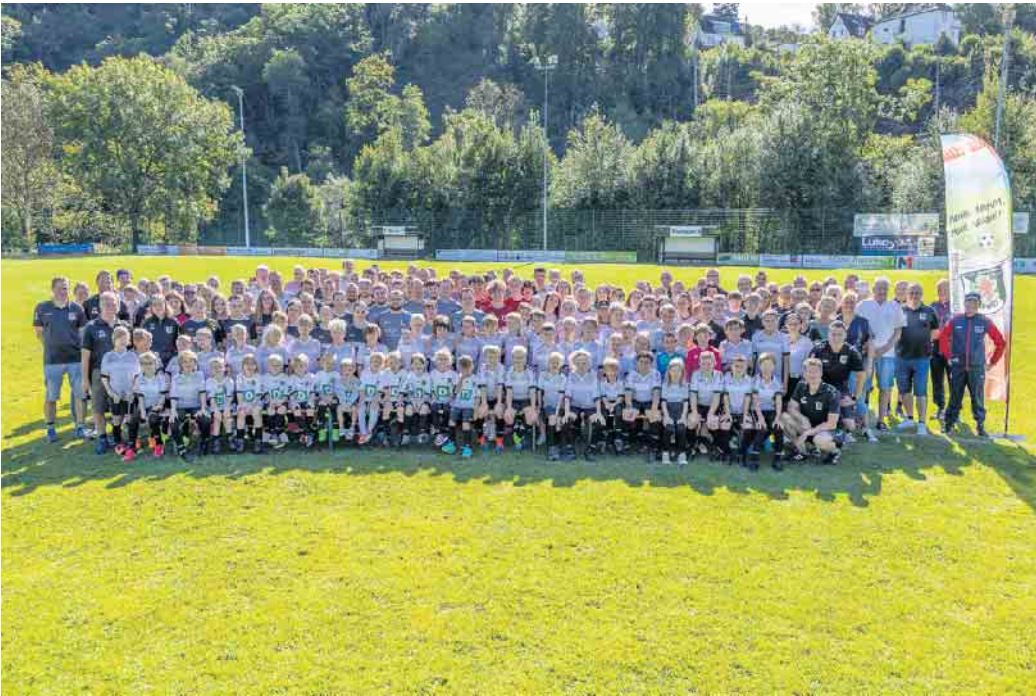
Der TuS Herchen in voller Stärke