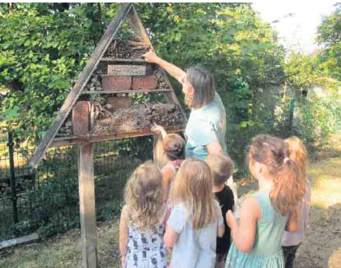
Auch im Insektenhotel finden wir kleine Besucher.

Das Naturmobil besucht die Kita Abenteuerland