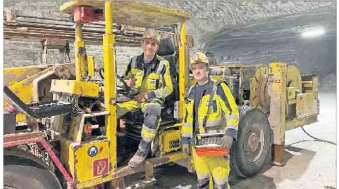
Die Bergleute arbeiten mit hochmoderner Ausrüstung und Technik.