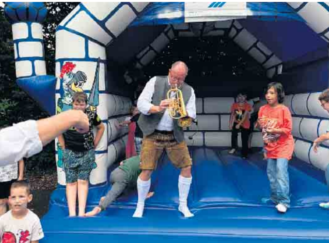
Musik auf der Hüpfburg.