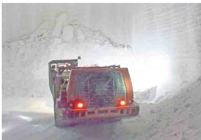
Im heimischen Kali- und Salzbergbau werden wichtige Rohstoffe gewonnen.