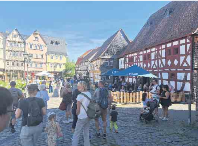
Der Jahresausflug ging in den Hessenpark.

len Zügen. Für gute Stimmung und Verpflegung mit frisch be- legten Brötchen und kühlen Ge- tränken war während der ge- samten Busfahrt bestens ge- sorgt. Die Dorfgemeinschaft be- dankt sich herzlich beim Busun- ternehmen Wünning für die un- komplizierte und kompetente Begleitung. Als nächste gemeinsame Ver- einsaktivität steht am 5. Okto- ber der Wandertag an, auf den sich alle schon freuen.