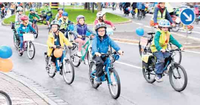
Die Straße gehört (auch) uns.

am öffentlichen Raum einzufordern? Die Straße gehört (auch) uns. Deshalb: „Demo am Weltkindertag, weil ich Radfahren so sehr mag!“ Wir fahren mit Polizeibegleitung eine Strecke von ca. 6 Kilometer über Altwindeck und hoffen auf eine rege Beteiligung. Am Samstag, 21. September, von 10 bis 14 Uhr, gibt es ein Fahrrad-RepairCafe in der Werkstatt des Biketreff Leuscheid (Ecke L312/ Weyerbuscher Str.). Dort können Interessierte ihre defekten Räder unter Aufsicht reparieren (lassen). Kleinere Reparaturen können nach Terminbuchung unter biketreff-leuscheid.de kostenfrei durchgeführt werden. Ohne Termin bitte vor 12 Uhr vorbeikommen, Wartezeit mög-