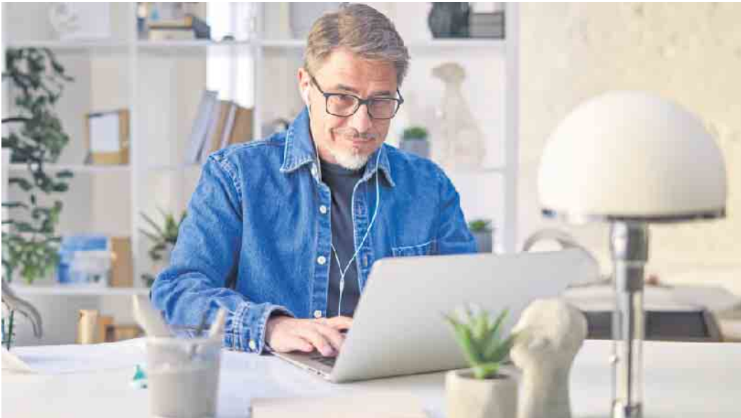
Ob jung oder nicht mehr ganz so jung: Eine Umschulung ist für jeden zu bewältigen und kann zum neuen Traumjob führen.

Nein, qualifizierte Bildungsanbieter bereiten ihre Teilnehmerinnen und Teilnehmer umfassend vor,