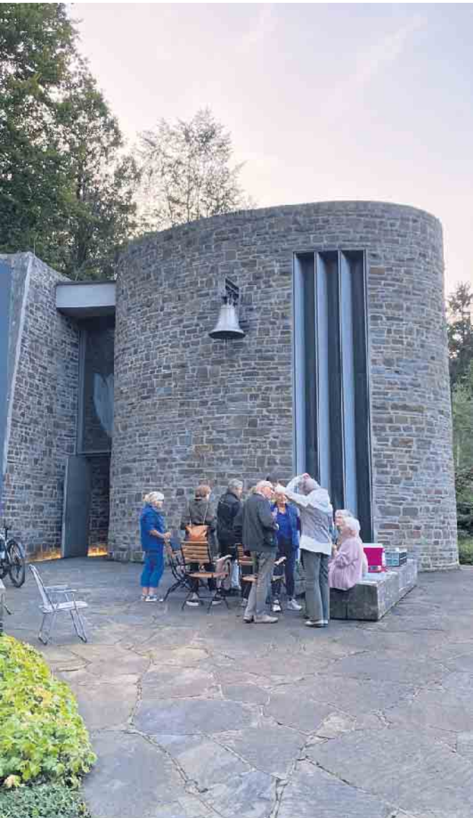
Gruppe vor der Kapelle in Kömpel