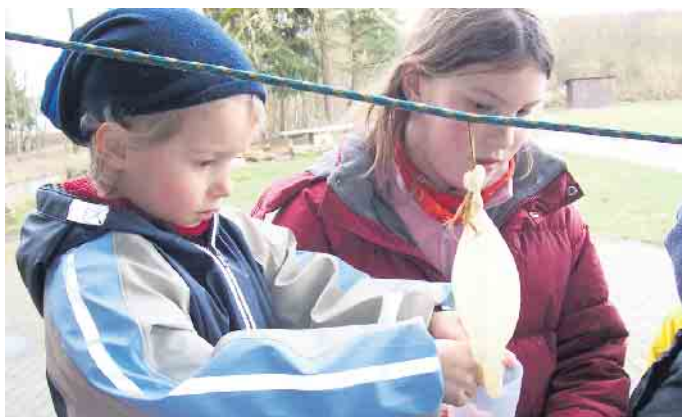
NABU Kindergruppen.

der Kooperationspartner Naturschule Aggerbogen, Lohmar, zur Verfügung aber ein eigenes Büro in oder um Sankt Augustin herum wäre schon mittelfristig sehr sinnvoll. Wer sich über die Arbeit des Vereins und die einzelnen Projektgruppen (u.a. Amphibien, Insekten, Ornithologie, Klimaschutz, Pflege- management, "Kleine Wilde") informieren möchte, möge das gerne über die Website unter www.nabu-rhein-sieg.de tun.