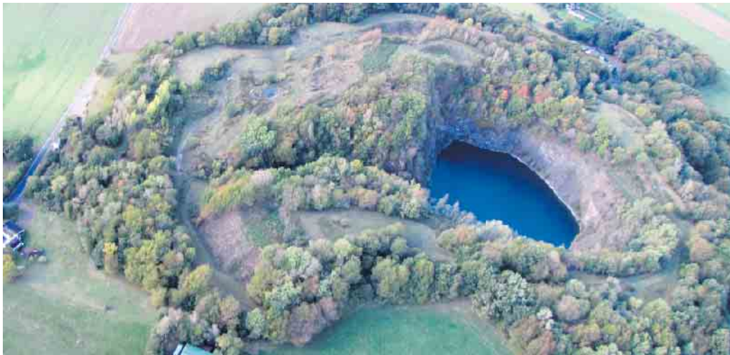
NABU Projekt Eulenberg.

Schatzmeisterin: Hannegret Kri- on, die dem Vorstand bereits seit