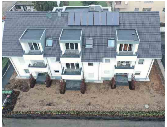
Das Dachdeckerhandwerk, der richtige Ansprechpartner für die Solaranlage auf dem Dach.

Dachdecker sind Klimaschützer Zunehmend wird es auch wichtig,