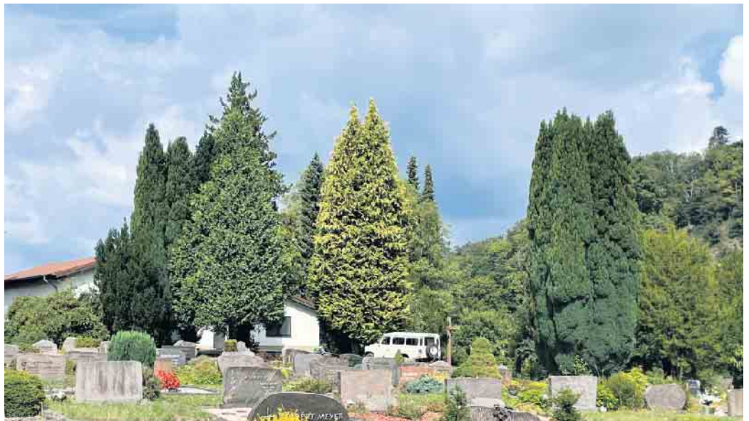
Blick auf die Friedhofshalle im Sommer