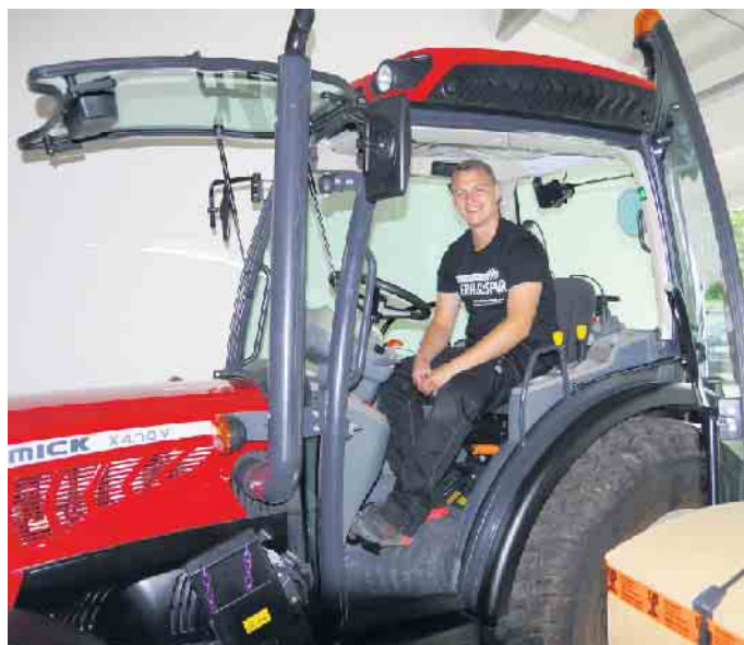
Schweres Gerät sicher beherrschen: Die Leidenschaft für Technik ist eine gute Voraussetzung für eine Ausbildung im Motorgeräte-Fachhandel.