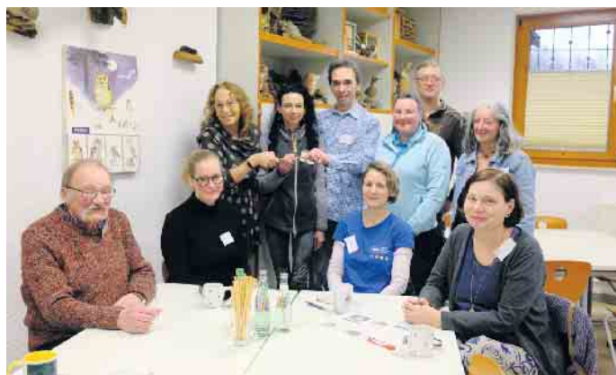
„Kleine Wilde“- Staffelübergabe an A&G Vey.