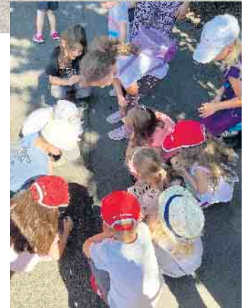
Die Entdeckung des Tages - eine Blindschleiche.