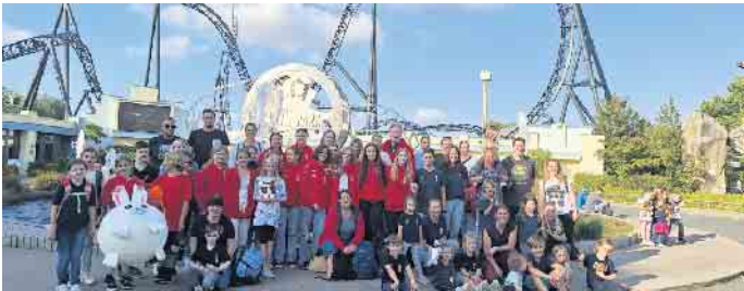
KG Schladern im Moviepark Germany

Die KG Schladern besuchte wie schon im Vorjahr den Movie Park Germany in Bottrop. Gleich über 60 kleine und große Mitglieder unserer KG fuhr am vergangenen Samstag mit dem Bus in den beliebten Familienfreizeitpark. Das Wetter spielte perfekt mit und die Stimmung, sowohl im Bus wie auch im Park selbst waren ausgelas-