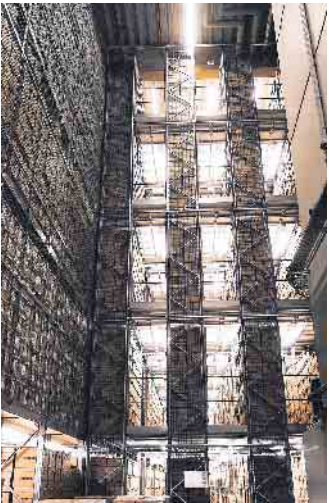
Erinnert an eine Kathedrale: Das riesige Archivdepot des Kunstlogistikers in Frechen bei Köln.