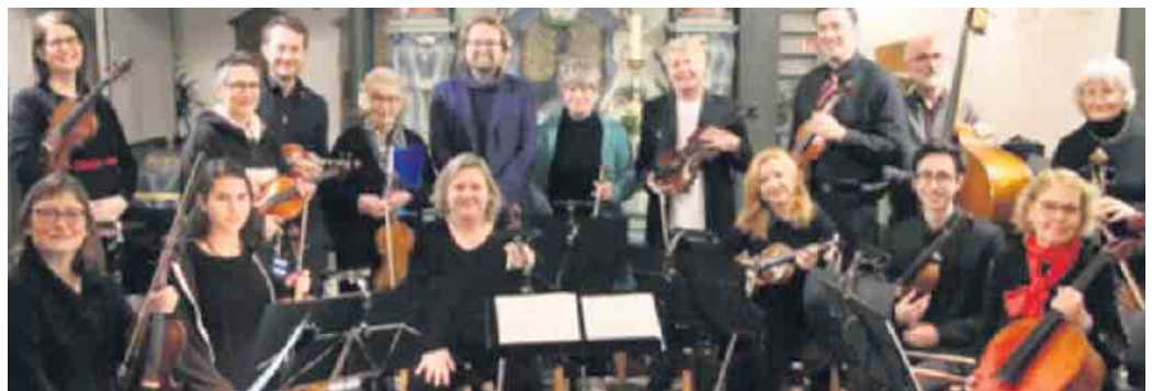
Das Kammerorchester Waldbröl.