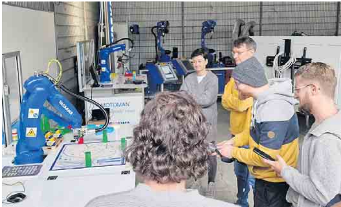
Alle waren mit großer Freude bei der Sache.

raussetzungen für Schulungen und Workshops geschaffen. Das Troisdorfer Unternehmen „ROBOVERSE - robotics at school“ kooperiert eng mit der Windecker Landfabrik und Yaskawa und gemeinsam ist es gelungen, die Gesamtschule Windeck davon zu überzeugen, wie wichtig es heutzutage ist, auch Unterrichtsangebote in Robotik zu offerieren. Federführend waren hierbei