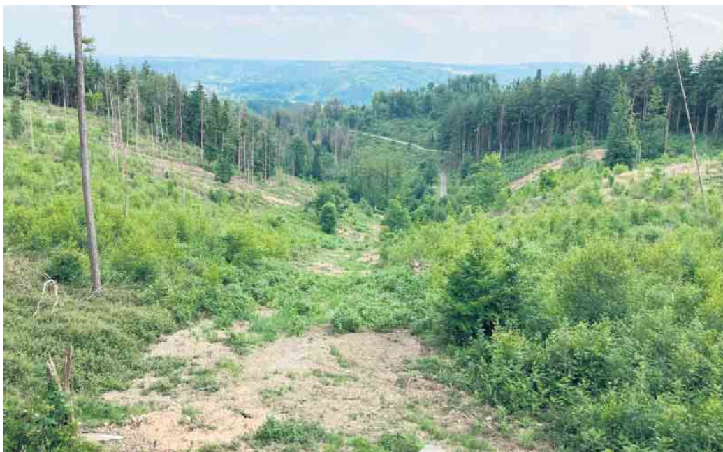
Unsere Topografie als Alternative zur Grundsteuererhöhung - Gerodetes Reutersiefen-Tal oberhalb der Ortschaften Wilberhofen und Rossel

Wir als SPD Windeck stehen für eine Finanzpolitik, die sich nicht hinter Zahlen versteckt, sondern die Lebensrealität der Menschen in den Mittelpunkt stellt. Gerade in herausfordernden Zeiten setzen wir uns für soziale Ausgewogenheit, Transparenz und kommunale Gerechtigkeit ein.