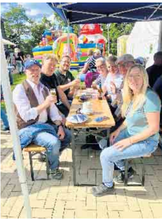
Die Politik unterstützt Sommerfest des Bürgervereins in Hurst.

Da sich in diesem Jahr auch Parteien mit extremen Positionen zur Wahl stellen, kommt Ihrer Stimme besondere Bedeutung zu - und Ihnen eine besondere Verantwortung! Die CDU Windeck steht für Zusammenhalt und Verantwortung gegenüber allen Bürgerinnen und Bürgern. Wir wollen gestalten - nicht spalten! Dafür bitten wir um Ihre Unterstützung und Ihre Stimme.