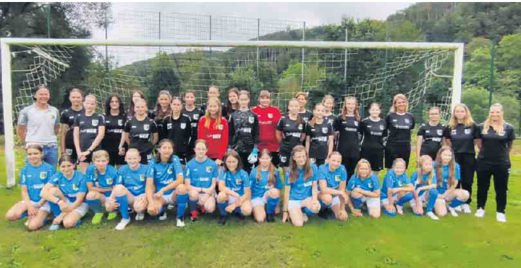
Frauenpower beim TuS