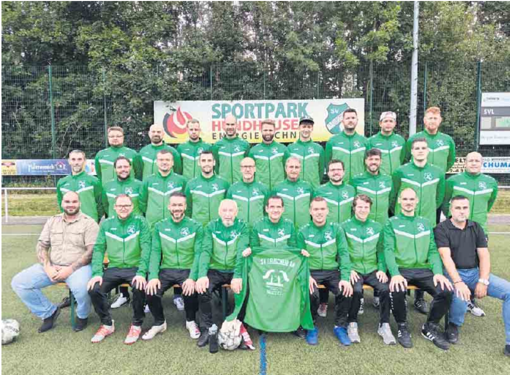
Die „Alten Herren“ des SV Leuscheid 1920 e.V.

Die 37 aktiven Mitglieder der „Alten Herren“ des SV Leuscheid dürfen sich nun mit neuen Trainingsanzügen präsentieren. Die Anzüge werden hoffentlich dem aktuellen Kreismeister Ü32 und dem dreimaligen Turniersieger dieser Saison weiterhin viel Erfolg bringen.