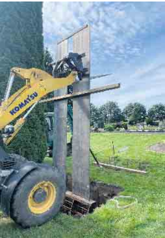
Aufbau von zwei Stelen, die gemeinsam ein Kreuz bilden

An alle Mitglieder und Interessierte, nächster Arbeitseinsatz ist am Samstag, 7. September, um 9 Uhr auf unserem Friedhof im Siegbogen. Nach den großen Pflanzaktionen der letzten Monate geht es nun wieder hauptsächlich um Pflege- und Reinigungsarbeiten. Aktuelle Informationen finden Sie auch unter www.friedhofsverein-rosbach.de . Der Vorstand