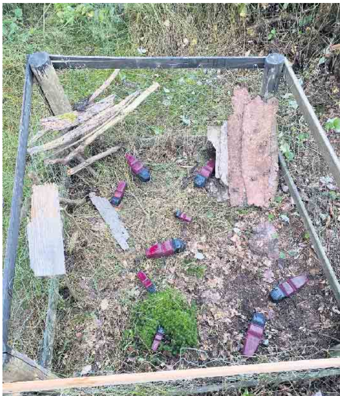
Die Ameisen in ihrem Auslauf.

Ameisen und positionieren sie immer wieder neu. Die Tiere waren im Laufe der Zeit doch arg gealtert. Nun befindet sich eine neue Familie im Auslauf, mit etlichen großen, aber auch kleinen Exemplaren.