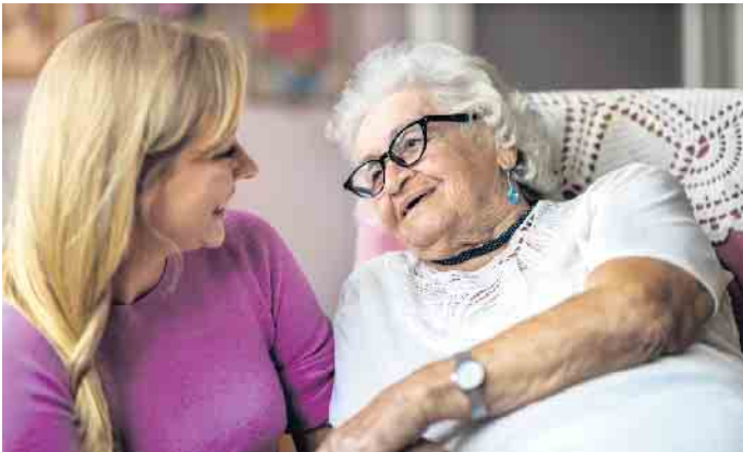
Warum nicht aus einem Ehrenamt einen Beruf machen? Mit einer Weiterbildung zur Betreuungskraft können sich völlig neue Job-Perspektiven eröffnen.

Dass Bildung nicht teuer sein muss, beweisen die vielen Fördermöglichkeiten: Arbeitssuchende können sich ihre berufliche Weiterbildung mit einem Bildungsgutschein finanzieren lassen, Träger wie die Agentur für Arbeit übernehmen dann die anfallenden Kosten der Kurse. Berufstätige und Arbeitgeber werden zum Beispiel durch das Qualifizierungschancengesetz gefördert. Unter www.ibb.com sind weitere Informationen zum Kursangebot sowie zu Fördermöglichkeiten zu finden. (DJD)