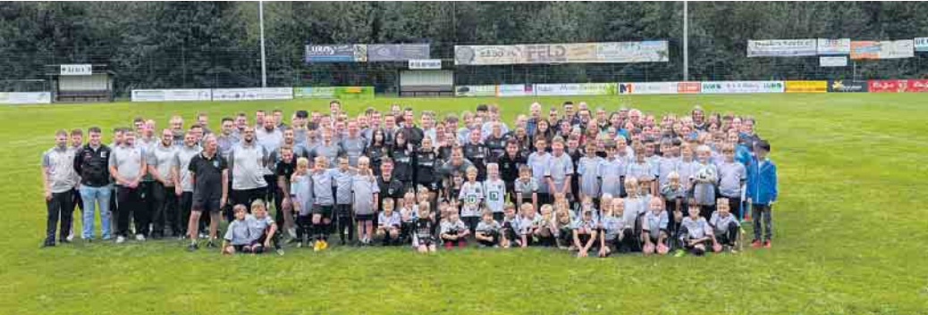
Gruppenfoto TuS: Zwölf Teams - ein Verein

TuS Herchen 1922 e.V. - Abteilung Fußball