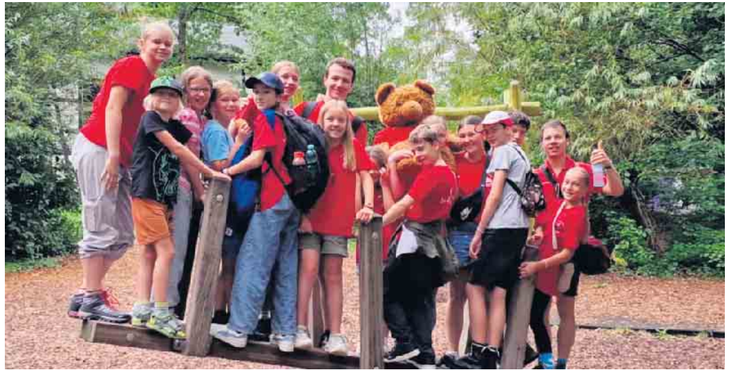
Gruppenbild mit Maskottchen Sanella

Am nächsten Tag ging es recht früh weiter, da uns ein Ranger vom Nationalpark in Düttlingen erwartete. Auf einem Rundweg durch den Wald spielten wir verschiedene Spiele, absolvierten ei-