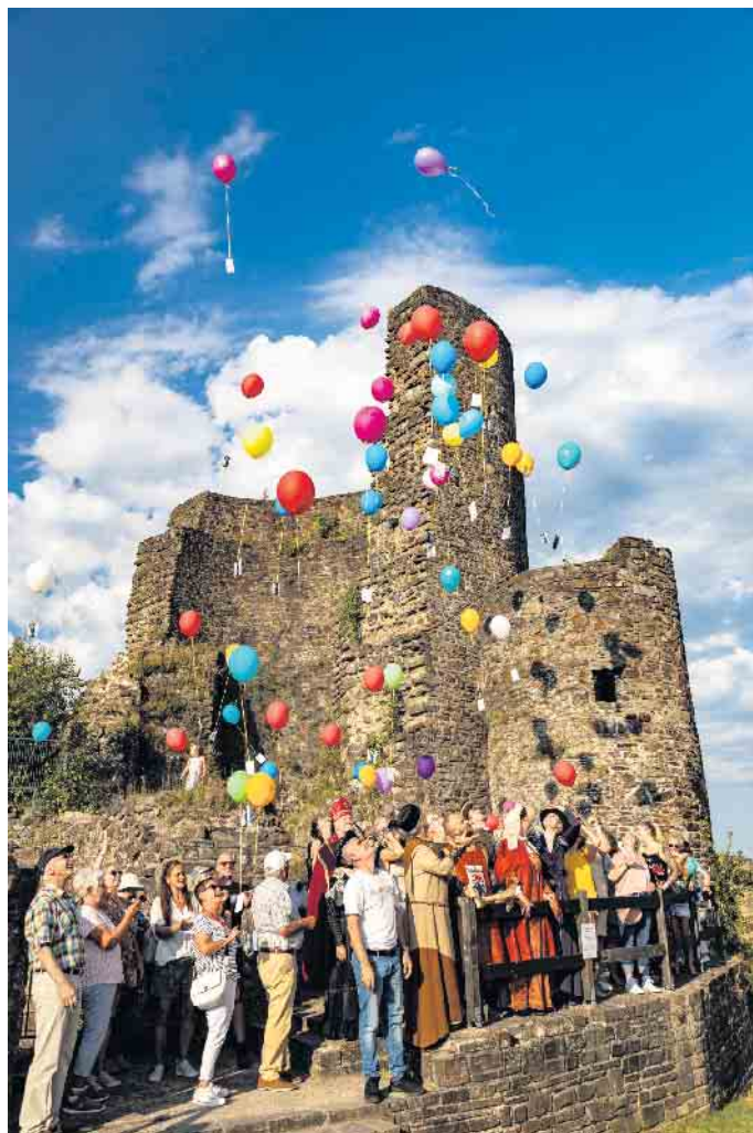
Start des Ballonwettbewerbs