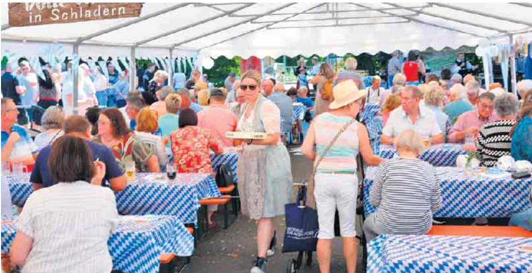
Volle Hütte in Schladern.

Für die kleinen Besucher bieten wir eine Hüpfburg, Schminken und Spiele aus dem Spielmobil an. Der Förderverein der Bodenberschule wird an ihrem Stand Waffeln, Kaf-