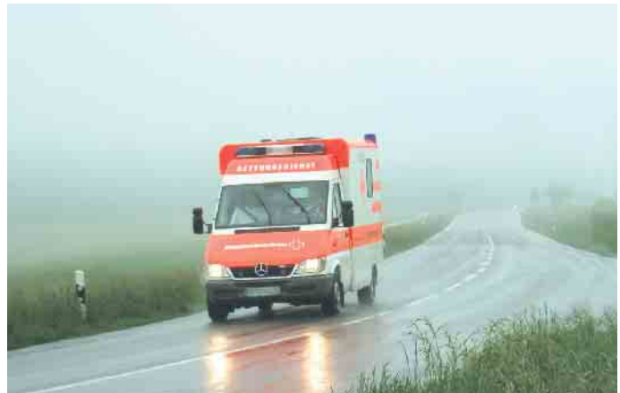
Bei akuten Notfällen ist die Transportdauer von hoher Bedeutung.