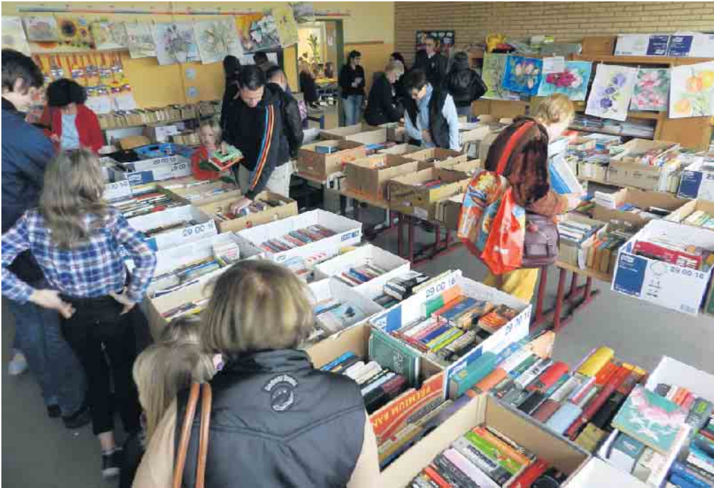
Bücher für Groß und Klein