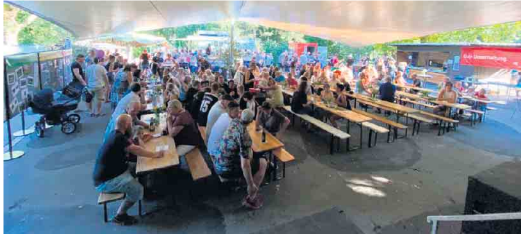
Kaffee & Kuchen unterm Pavillon

B-Juniorinnen - 16 Uhr - Bezirksliga: TSV 07 Köln Merheim - TuS Herchen Besuchen Sie unsere Heimspiele und unterstützen Sie unsere Mannschaften bei Ihren Spielen.