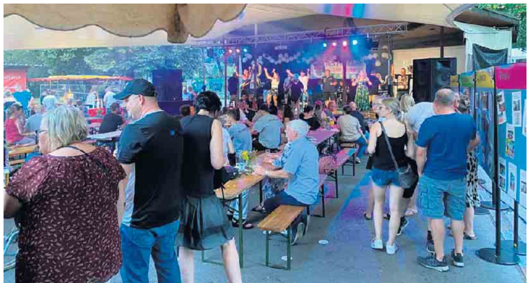
Auftritt der Gruppe „Die Werstener“ Music Company