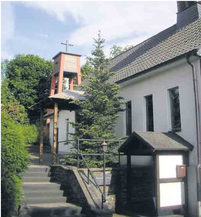
Friedenskirche für den Frieden im Dorf, im Land, in der Welt

Natürlich auch für Omas und Opas und alle Freunde und Verwandten