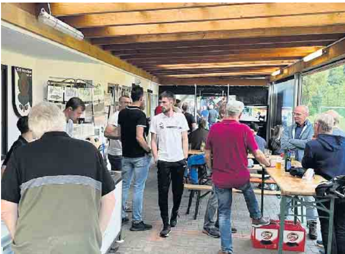
Ehemaligenfest TuS Herchen

TuS Herchen 1922 e.V. - Abteilung Fußball