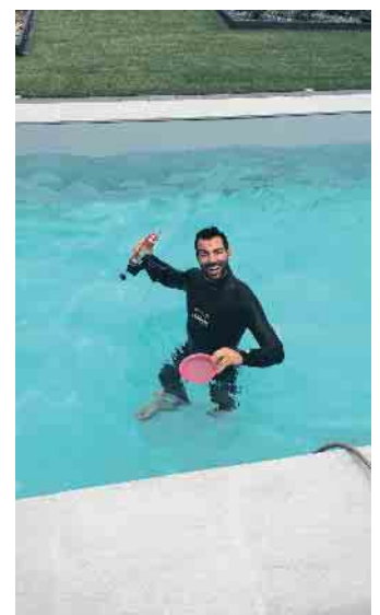
Wasserspaß bei der Arbeit.

Gibt es einen Beruf, in dem man Träume erfüllen kann? In dem individuelle Beratung genauso gefragt ist wie handwerkliches Können und ein Gespür für Ästhetik und Design? In dem man Werte schafft, die für andere den „Himmel auf Erden“ bedeuten? Schwimmbadbauer ist so ein Beruf - vor allem, wenn es um den Bau privater Pools geht. Hier sind kreative Könnern am Werk, die die Wellnesswünsche ihrer Kunden wahr werden lassen. Schwimmbadbauer schaffen Entspannungsoasen, Urlaubsorte ohne Anreise oder schlicht Wasserspaß vor der Haustür. Wer das beherrscht, ist ein Allroundtalent. Schließlich müssen Poolexperten umfassendes Fachwissen haben. Beckenbau und Bauphysik sind ebenso gefragt wie Wärmegewinn-