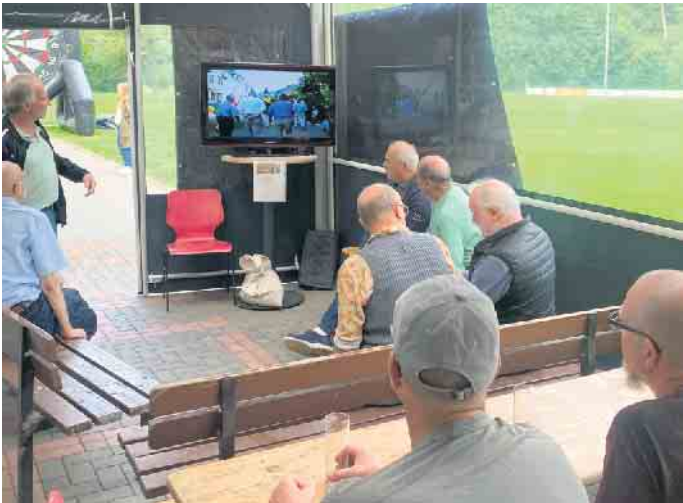
Vorführung historischer Filme

Freunde und Ehemalige des TuS Herchen zu einem Treffen in den Sportpark „Haus Tannenhof“ eingeladen. Dieser Einladung wurde von jung bis alt, trotz der widrigen Wetterbedingungen, rege gefolgt und es wurde bis spät am