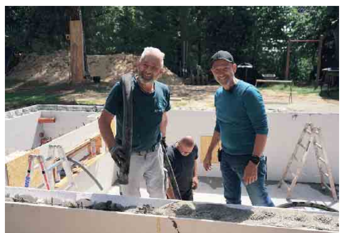
Gute Laune beim Poolbau.