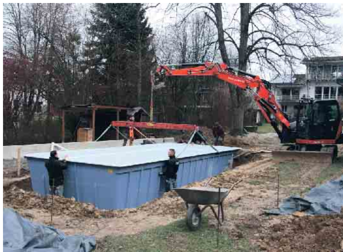
Teamwork auf der Baustelle.

des Bundesverbandes Schwimmbad & Wellness e.V. (bsw) unter www.bsw-web.de . (akz-o)