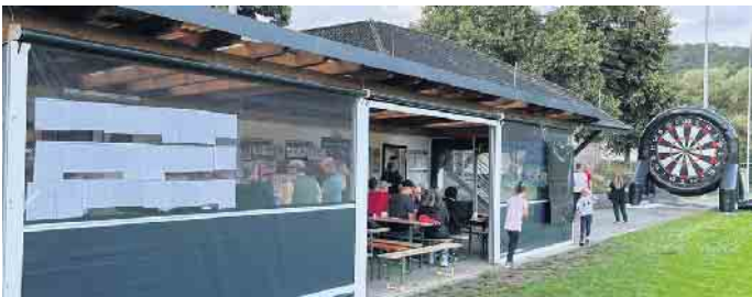
Ehemaligenfest TuS Herchen