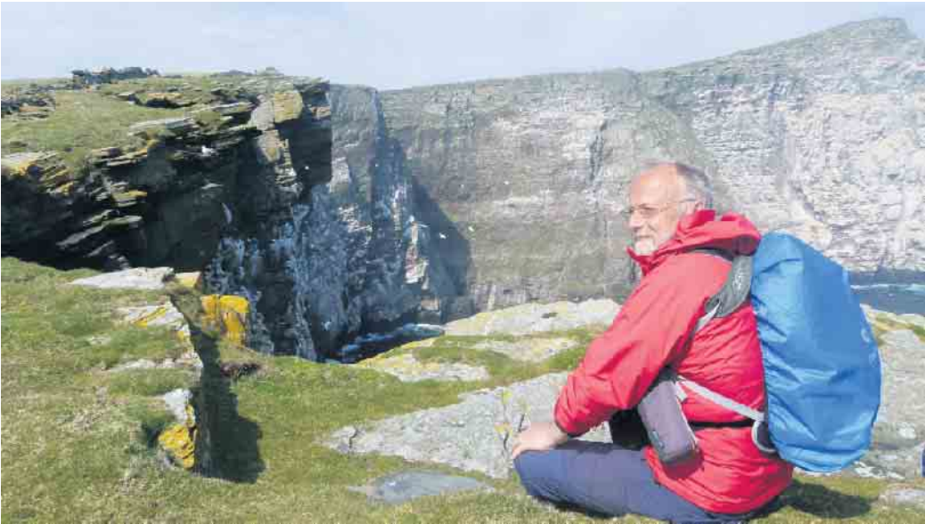
Auf den Shetlandinseln.

Aber vielleicht in vier Anläufen? Über vier Jahre Teiletappen von durchschnittlich 1.500 Kilometern? Das wäre nichts Ungewöhn-