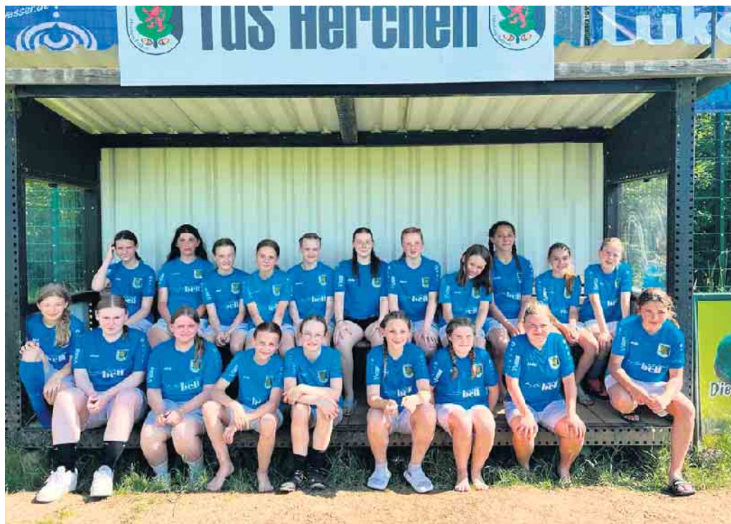
Unsere erfolgreichen D-Juniorinnen der letzten Saison spielen nun um die Qualifikation zur Bezirksliga

Bei den Jungs ist es eine A-Jugend (Jahrgang 2005 & 2006), eine B-Jugend (Jahrgang 2007 & 2008), eine D-Jugend (Jahrgang 2011 & 2012) sowie eine E-Jugend (Jahrgang 2013 & 2014). An dem vom DFB geforderten „Neuen Spielformen“, ab dieser Saison, nimmt unsere F-Jugend (Jahrgang 2015 & 2016) und unsere Bambinis Jahrgang 2017 und jünger dran teil. Das Schlüsselwort des Erfolgs: