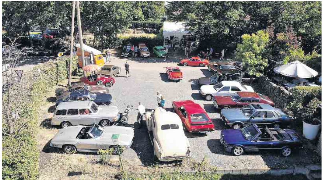
Impression vom 1. Oldtimer-Treffen Hennef-Lichtenberg im Sommer 2019

Die Ankunft der Fahrzeuge erfolgt um 12 Uhr. Eine Stunde später startet eine Autofahrt durch das