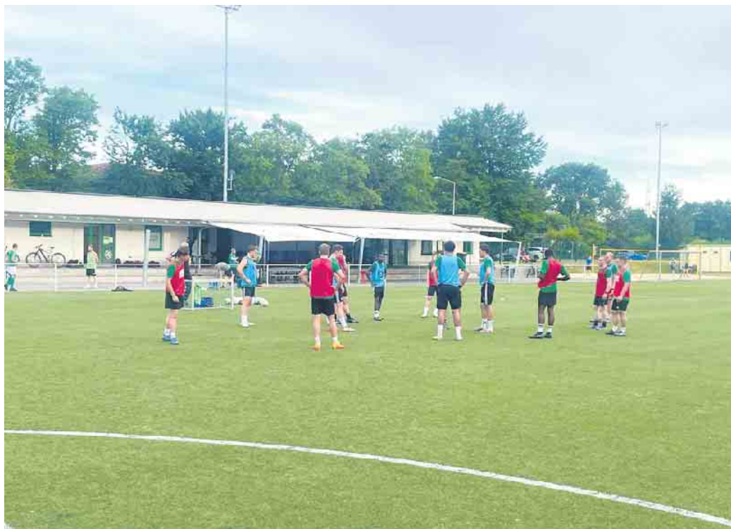
Unsere 1. Mannschaft im Training

Im ersten Test unserer 2. Mannschaft musste man sich den ambitionierten B-Ligisten aus Eitroff verdient geschlagen geben. Das Ergebnis des letzten Tests unserer Reserve stand zum Redaktionsschluss noch nicht fest. Mittlerweile sind die Spielpläne für unsere Fußballer online und es dauert nicht mehr lange, ehe