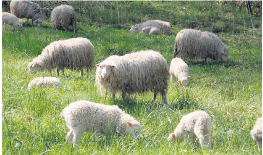
Moorschnucken im Krabachtal 2014