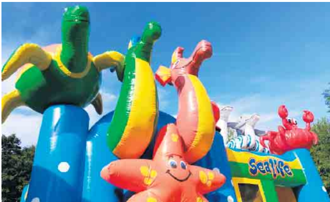
Sommerfest in Obernau

Am Sonntag, 13. August, geht es rund im „Bruchhardt-Quartier“. Der Bürgerverein Obernau veranstaltet von 11 bis 17 Uhr sein jährliches Sommerfest auf dem Spielplatz mit Waffeln, Kaffee und Kuchen sowie Würstchen und Grillsteaks. Wie im letzten Jahr werden wir unterstützt vom Team des TV Rosbach mit dem Spielmobil und der Boule-Platz wartet auf eifrige Spieler.