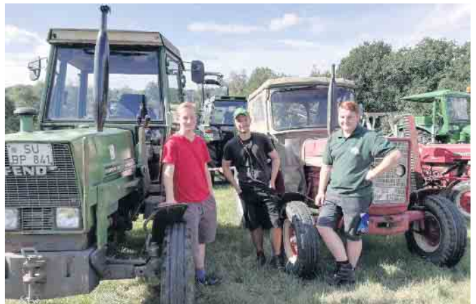
Die Dorfgemeinschaft Merten/Sieg und die Holderfreunde Eitorf hoffen, dass wieder viele Trecker und Holder präsentiert werden.

der wird einiges geboten. Das Jugend-Rot-Kreuz Eitorf wartet mit Aktionen und Outdoorspielgeräten. Auf der Hüpfburg können sich die kleinen Gäste austoben. Für Speisen und Getränke ist ebenfalls gesorgt. Über 50 Mitglieder der Dorfgemeinschaft und Unterstützer*innen sind im Einsatz, denen die Initiatoren für ihr Engagement danken. Der Erlös des Treckerfestes kommt der Dorfgemeinschaft zugute, die das Geld zum Wohl der Allgemeinheit verwendet. Gerade wurde der Bolzplatz neu angelegt. Ein Grillplatz, eine Feuerstelle und eine Sitzgruppe laden jetzt zum Verweilen ein. Eine zweite wird demnächst hinzukommen. Das Wichtigste jedoch sind die beiden nagelneuen Fußballtore, die von den Dorfkindern mit Begeisterung genutzt werden. Das Treckerfest wurde 2016 erstmals organisiert. Damals fiel