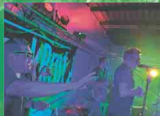
Fr. 29. Juli | STOCKBROT