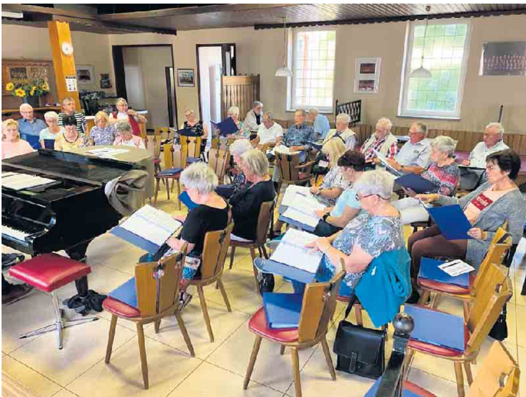
Singen macht Freude! Machen Sie mit!