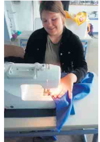
Jugendliche mit Freude beim Nähen