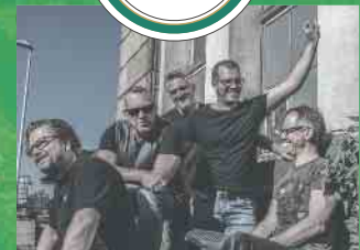
Sa. 13. Aug. | Grandmamas Backside