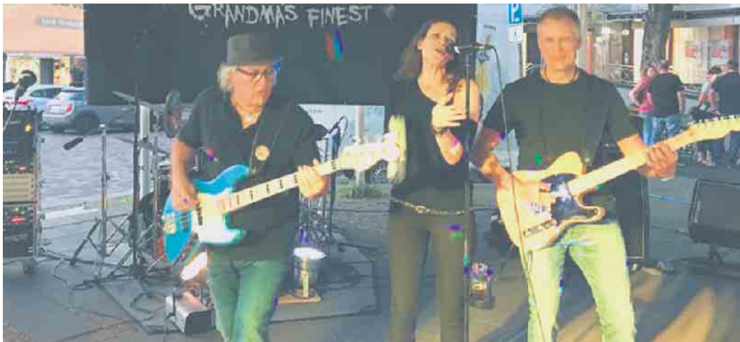
Grandma’s Finest - reine Spielfreude