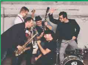
Fr. 22. Juli | LADYKILLER

* Der Glasverkauf für die Getränke ist obligatorisch. Das erworbene Glas ist an allen vier Veranstaltungstagen gültig.