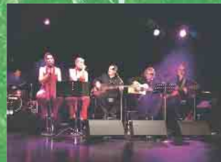
Fr. 05. Aug. | Zweifach Acoustic