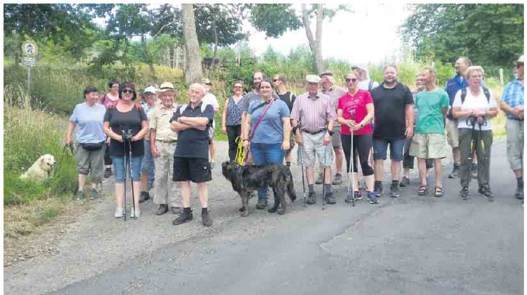
Teilnehmer der Wanderung

Der Ranchfest findet am 16. Juli statt und der Eintritt ist frei. Ab 19 Uhr spielt eine Live-Band.