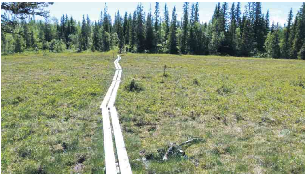
Ein weitläufiges Sumpfgebiet in der Nähe von Trondheim, Fotos: Reinhard Wagner