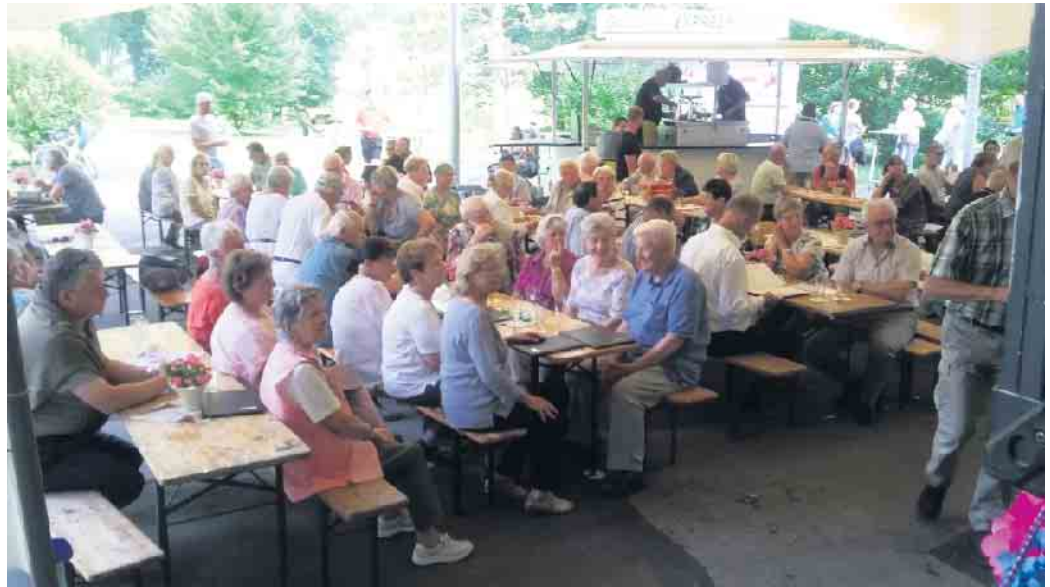
Besucher des Wanderfestes im Kurpark