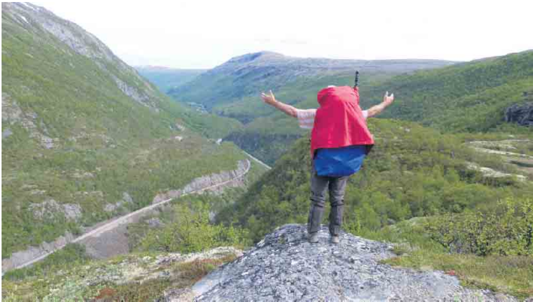
Unterwegs im Dovrefjell