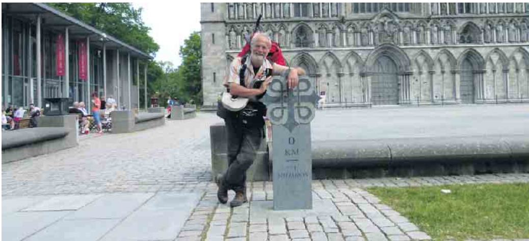
Angekommen: beim Meilenstein 0 vor der St. Olavskathedrale in Trondheim