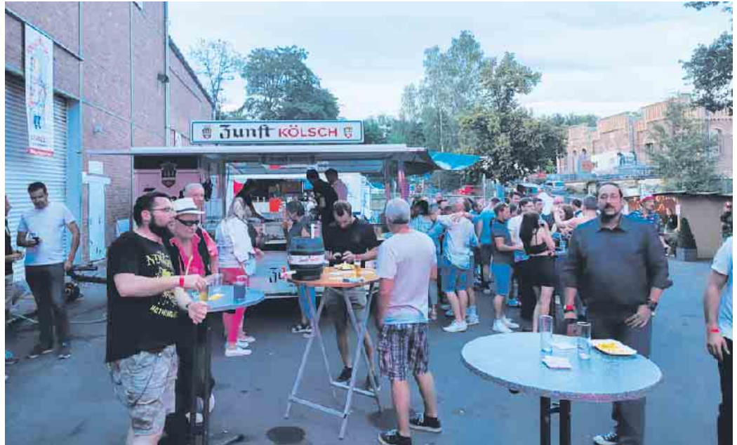
Sommerparty der KG-Schladern