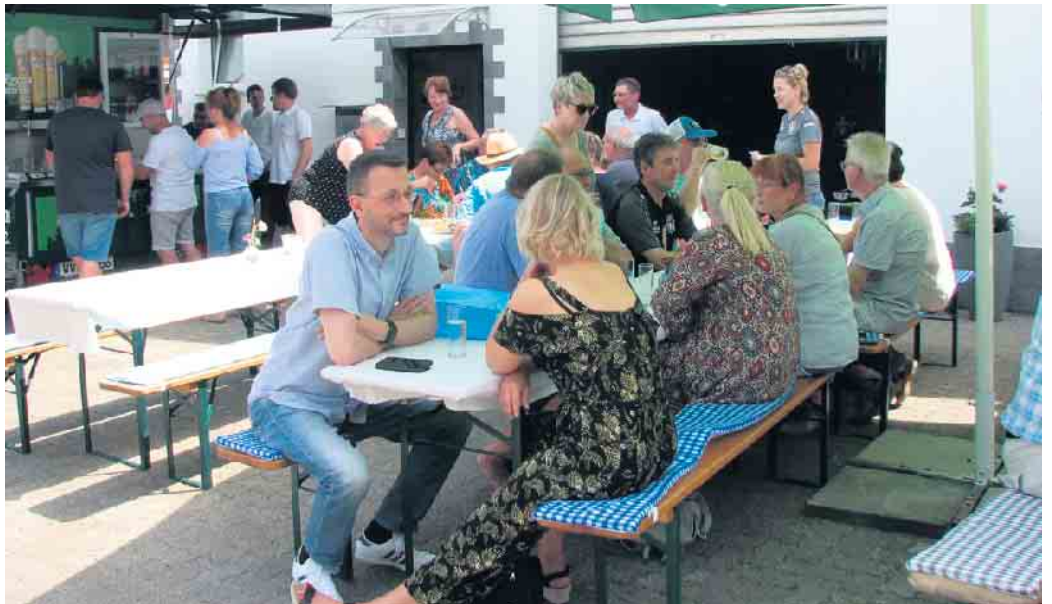
Die Gäste beim Firmenjubiläum in gemütlicher Runde

burger Hopfenmobil sorgte Getränke Hoffmann aus Hamm.