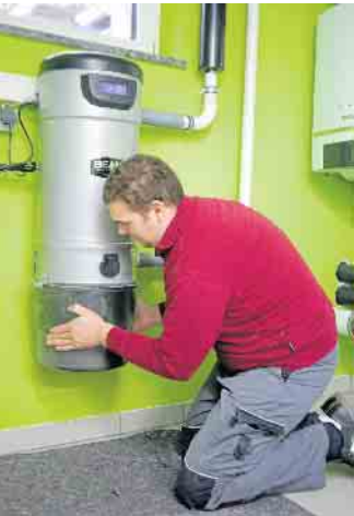
SHK-Berufe umfassen das ganze Spektrum der Haustechnik.

che spezialisieren. Auch ohne Abitur sind nach einer abgeschlossenen Berufsausbildung und etwas Berufserfahrung berufsbegleitende Studiengänge oder Vollzeitstudien zugänglich. (DJD)