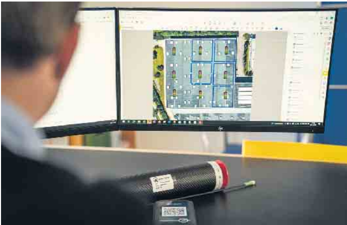
Die Überwachung erfolgt digital, bei kritischen Messwerten wird per Mail informiert.