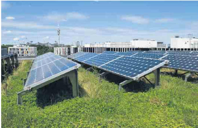
Photovoltaik und Gründächer- perfekte Synergie.

die den Zustand des Dachs überwachen und bei Bedarf rechtzeitig Warnungen senden können. So kann zum Beispiel Feuchtigkeit in Flachdächern schnell entdeckt werden. Schäden frühzeitig zu erkennen und zu minimieren, sorgt für längere Haltbarkeit der Dächer und damit auch wieder für mehr Nachhaltigkeit.