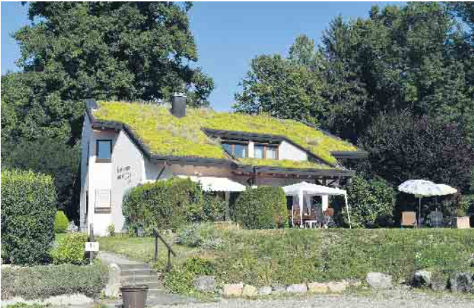
Auch Steildächer können begrünt werden.

den entlastet. Das schont und ist zugleich ein wichtiger Beitrag zur Fachkräftebindung und -sicherung. Smart Roofing: intelligente Dächer Mit der fortschreitenden Digitalisierung sind auch Dächer intelligenter geworden. Smart Roofing-Lösungen integrieren Sensoren,