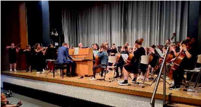
Orchester der 5. Klassen

Ensemblekonzert in der Schulaula und 6k united-Konzert