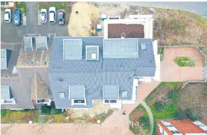
Drohnen liefern detailgenaue Bilder von Dächern.