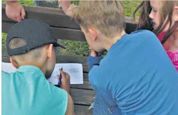
Rückblick auf letztes Jahr beim aktiven Rätseln

Die Aktionstage sind aufgrund einer Spende der CDU-Frauenunion aus den Einnahmen der Kleiderstube für jedes Kind kostenfrei. Das Angebot richtet sich an alle Kinder von 6 bis 14 Jahren, gleich welcher Konfession. Dabei freuen wir uns, dass mehrere Partner Unterstützung zugesagt haben, so dass wir unser Angebot ganz im Zeichen der Kinder bereichern konnten. Startpunkt ist jeweils mittwochs um 15 Uhr am Pfarrheim in Rosbach, gleich neben der katholischen Kirche St. Joseph