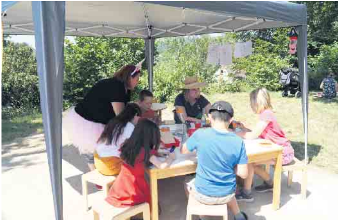
Der Bastelzauber, mit einer Gärtnerin und einem Einhorn.

Da staunten die großen und kleinen Besucher nicht schlecht, als sie am 17. Juni das Außengelände des Familienzentrum Vogelnest in Windeck-Rosbach betraten. Schon am Eingang wurden sie von einer waschechten Prinzessin begrüßt und trafen auch sonst auf eher ungewöhnliche Gestalten im Vogelnest. Piraten, Einhörner, Zwerge und sogar Rotkäppchen persönlich „verzauberten“ die Besucher. An zahlreichen Stationen gab es für alle Besucher, von ganz klein bis ganz groß, vieles zu entdecken: Vom Wichtel-Parcours über die Geschichten-Erzählerin (alias Rotkäppchen) im Märchenzelt bis hin zur Piraten-Schatzsuche im Sandkasten, bei der tatsächlich ein „echter“ Goldschatz gefunden wurde. Passend zum Thema war das Außengelände mit liebevoller, gemeinsam mit den Kindern angefertigter Deko, von vielen fleißigen Händen geschmückt worden. Dank unseres überaus