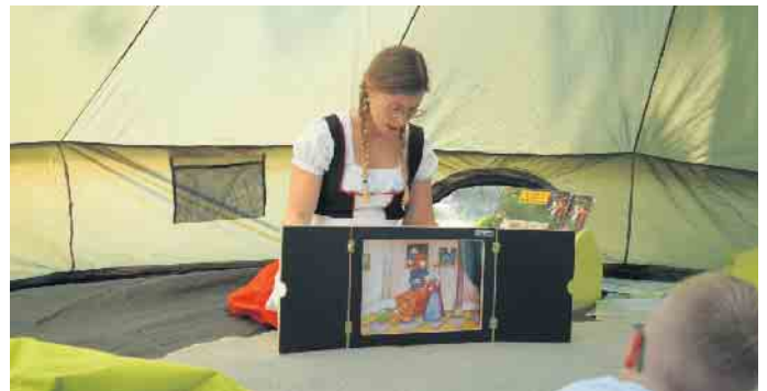
Rotkäppchen im Märchenzelt