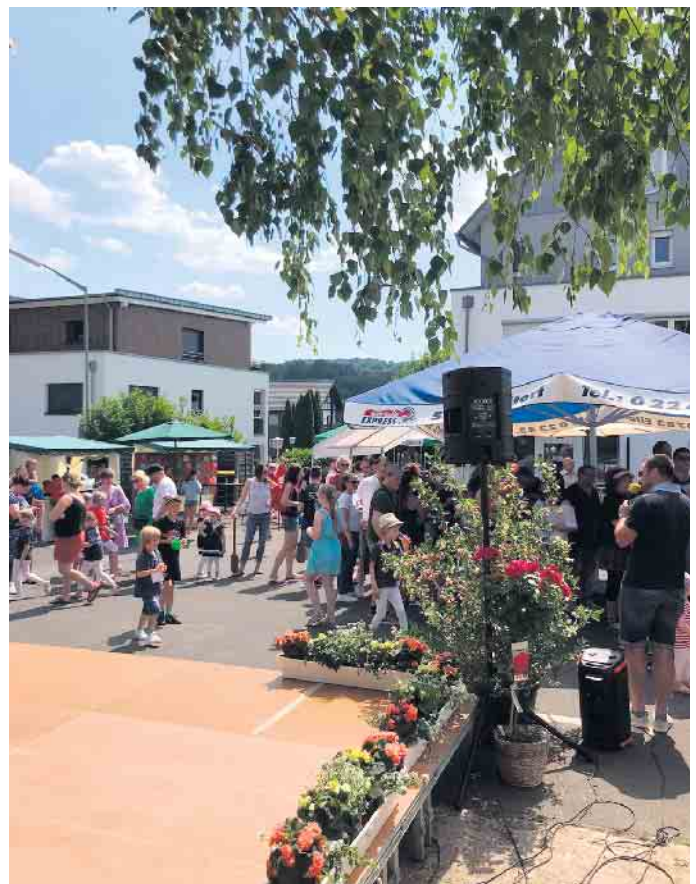
Großes Treiben beim Pfarrfest

Alles in allem ein gelungenes Fest, bei dem alle satt geworden sind und bei sehr angenehmer Atmosphäre die Möglichkeit hatten, sich nett zu unterhalten und