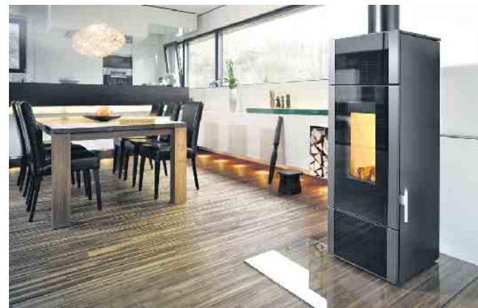
Kaminöfen mit moderner Technik sind eine Wertsteigerung für die Immobilie.