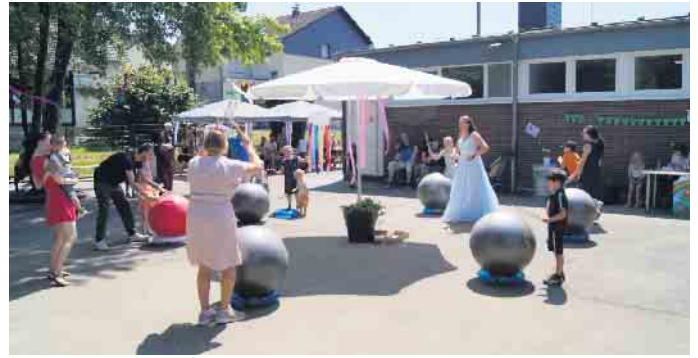
Der Trommel-Zauber im Vogelnest, mit einer Prinzessin

engagierten Fördervereins und zahlreichen spendenfreudigen Familien kam auch das leibliche Wohl nicht zu kurz und so konnten sich die Besucher mit Würstchen, Kuchen und Getränken stärken. Natürlich wurde auch wieder fleißig getrommelt und getanzt, was bei strahlendem Sonnenschein für tüchtig Hunger und vor allem Durst sorgte! Am Ende waren sich alle einig: Das war wieder mal ein wunderschönes und gelungenes Fest für und mit allen Beteiligten. Ein riesengroßes Dankeschön geht an alle fleißigen Helfer (bei einigen packte sogar die ganze Familie von Anfang bis Ende mit an), ohne die ein so erfolgreiches Fest nicht möglich wäre. Im nächsten Jahr feiert das Familienzentrum Vogelnest seinen 50. Geburtstag und dann sind alle interessierten Menschen aus Windeck und Umgebung eingeladen. Lasst euch überraschen und feiert mit uns mit. Familienzentrum Vogelnest