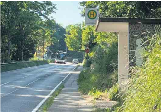
B256 in Fahrtrichtung Rosbach - Eine Gefahrlöse Querung ist für Schulkinder nicht gegeben