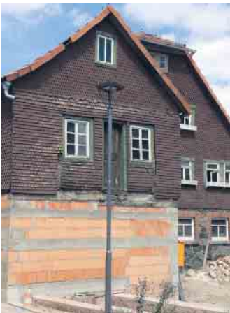
Bevor die Maler kamen, war die Mühle in einem traurigen Zustand.

Beispiel, spricht für sich selbst. Neben Denkmalpflege sind die Gestaltung und Pflege von Oberflächen im Innen- und Außenbereich Betätigungsfelder des Malers. Somit ist das moderne, zukunfts-trächtige Handwerk ein kreativer Beruf. Da es genug Arbeit gibt, lässt sich gutes Geld verdienen. Wer körperlich fit ist und nicht nur drinnen, sondern auch draußen arbeiten will, ist hier richtig. Hervorragende Aus- und Weiterbildungsmöglichkeiten, wozu auch ein duales Studium gehört, und auch die Möglichkeiten der Spezialisierung in den Bereichen Farbgestaltung und Kirchenmalerei, Bauten- und Korrosionsschutz ermöglichen es, Karriere zu machen. Die Nachwuchsförderung und damit die Zukunft der „Next Generation“ im Maler- und Lackierer-