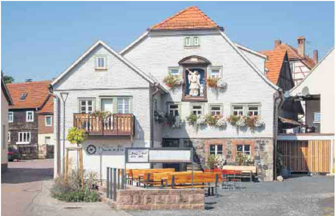
Wer die alte Mühle kannte, kommt aus dem Staunen nicht heraus.

handwerk ist wesentlicher Bestandteil der Caparol-Firmenphilosophie. Mit der Initiative „Mal Dir Deine Zukunft aus!“ werden Berufseinsteiger oder frischgebackene Selbstständige - mit einem breiten Förderangebot unterstützt. Mehr unter www.caparol.de/nachwuchsfoerderung (akz-o)