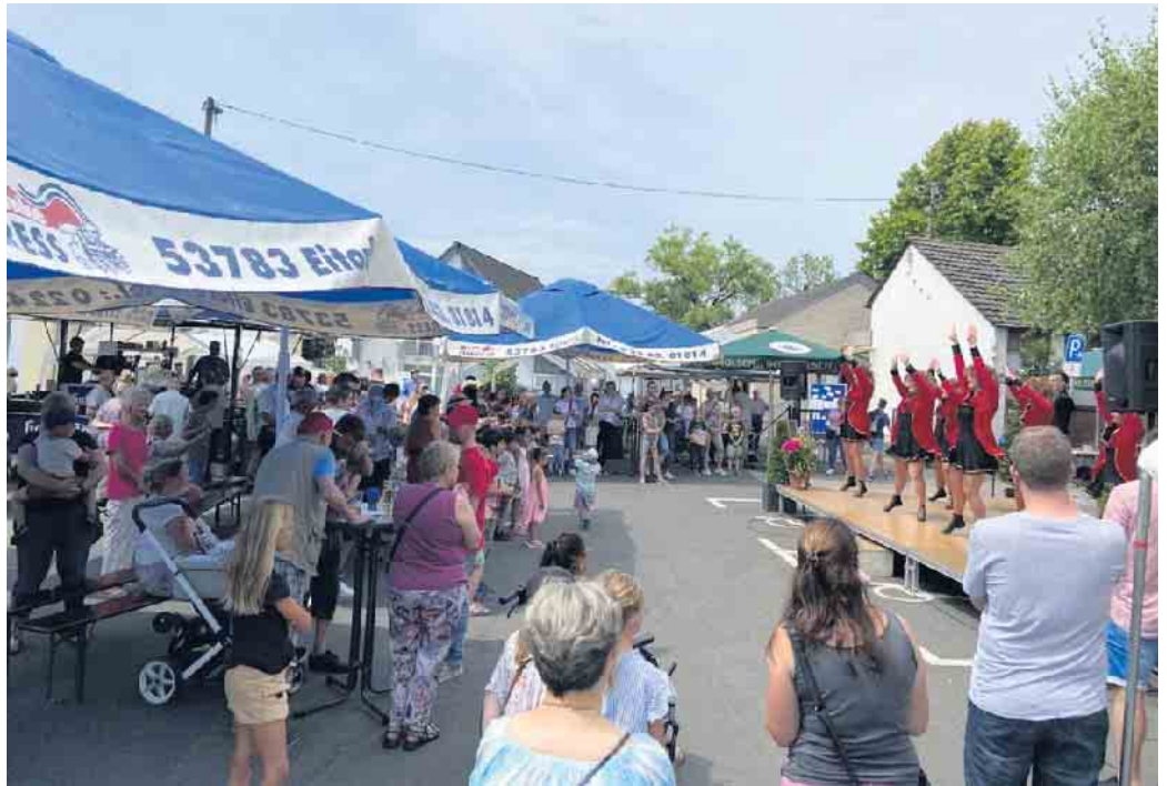
Tanzauftritt auf der Bühne bei großem Treiben

Den aktivsten Part wird aber das Spielemobil übernehmen, dass uns in der Zeit von 12 bis 17 Uhr dazu animieren werden, viel Action rund um St. Joseph zu haben. Dazu darf natürlich die Hüpfburg „Seaworld“ nicht fehlen.